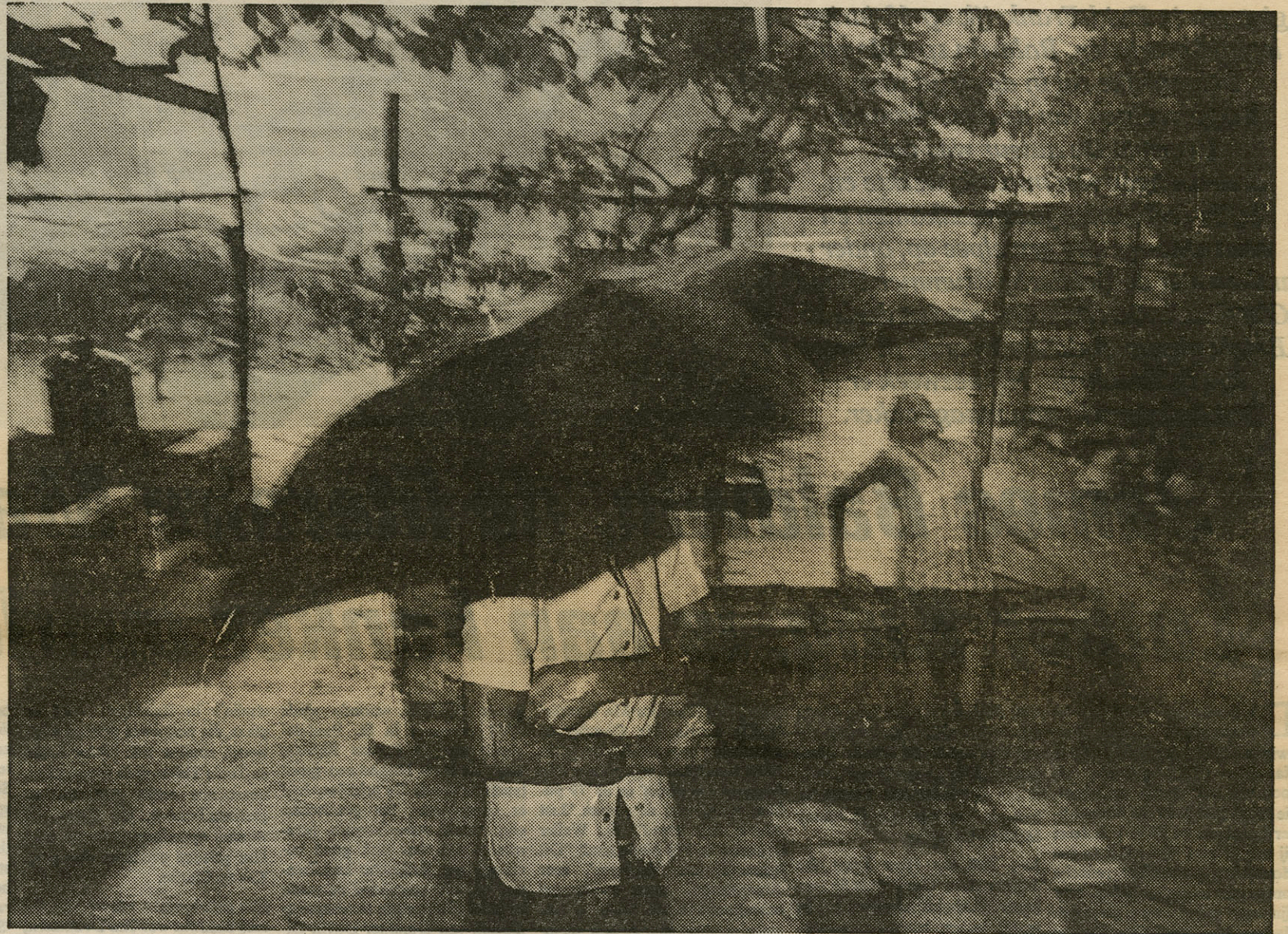
Gedurende drie 'grote vakanties' heeft De Keyzer India doorkruist, op zoek naar 'beelden', foto's die voor hem iets te betekenen hebben. (Foto Carl DE KEYZER).

een eigen techniek. Ik hou mijn toestel in de ene hand en mijn flits in de andere. Met die flits kan ik bewegen en met het toestel ook. Het toestel staat vast ingesteld. Ik gebruik diafragma 22, heb een kleine groothoek en met het vele licht van mijn flits heb ik dus een scherpe weergave van 80 cm tot oneindig. Ik richt me, op alles wat ik zie tussen de twee en de vier meter. Ik plak mijn diafragma- en scherpstellingring vast, en trek me daar verder niets van aan, alleen bij daglicht regel ik de belichting verder met de sluitersnelheid. Dat is dan eigenlijk wel een ingreep. Op die manier kunnen we de achtergrond donkerder of lichter maken".