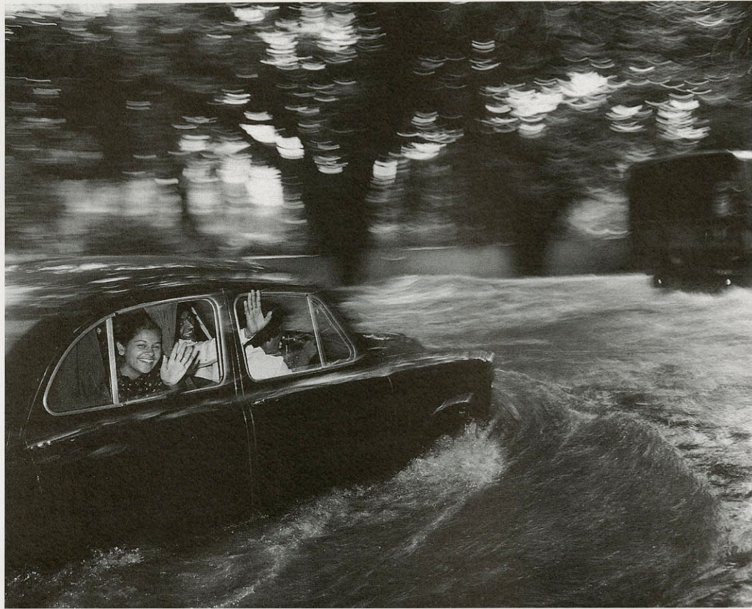
Carl DE KEYZER 1958