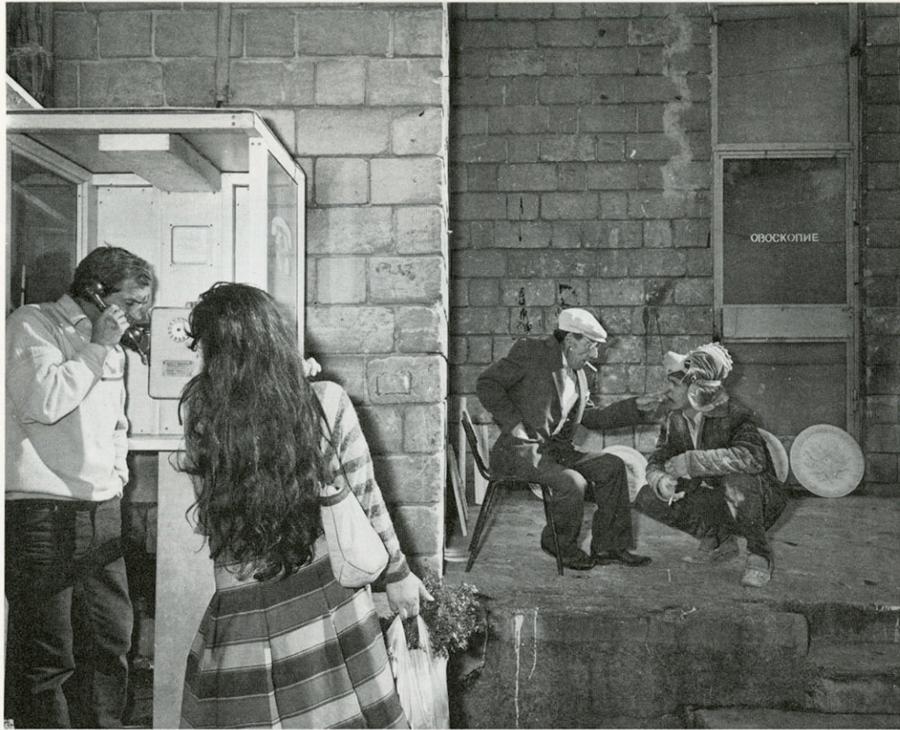
KISHINEV - MOLDAVIE