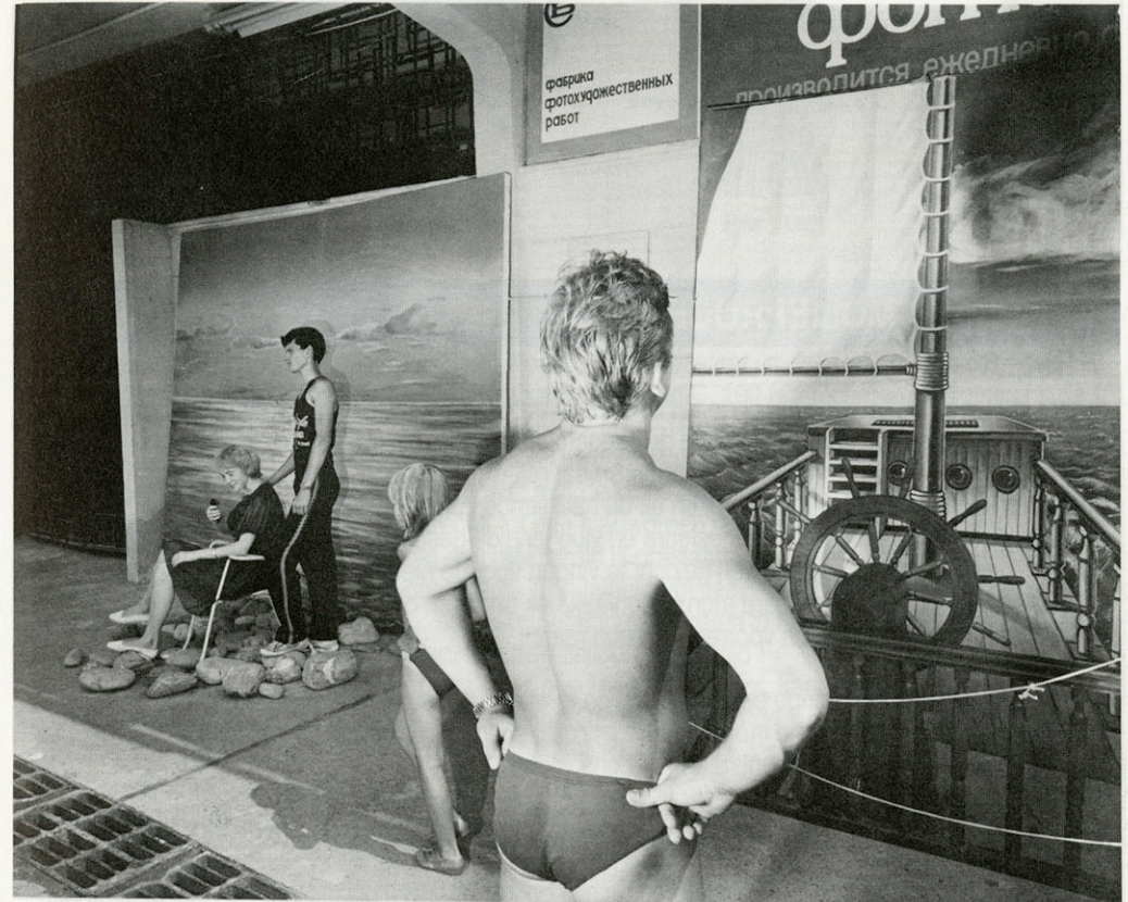
SOTCHI - ZWARTE ZEE