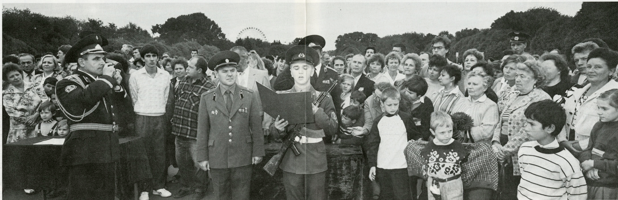
MOSKOU - GORKIPARK

Rusland is een heel statisch land. In vergelijking met "India" is zijn techniek daarom aangepast. De film dient hier om een effectlicht te bekomen dat de sfeer van het socialist-realisme of van de films van de jaren vijftig weergeeft. Het verwijst ook naar de Sovjet-schilderkunst waarin de personages op de voorgrond altijd erg helder worden afgebeeld. De panorama-foto's maken een belangrijk deel uit van het boek. Het is een boeiend format dat bovendien uitstekend past bij de horizontaal uitgestrekte sinteren. Door met de panor's groepen helemaal in beeld te brengen probeert hij de sfeer van een massabeweging te creëren. Verwijzing ook naar Russische affiches en propaganda waar veel panorama's gebruikt worden.