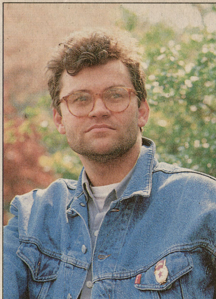
Carl De Keyzer.

Dat Carl De Keyzer hoog kunt u begrijpen door Homo Sovjeticus te bekijken. Dit kan in het Museum voor Hedendaagse Kunst te Gent van 27 april tot 27 mei 1990 elke dag van 10u tot 17u30. Let wel: maandag gesloten. P.V.O.