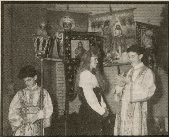
De mensen van de Grieks-ortodokse kerk komen samen tijdens de Epifanie. Toch iets poëtisch.