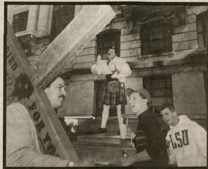
Mardi Gras, New Orleans, Louisiana. Een predikant op de voorgrond, een paar jongeren met een pilsje en een schotse clown op de achtergrond. Een typisch Carl-De-Keyzer-moment.

hoofd koel te houden. Carl De Keyzer is onbekendbaar.