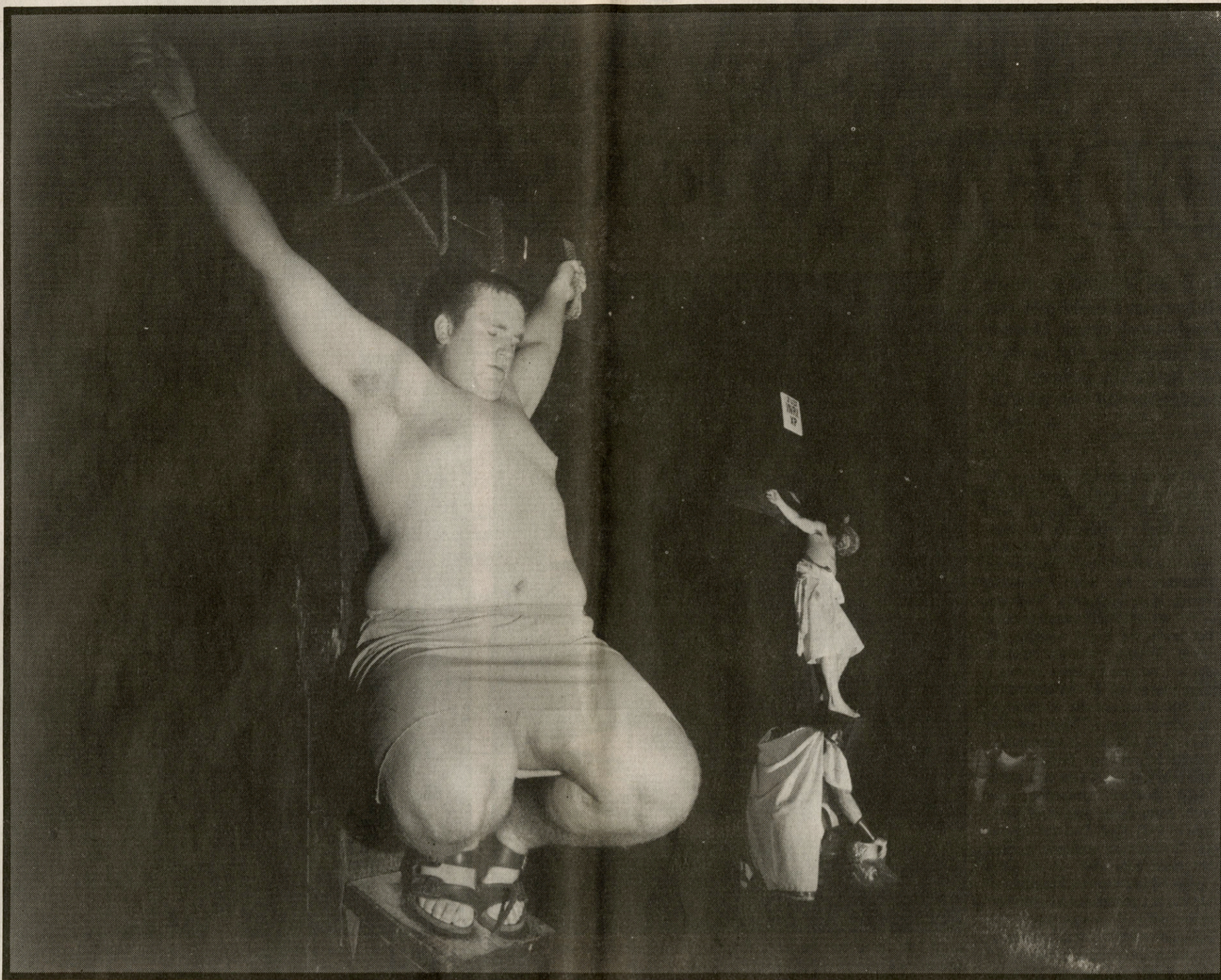
'The Great Passion Play' in Eureka Springs, Arkansas. Elk dag wordt hier voor een publiek van drie- tot vierduizend toeschouwers het passiespel opgevoerd. Het is een soort pretpark-gebeuren met een 'Bible World' in de buurt. Op de voorgrond zien we 'de goede moordenaar'.

van zes maal zeven centimeter. Dat geeft nog scherpere afdrucken, zelfs bij het gebruik van de meer korrelige hooggevoelige films. De scherpte van Carl De Keyzers foto's is al zo ongewoon groot dat de kijker daar al, misschien onbewust, door getroffen wordt. De foto's geven een scherpere indruk dan de werkelijkheid. Elk onderwerp dat op die manier wordt gefotografeerd, heeft een verrassend effect. Het effect waarbij details in beeld vaak een grote rol gaan spelen.