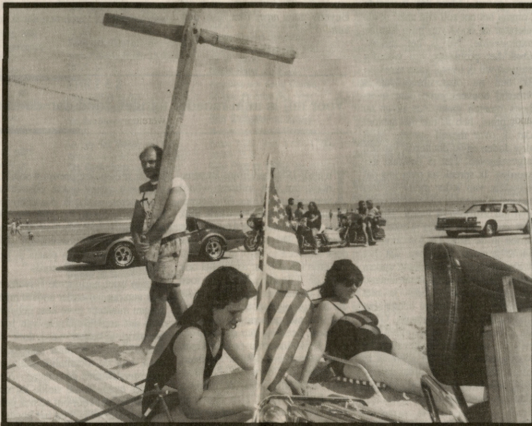
In Daytona Beach, Florida, kwamen op de vijftigste verjaardag van de 'bike week' 400.000 motorfanaten samen, met hun Harley Davidson — maar ook de predikanten waren present, met hun kruis.