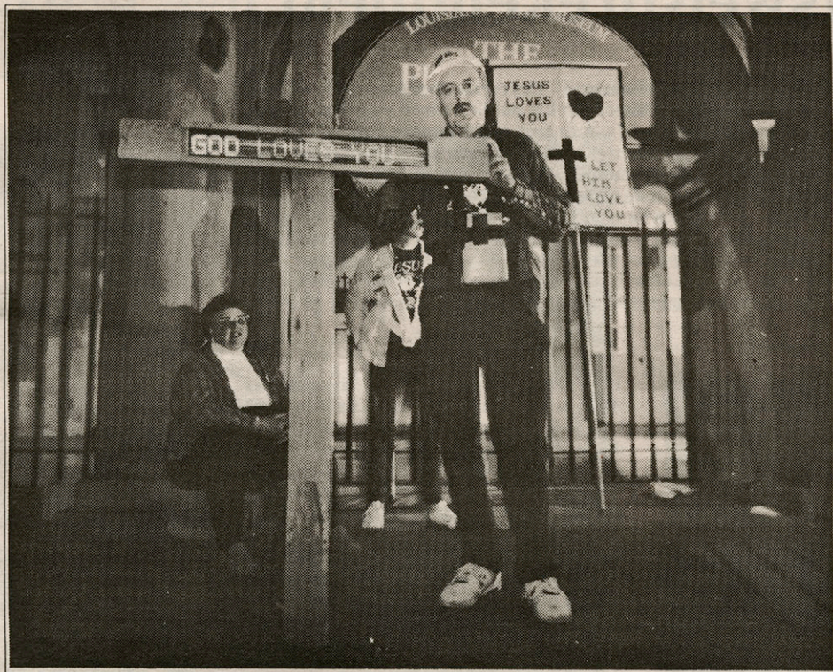
Carl De Keyzer

Religieuze parade gehouden door pentecostalen kerken en predikanten tijdens het Mardi Gras carnaval op Jackson Square en Bourbon Street, New Orleans/Louisiana, Februari 1991. "Als tegengif voor het zondige gebeuren van Mardi Gras vertrekt vanavond van Jackson Square een religieuze parade. Om zeven uur 's avonds staat het pleintje al behoorlijk vol met predikanten en hun vaandels. Een man draagt een kruis met ingebouwde "running lights" op batterij. Zijn elektronische boodschap luidt afwisselend: GOD IS LOVE, JEZUS IS KING en JEZUS IS REAL".