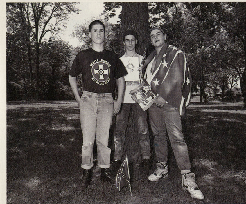
Jonge neo-nazi's en skinheads worden steeds vaker gesignaleerd op bijeenkomsten van de Ku-Klux-Klan. Er is zelfs contact gelegd met ultra-rechtse jongeren in Duitsland. En volgens Der Spiegel zijn verscheidene Klanguroepen opgericht