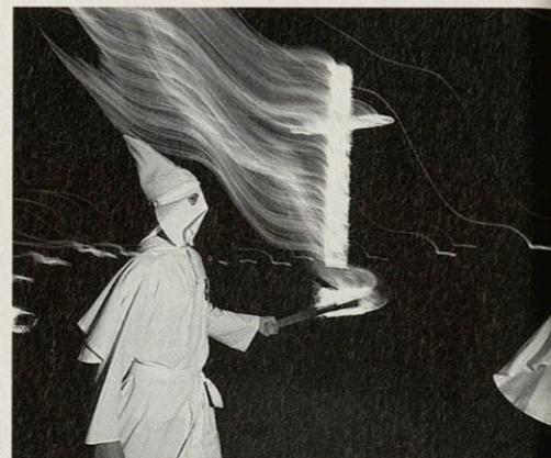
In een nieuw vakantiecentrum kunnen vader, moeder en kinderen zich binnenkort de KKK-ideologie eigen maken. Daarbij speelt de oude Confederatie-vlag een belangrijke symbolische rol. De beweging biedt zuiderlingen van oudsher de mogelijkheid hun frustraties over de verloren burgeroorlog- en daarmee the southern way of life - op negers bot te vieren