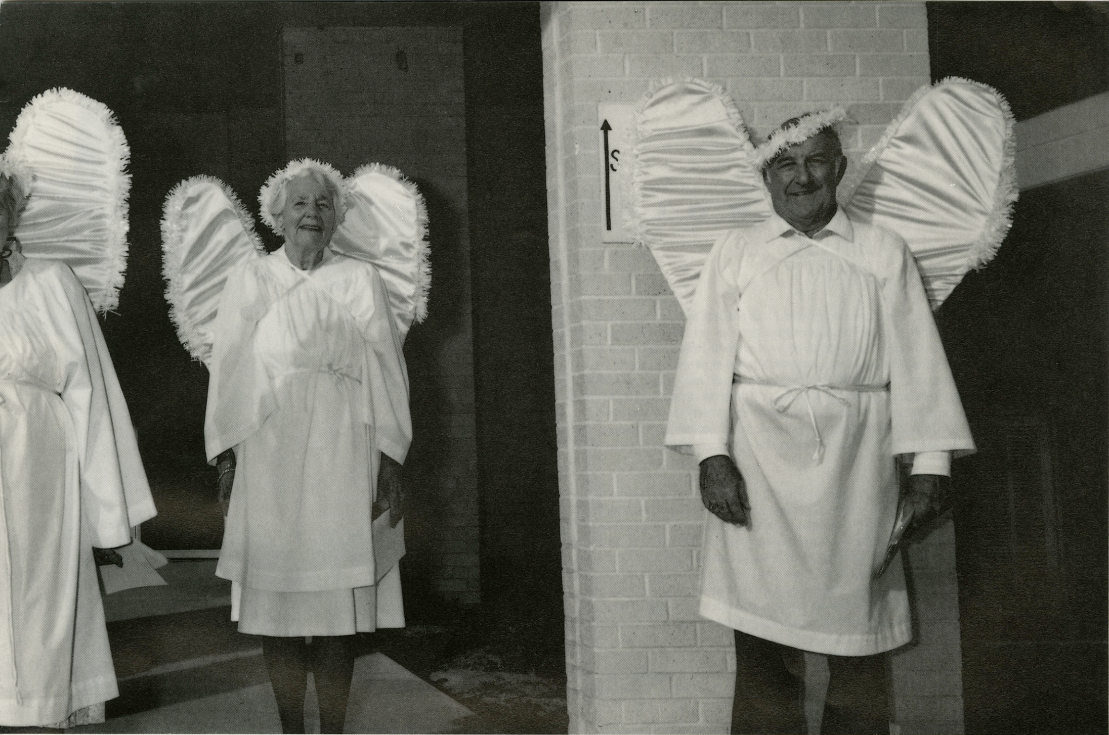
De Bary, Floride, Décembre 1990