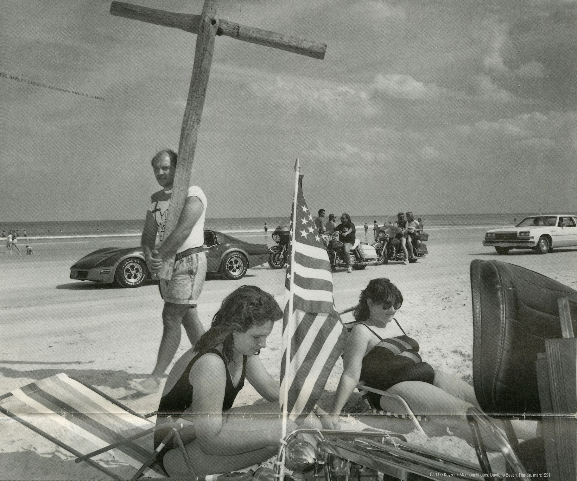
Carl De Keyzer / Magnum Photos. Daytona Beach, Floride, mars 1991