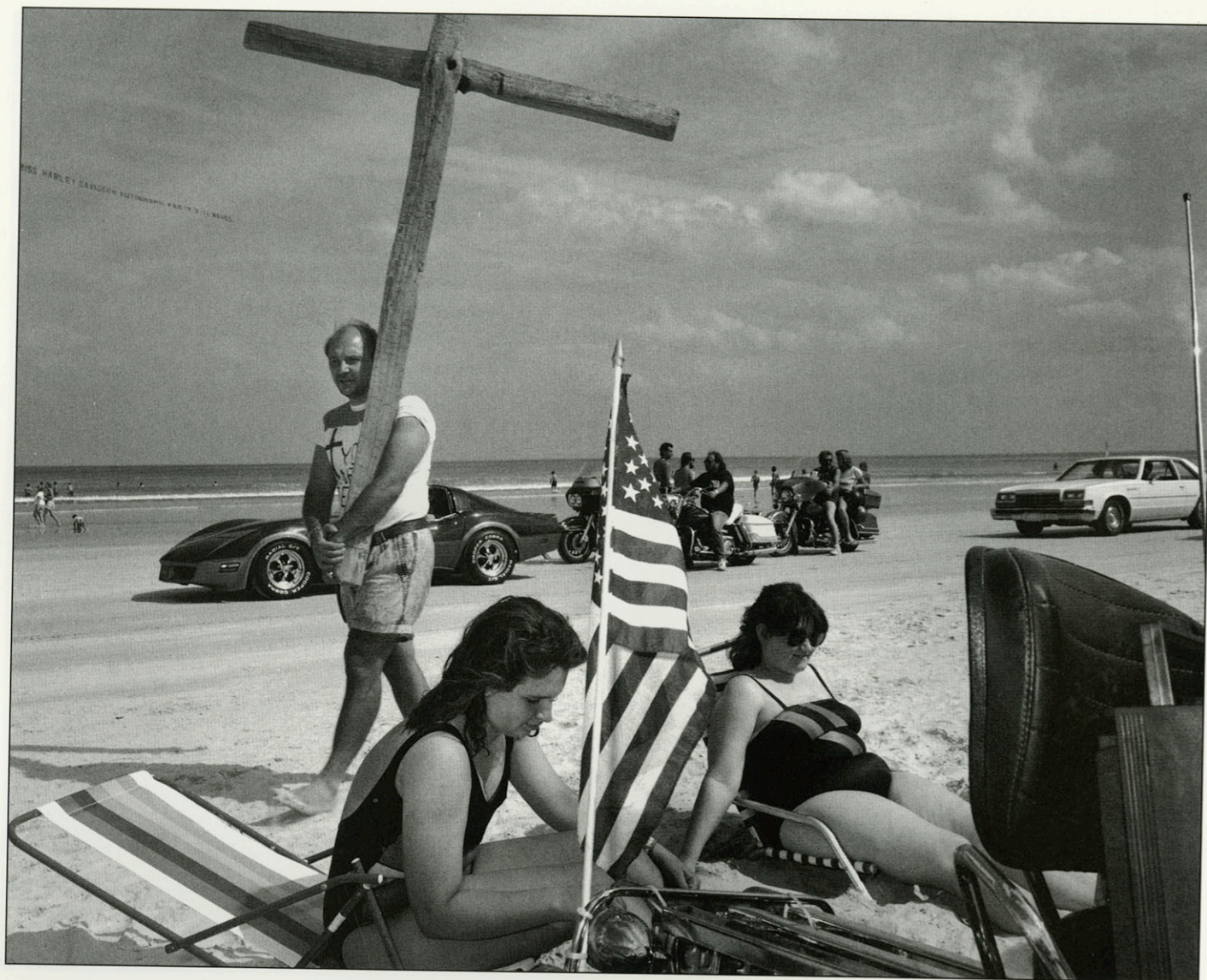
PREDIKANT MET HOUTEN KRUIS OP HET STRAND OP DE VIJFTIGSTE VERJAARDAG VAN DE BIKE WEEK (400.000 DEELNEMERS). DAYTONA BEACH, FLORIDA, MAART '91.

Volgens Carl De Keyzer vertegenwoordigt de kerk -om alle geloven voor het gemak zo bij elkaar te pakken- alle lagen van de bevolking. Rijk en arm zitten naast elkaar op de banken. Hij kon de mensen vrij gemakkelijk fotograferen. "Of ze nou met hun handen zwaaien of wat anders, het maakt hen helemaal niet uit of er een camera in de buurt is. Als ze eenmaal weten dat je toestemming hebt, doen ze gewoon wat ze willen."