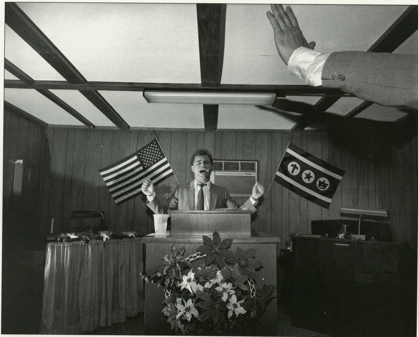
EEN INGEHUURDE PRIESTER, GEFLANKEERD DOOR DE AMERIKAANSE VLAG EN DIE VAN DE CHURCH OF GOD OF PROPHECY, PREEKT TIJDENS EEN REVIVAL-SESSIE VAN DEZE PINKSTERGEMEENTE MET HAAR TIEN LEDEN. NEW SMYRNA BEACH, FLORIDA, DECEMBER '90.

den, moet je daar echt naar op zoek, in grote steden. Een goed boek, een degelijk opinieërend tijdschrift, een film met diepgang zijn nauwelijks te vinden. Dat ging ik dus in de gaten houden."