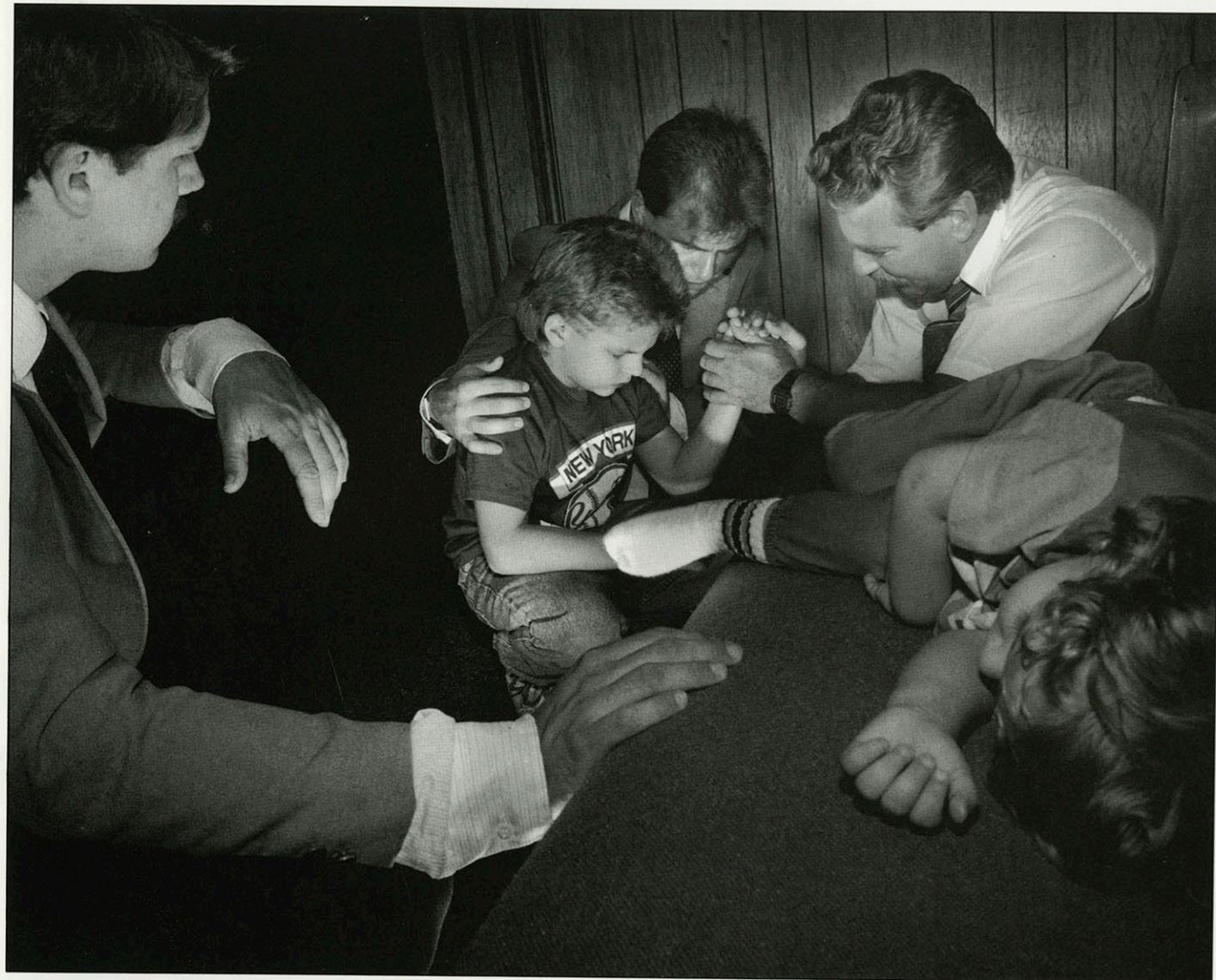
IN DE CHURCH OF GOD OF PROPHECY WORDT PINKSTEREN GEVIERT OM NIEUWE LEDEN TE WERVEN. HIER WORDT EEN 9- JARIGE JONGEN 'GERED' DOOR ZIJN OUDERS EN EEN PRIESTER. NEW SMYRNA BEACH, FLORIDA, DECEMBER '90.