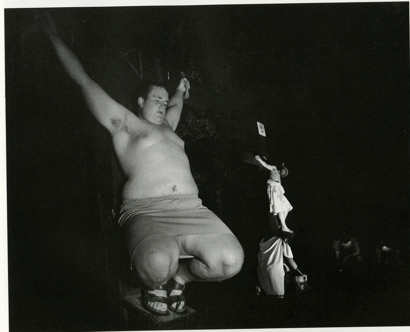
HET GREAT PASSION PLAY IS HET VERHAAL VAN HET LEVEN VAN JEZUS. HET WORDT ACHT MAANDEN PER JAAR, AVOND AAN AVOND OPGEVOERD VOOR ZO'N 4000 TOESCHOUWERS. EUREKA SPRINGS, ARKANSAS, APRIL '91