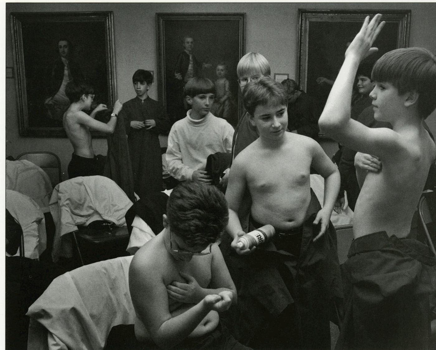
JONGENSKOOR BEREIDT ZICH VOOR OP OPTREDEN IN DE KAPEL VAN DE WASHINGTON AND LEE UNIVERSITY. DE KELDER VAN DE UNIVERSITEIT, WAAR DE JONGENS ZICH OMKLEDEN EN MET DEODORANTSPRAYS OPFRISSEN, IS TEVENS MUSEUM VAN AMERICAN HISTORY. LEXINGTON, WEST-VIRGINIA, OKTOBER '90.

"Kerken in de VS worden niet gesubsidieerd. Ze genieten belasting-voordeel maar moeten zelfstandig commercieel overleven. Daar verwijst de titel van mijn boek ook naar: God Incorporated, want eigenlijk is die 'god' gewoon een produkt van een bedrijf. De titel slaat niet op het maken van woekerwinsten, hoewel dat ook gebeurt. Het staat vast dat het geloof big business is, een gat in de markt. Het is niet voor niets dat er zoveel geloofsovertuigingen de Verenigde Staten als voedingsbodem hebben. Het is ook niet voor niets dat de media er zoveel aandacht aan besteden en dat iedere popidool minstens één of twee religieuze nummers op zijn elpee heeft staan. Ik twijfel door al die commercie niet aan de oprechtheid van de gelovigen, integendeel, maar ze laten zich wel in