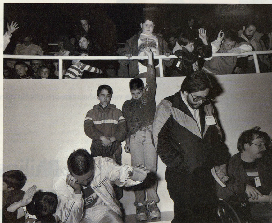
Kinderen en ouders tijdens het optreden van de 'bodybuilders voor Christus', Dallas, maart 1991

In 1831 bezoekt een jonge Fransman de Verenigde Staten. Alexis de Tocqueville bekijkt de Nieuwe Wereld met de blik van een antropoloog en noteert in zijn beroemd geworden reisverslag de verschillen met het Oude Europa. Zoals: „De sekten die in de Verenigde Staten bestaan zijn ontelbaar. Ze verschillen allemaal waar het de eerbied betreft die de Schepper toekomt; maar ze stemmen allemaal overeen waar het de plichten betreft van mens tot mens. Elke sekte vereert de Godheid op zijn eigen wijze, maar alle sekten prediken dezelfde morele wet uit naam van God. Hoewel het van het allergrootste belang is voor de mens, als individu, dat zijn religie waar is, is dat niet zo voor de maatschappij. De maatschappij heeft geen toekomstig leven om op te hopen of voor te vrezen; en aangenomen dat de burgers een religie belijden, dan is de specifieke doctrine van die religie van weinig betekenis voor haar belangen. Daarbij maken alle sekten in de Verenigde Staten deel uit van de grote eenheid van het Christendom, en de Christelijke moraal is overal dezelfde.”