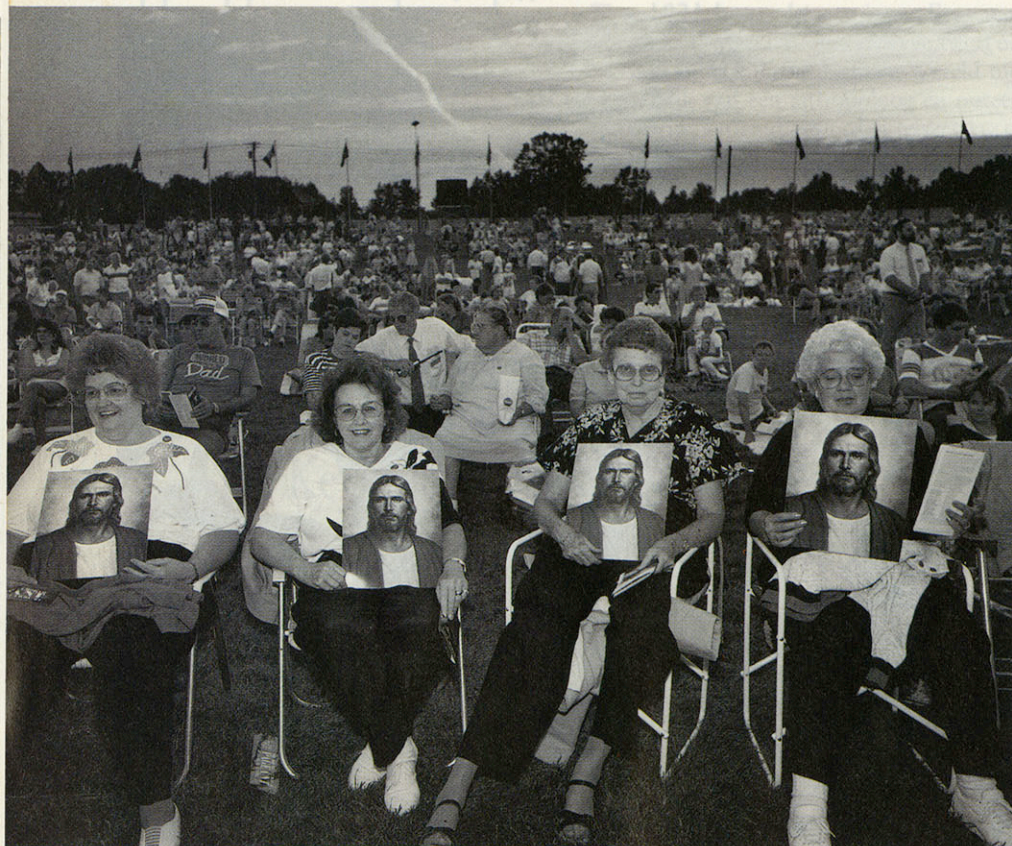
Publiek bij het Hill Camorrah-spektakel, georganiseerd door de Mormoonse kerk, Palmyra/New York, juli 1990

werk van Robert Frank, ook een Europeaan die Amerika in kaart heeft gebracht. Dezelfde bijna achteloze composities, waarin hoofden wegdraaien en handen op de voorgrond verschijnen, maar er is een verschil. De foto's van Frank hebben altijd iets verstolens; hij is een kiekjesdief. De Keyzer heeft met twee woorden om zijn beelden gevraagd. Niemand is betrap, de camera wordt zorgvuldig in de gaten gehouden.