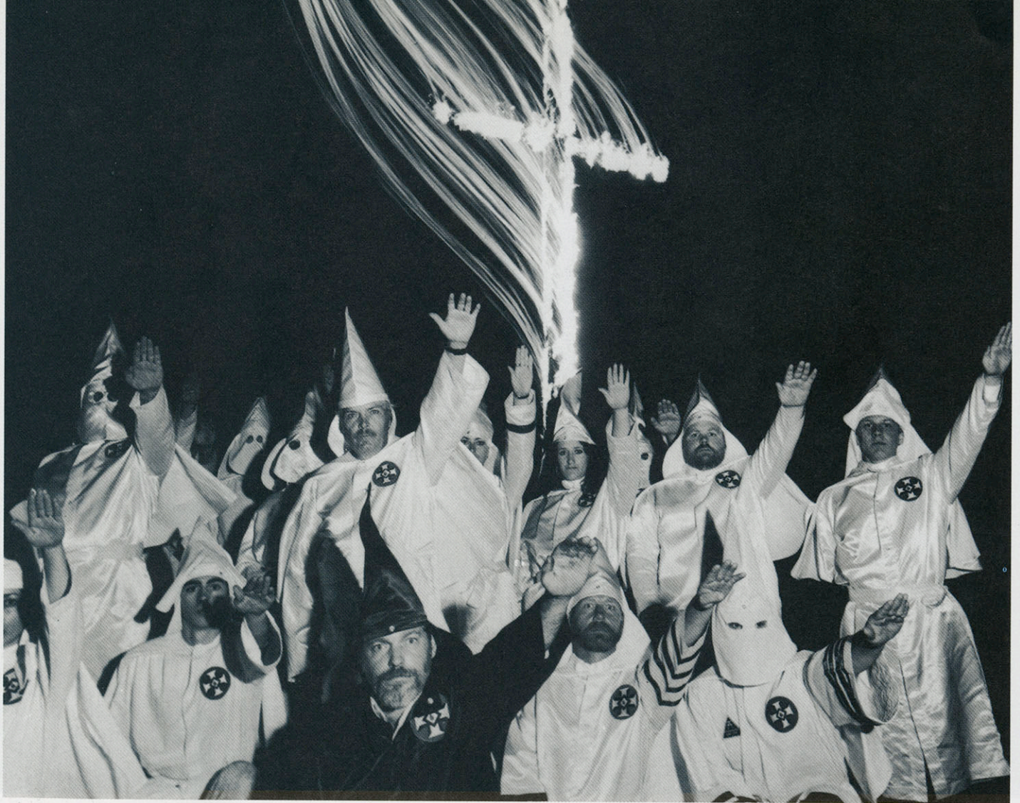
Ku Klux Klanin palava risti -seremonia. Hico, Texas.