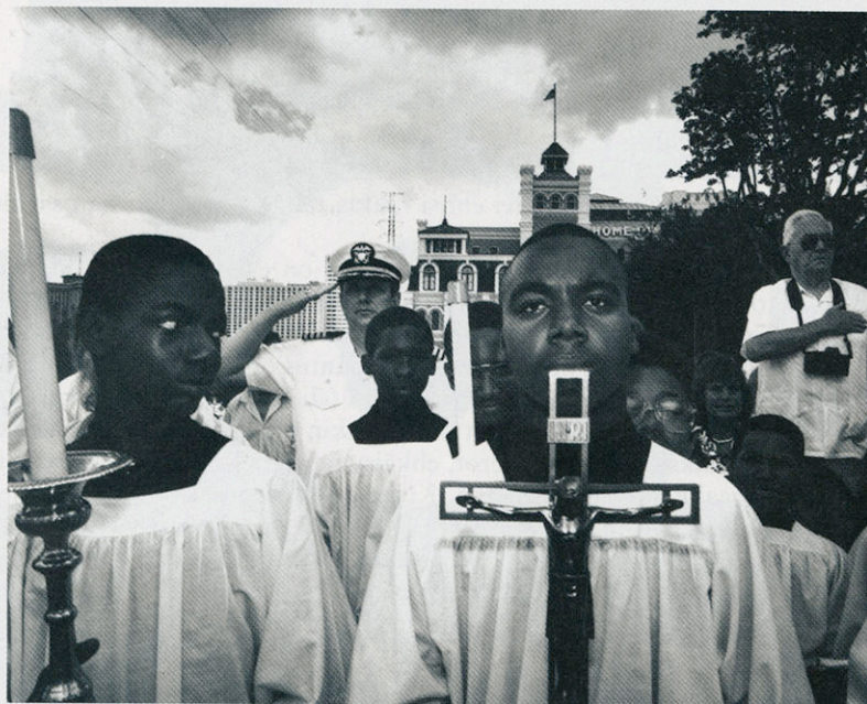
Amerikan kansallislaulun hetki katolisen kirkon järjestämän Mississippi-joen pyhi- tysseremonian aikana. New Orleans, Louisiana.