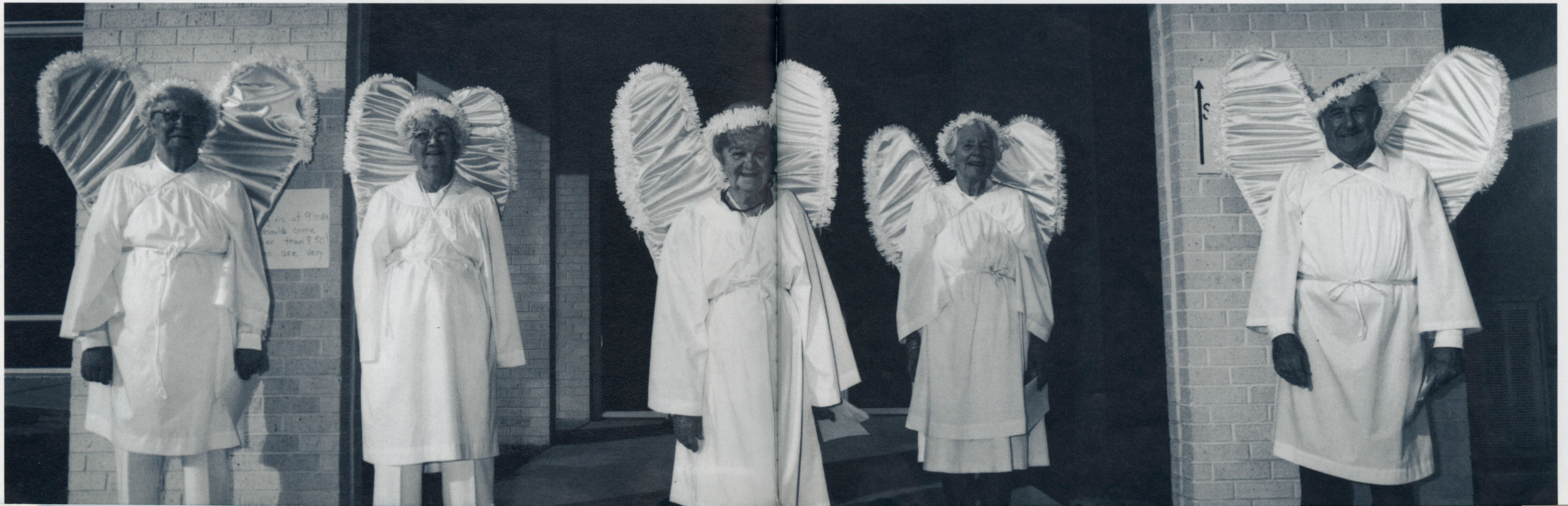
De Baryn ensimmäisen presbyteerisen kirkon joulukuvaelman esittäjiä. De Bary, Florida.