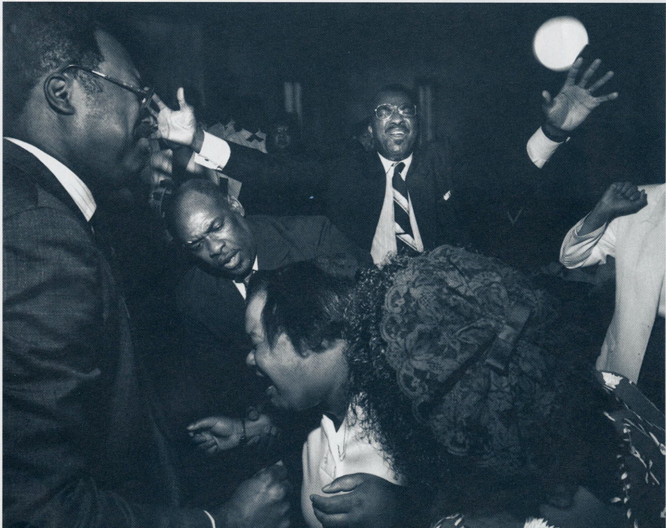
Transsissa olevia naisia helluntaijumalanpalveluksessa meidän herramme Jeesuksen Kristuksen kirkossa. Memphis, Tennessee.