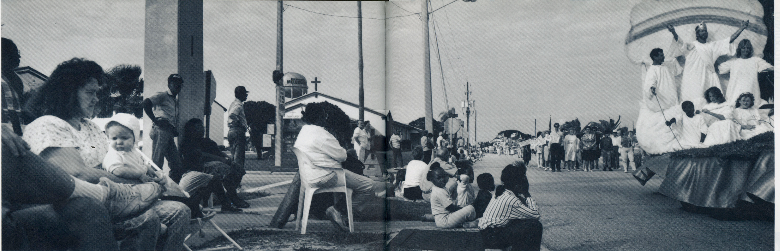
Uskonnollinen jouluparaati, jonka 30 paikallista kirkkokuntaa järjesti vaihtoehdoksi kaupallisille jouluparaateille. Melbourne, Florida.