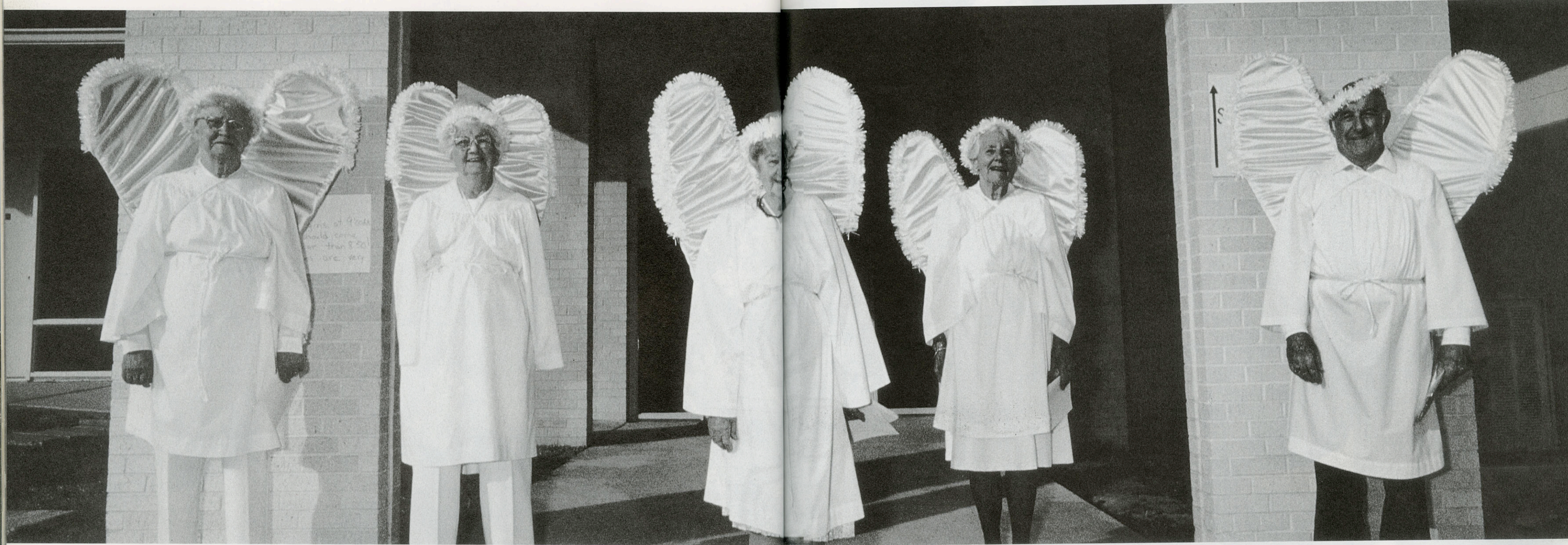
Ci-dessus : Pour son grand spectacle de Noël la Première Eglise presbytérienne de De Bary, en Floride, déguise ses fidèles en anges.