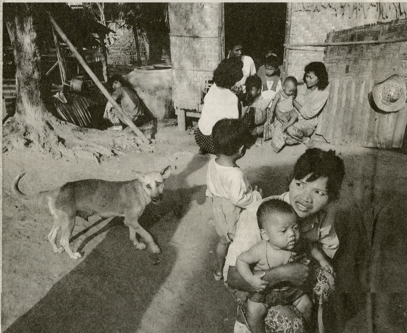
Een AzG-medewerkster registreert gezinnen voor opname in het ziekenhuis.