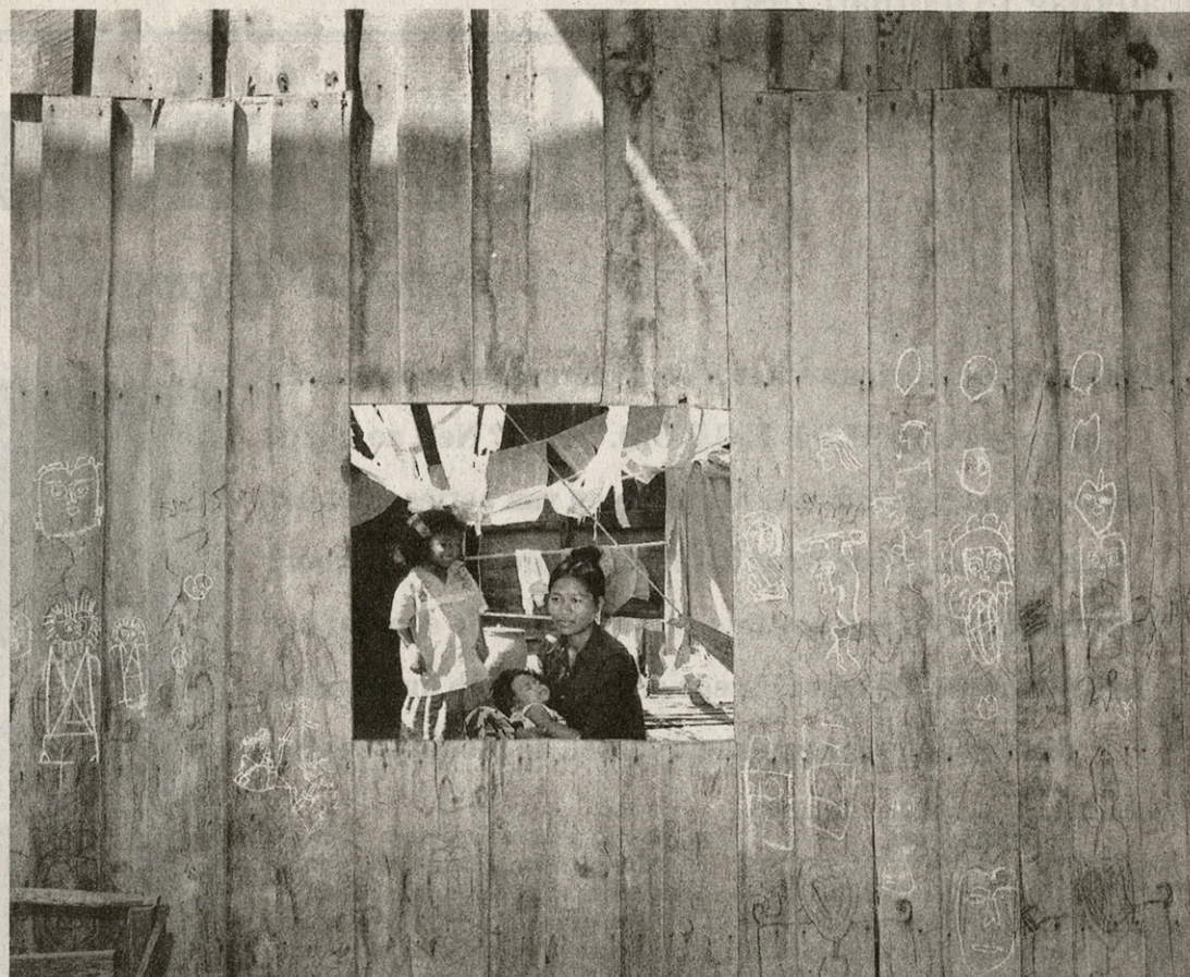
Vluchtelingenkamp in Thmar Pouk: vrouwen en kinderen in open barakken.

Vanuit een schuilplaats bij de Thaise grens, bewaakt door het Thaise leger, leidt Pol Pot nog steeds de Rode Khmer. Alle over-