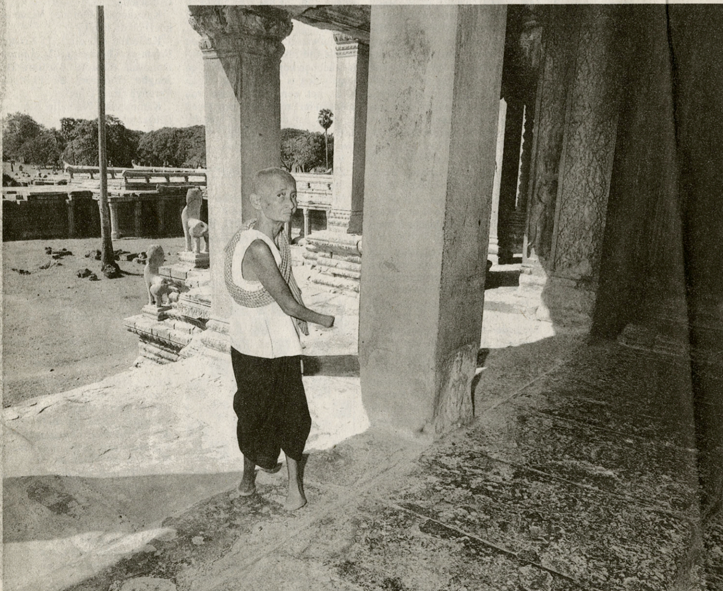
Gehandicapte vrouw in Angkor Wat: oorlogsleed in het symbool van 's lands grandeur.

lopers die hem hebben meege- maakt, net als degenen die hem vroeger hebben gekend, beschrijven hem als innemend en hoffelijk. Hij is nu 66 en, niet zo lang geleden nadat zijn eerste vrouw krankzinnig was geworden, is hij hertrouwd met een vijfendertig jaar jongere vrouw. Hij heeft een dochtertje met haar en schijnt daar heel lief mee te zijn.