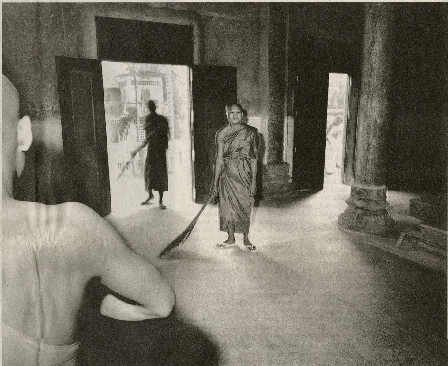
Monniken maken een recentelijk gerestaureerde tempel schoon in Phnom Penh.