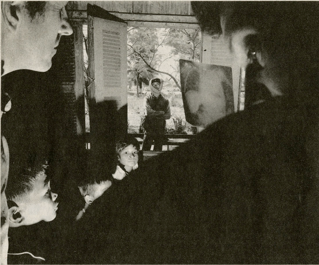
Het door Artsen zonder Grenzen gesponsorde ziekenhuis van Thmar Pouk.