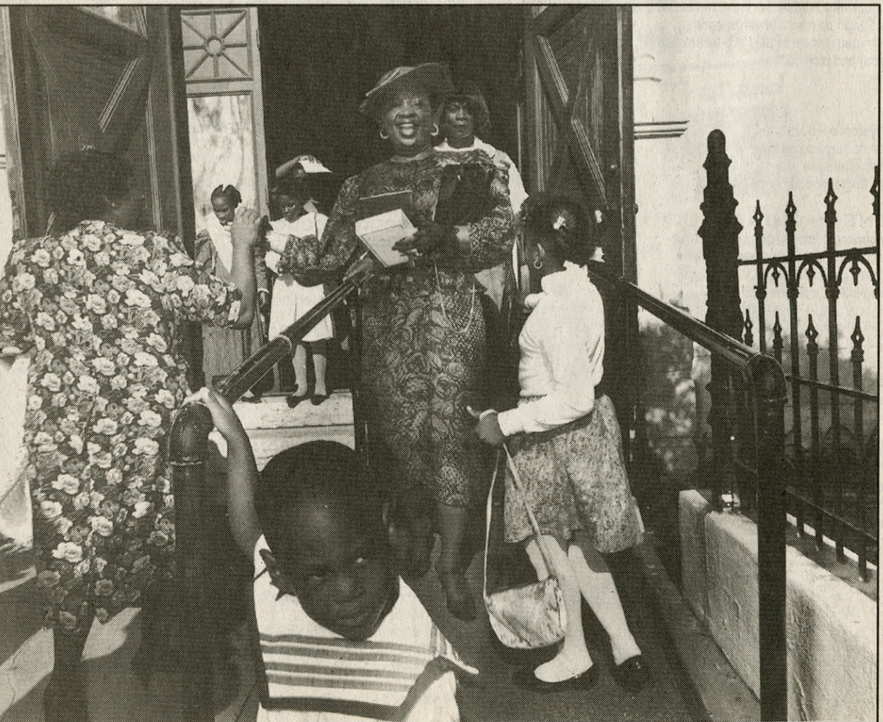
● Baptist kerkdienst, november 1990, Savannah, Georgia. (Uit: 'God inc.')

bestaat die waakt over het moraal. Die nadenkt over dingen als euthanasie en abortus. Maar de manier waarop de katholieke kerk dat doet, daar ben ik het absoluut niet mee eens. Al dat machtsvertoon van pous, pastoors en paters. Wat mij betreft mogen ze het Vaticaan afbreken en er een organisatie zoals Artsen Zonder Grenzen of Amnesty International neerzetten. Die doen goed werk en dat op een pure, zuivere manier. „God is big business in de VS.