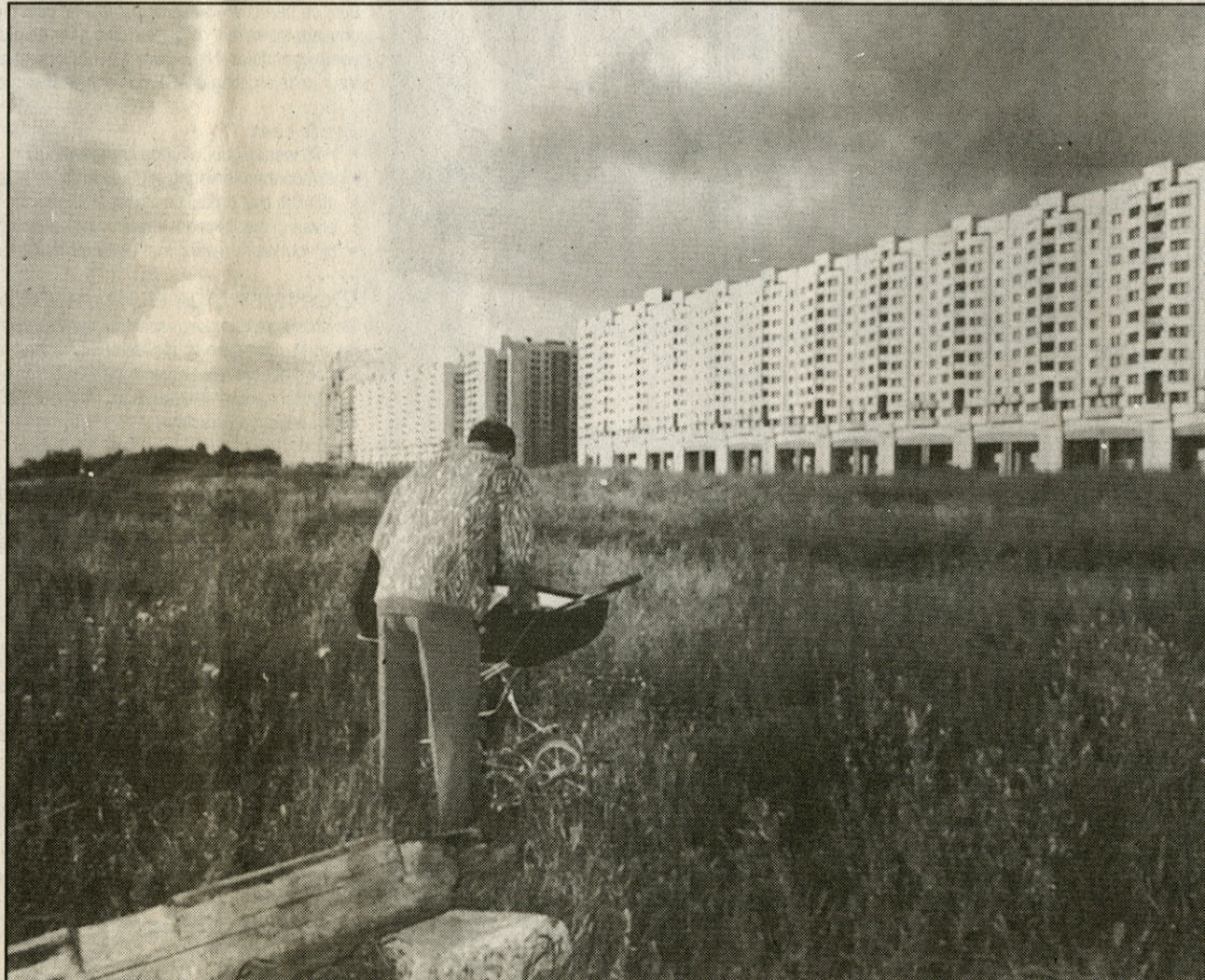
● Leningrad, augustus 1988. (Uit: 'U.S.S.R./1989/C.C.C.P.')