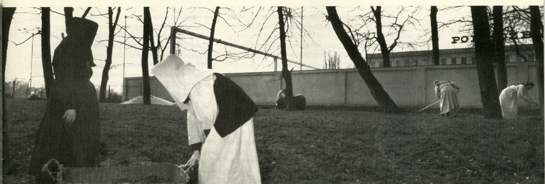
Nova Huta april 1994 . 'Nuns working in de garden of the St.Albertine monastery'

De Amerikaanse kunstenaar Jeff Wall speelt ook met de werkelijkheid, maar hij ensceneert alles. Die gaat bijvoorbeeld op 5th Avenue met een ploeg van 15 man een opname maken op 4"x 5" van een voorbijgangster die struikelt over een dakloze. Alles heel banaal. Die voorbijgangster oefent een paar keer en de dakloze is goed geschminkt. Dat is dan ineens grote kunst. Maar in de fotografie hebben wij die absurditeit al jaren, en als wij het uitvergroot aan de muur bij het Museum of Modern Art hangen, heb je hetzelfde."