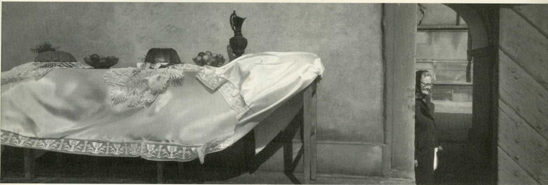
Kalvaria Poland april 1994 . 'Good friday procession. Last supper table'