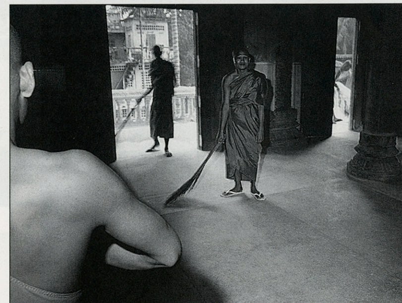
monniken wegen de onlangs gerestaureerde boedhistische tempel school, Phom Pehn, Cambodja