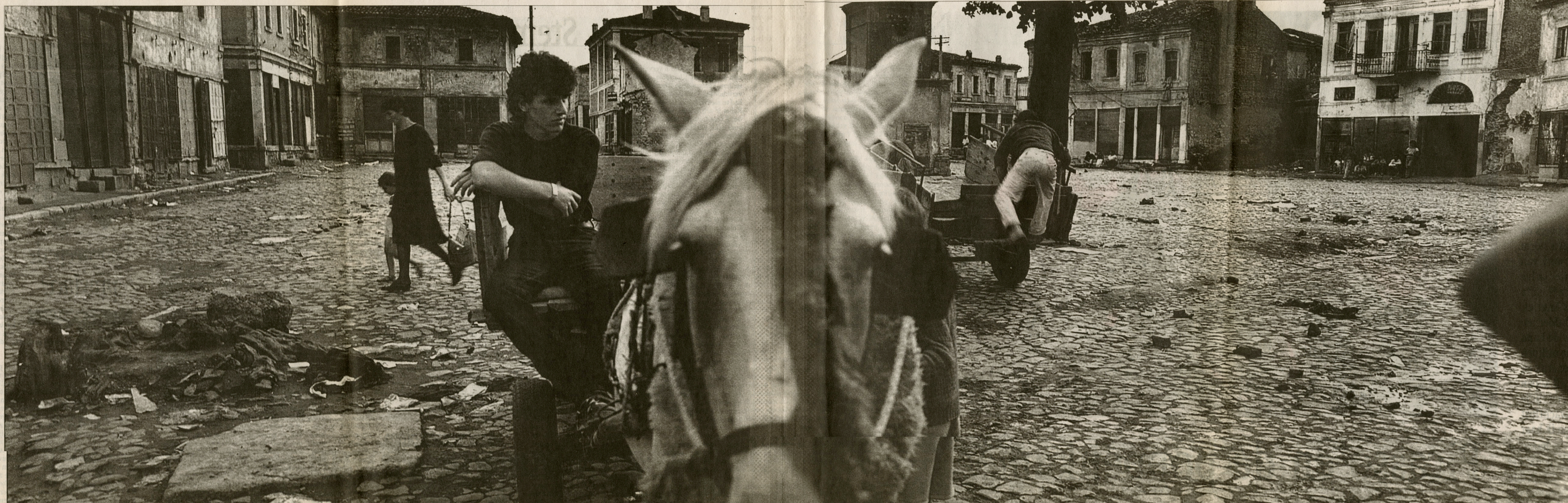
Korce, Albanië, 1995.