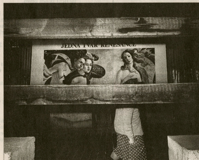
Praag, Tsjecho, 1994.