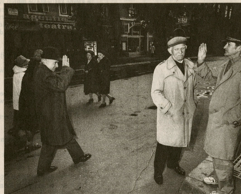
Sibiu, Roemenië, 1994.

De fototentoonstelling East of Eden loopt van 30 maart tot 18 mei in het Museum van Hedendaagse Kunst in Gent. Het boek van Carl De Keyzer zal worden uitgegeven bij Ludion in Gent.