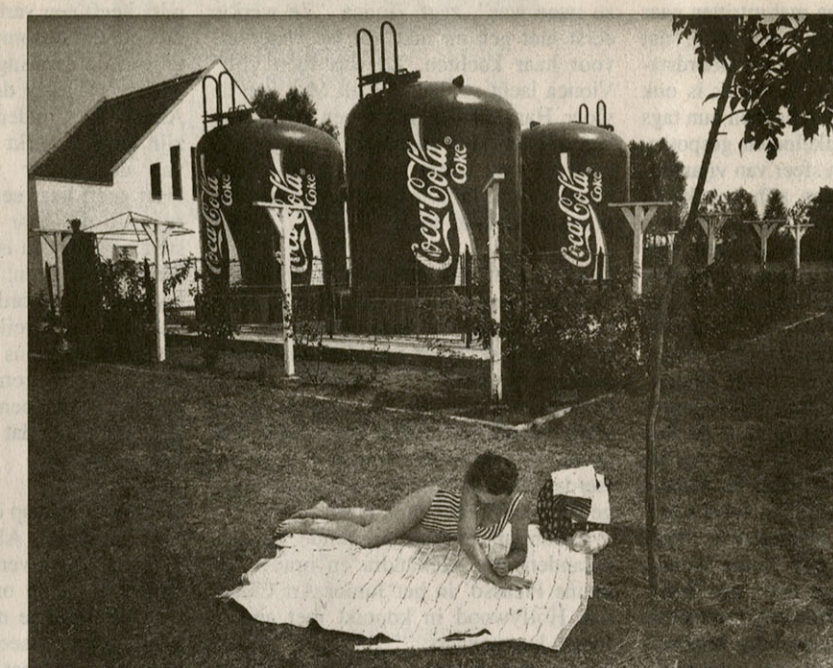
Kecskemet, Hongarije, 1994.