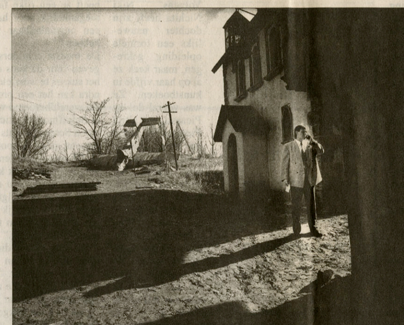
Babelsberg (Berlijn), 1995.