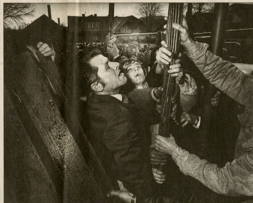
Libnica, Polen, 1994.