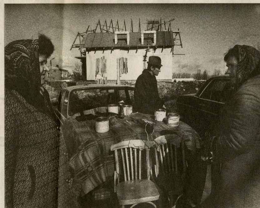
Kludz, Polen, 1994.