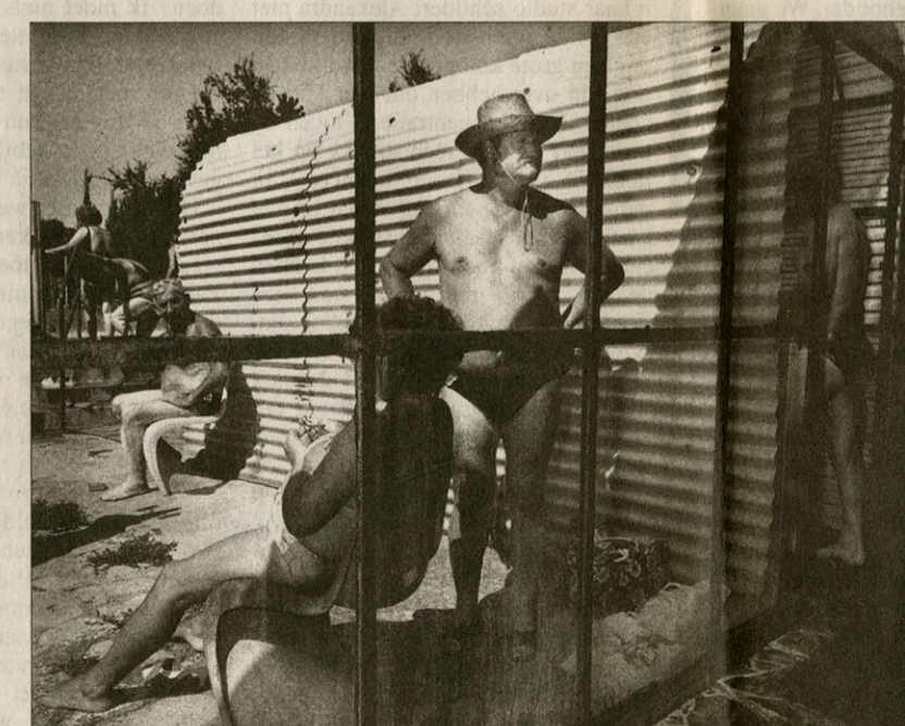
Mezokovesd, Hongarije, 1994.