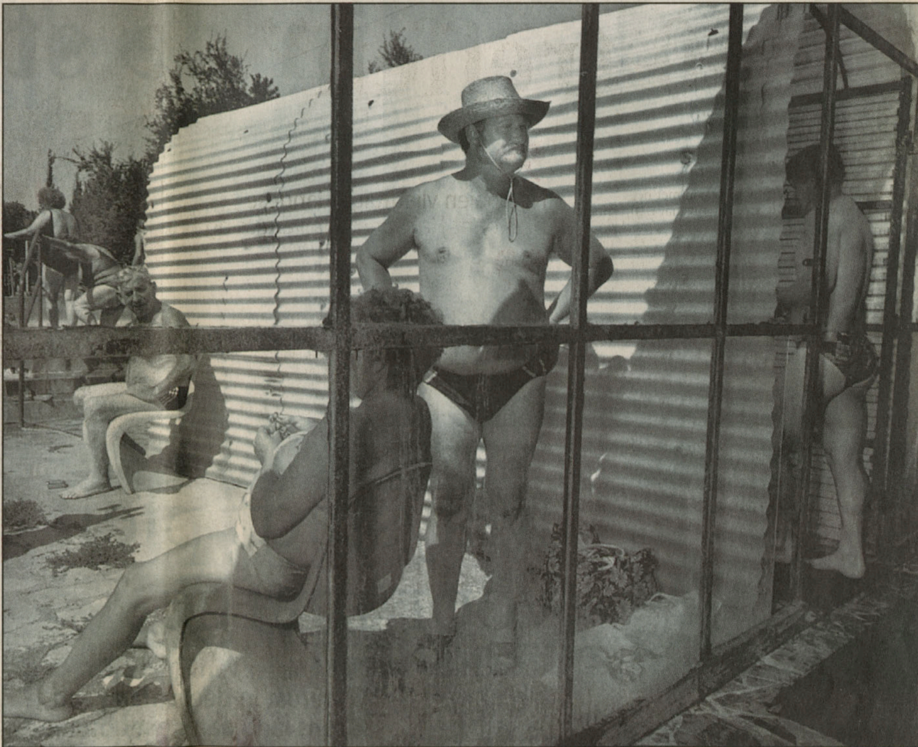
Een zonnige zomerdag in Mezökövesd (Hongarije).

De Amerikaanse president staat nergens op zijn foto's. Fidel Castro en de paus evenmin, al hangt hun aanwezigheid als een huivering over de beelden. „Dat is deels een bewuste keuze”, legt De Keyzer uit. „Je kunt kiezen voor de machthebbers. Dat doet de ongecontroleerde televisiebe-richtgeving. Ik kies voor de klei-nere momenten. Ik toon de figu-ranten en plaats ze op een sokkel. In plaats van Clinton en de paus. Daarmee stel ik de huidige aktu-aliteitsberichterijding in vraag. Deels gebeurt het ook onder druk van de omstandigheden. Vroeger stonden de fotografen bij alle grote evenementen op de eerste rij. Nu worden ze verdrongen door de cameraploegen van CNN”. Die foto's zijn in kleur. Dat