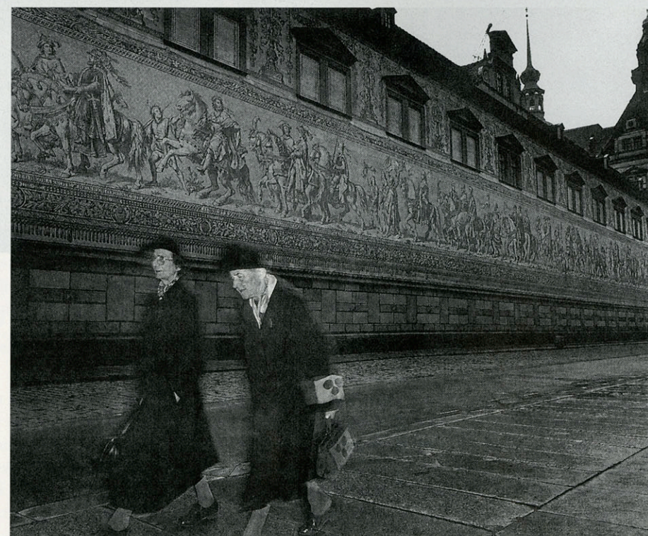
◀ DRESDEN, DUITSLAND.