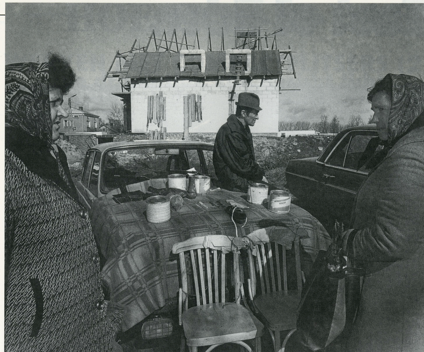
▲ KLODZ, POLEN.