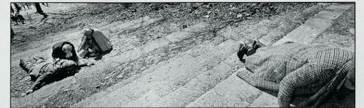
Kalwaria Zebrzydowska- Polen 1994