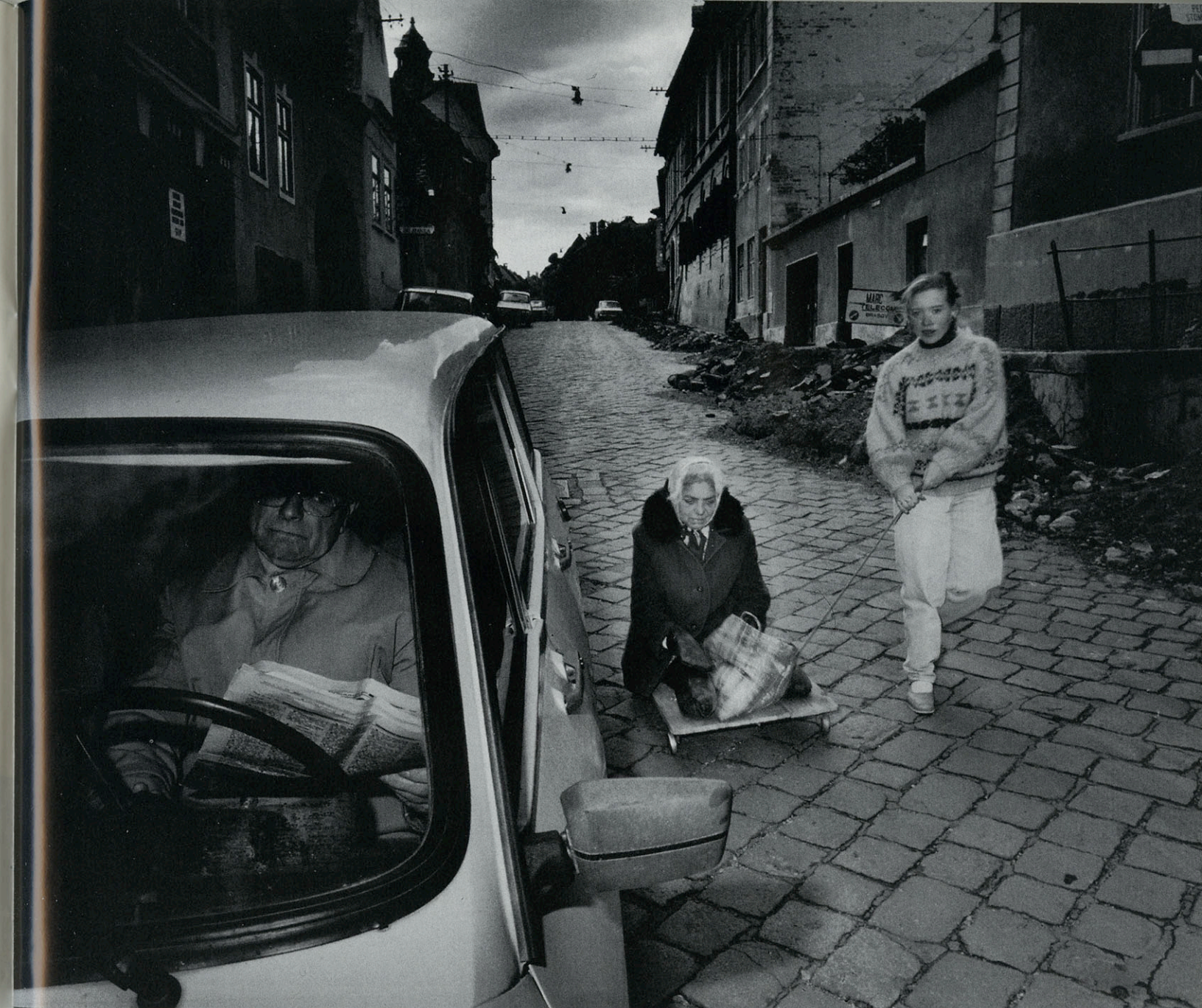
Sibiu- Roemenië 1994