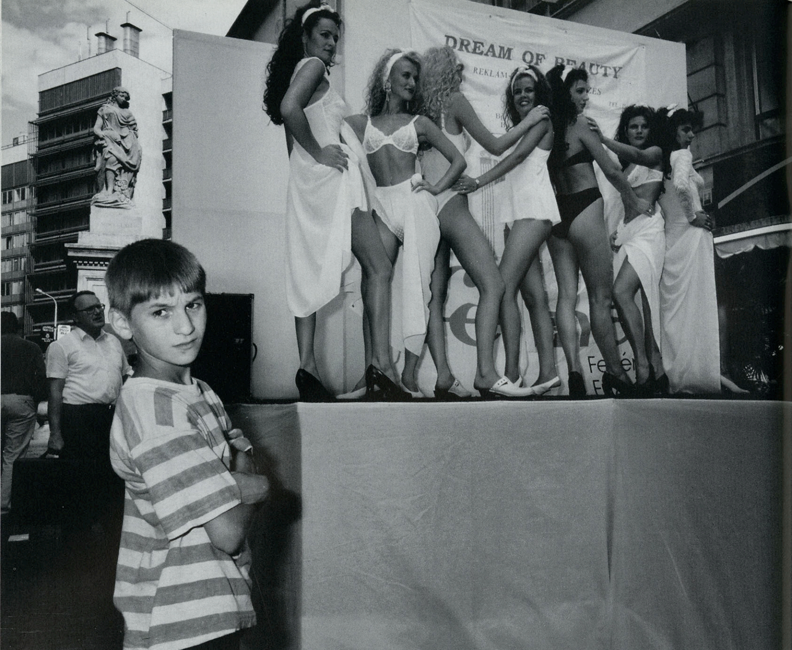
Boedapest- Hongarije 1994

aanwezigheid van de fotograaf strekte haar blijkbaar tot eer, want ze keek bijna doorlopend trots op naar de camera.