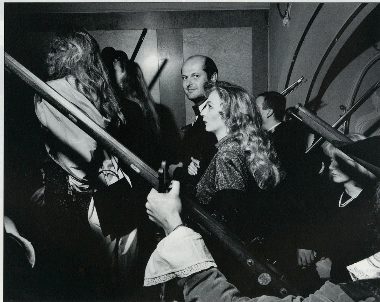
Bratislava- Slovakije 1994

Het is feest in de stad want na jaren gaat het casino terug open. Notalbelen en nouveaux- riches samen met een aantal buitenlandse genodigden wonen de plechtigheid bij. Elkeen krijgt een buidelje jetons om gratis het systeem te kunnen uitproberen. In groot ornaat en met dodelijke ernst beproeven ze hun nieuw geluk aan de speeltafels. Als de gratis aangeboden jetons op zijn hebben ze de gelegenheid er zelf te gaan kopen, uiteraard. Bratislava zet opnieuw een stap in de richting van het ooit verafschuwde kapitalisme.