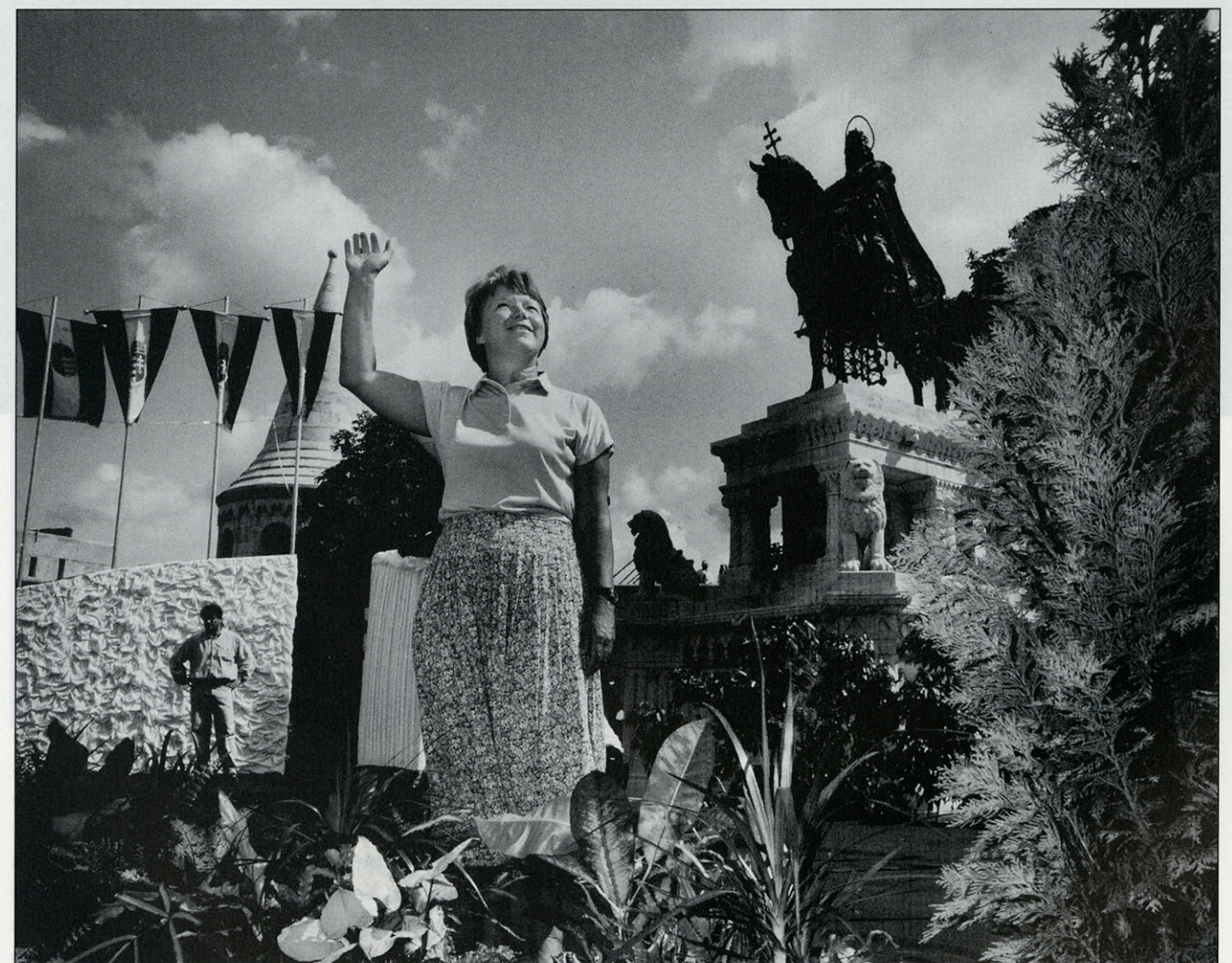
Boedapest- Hongarije 1994