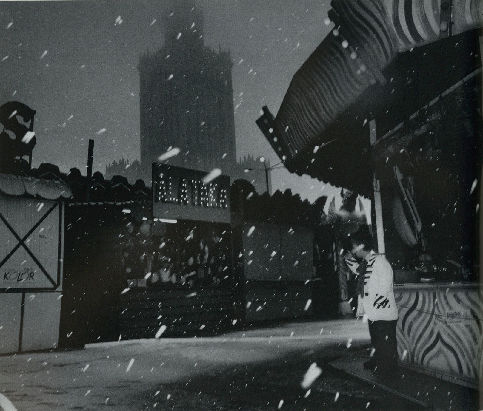
Warschau- Polen 1994