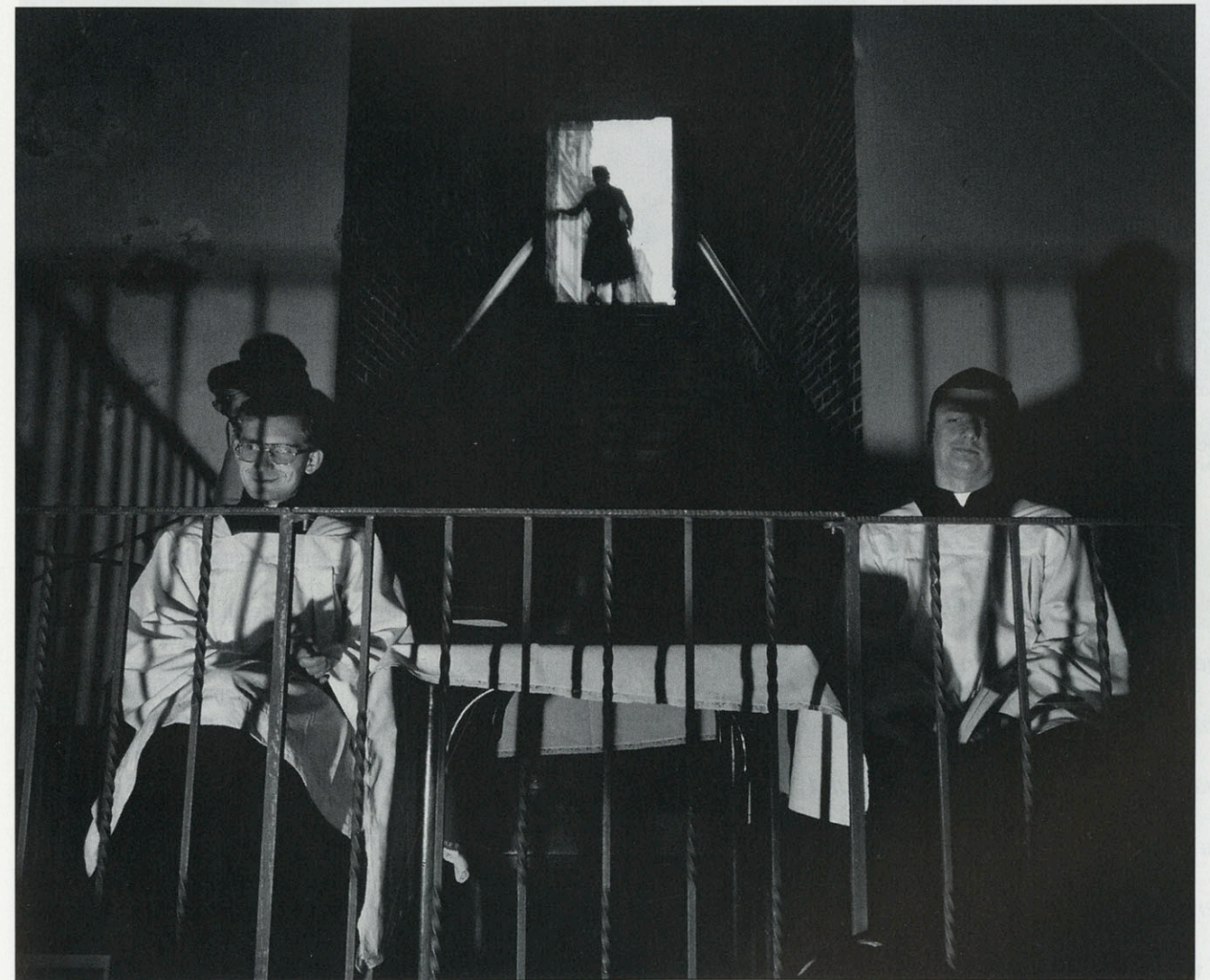
Krakau- Polen 1994

Op de foto bewaken twee priesters het lichaam van Christus in een donkere kapel onder een van de talrijke kerken, waar dagelijks tien en meer missen worden opgedragen. ◇