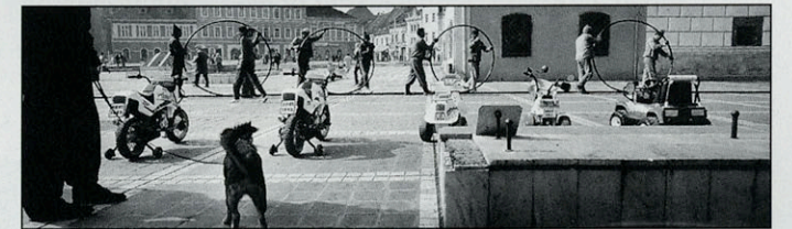
Brasov- Roemenië 1994

Ten tijde van de val van Ceaucescu werd ook in deze stad hevig strijd geleverd. Getuigen daarvan de grote metalen kruisen die ter herinnering in het stadspark werden opgericht. Daaronder en onder de jaren van verwaarlozing door het dictatoriaal bewind heeft