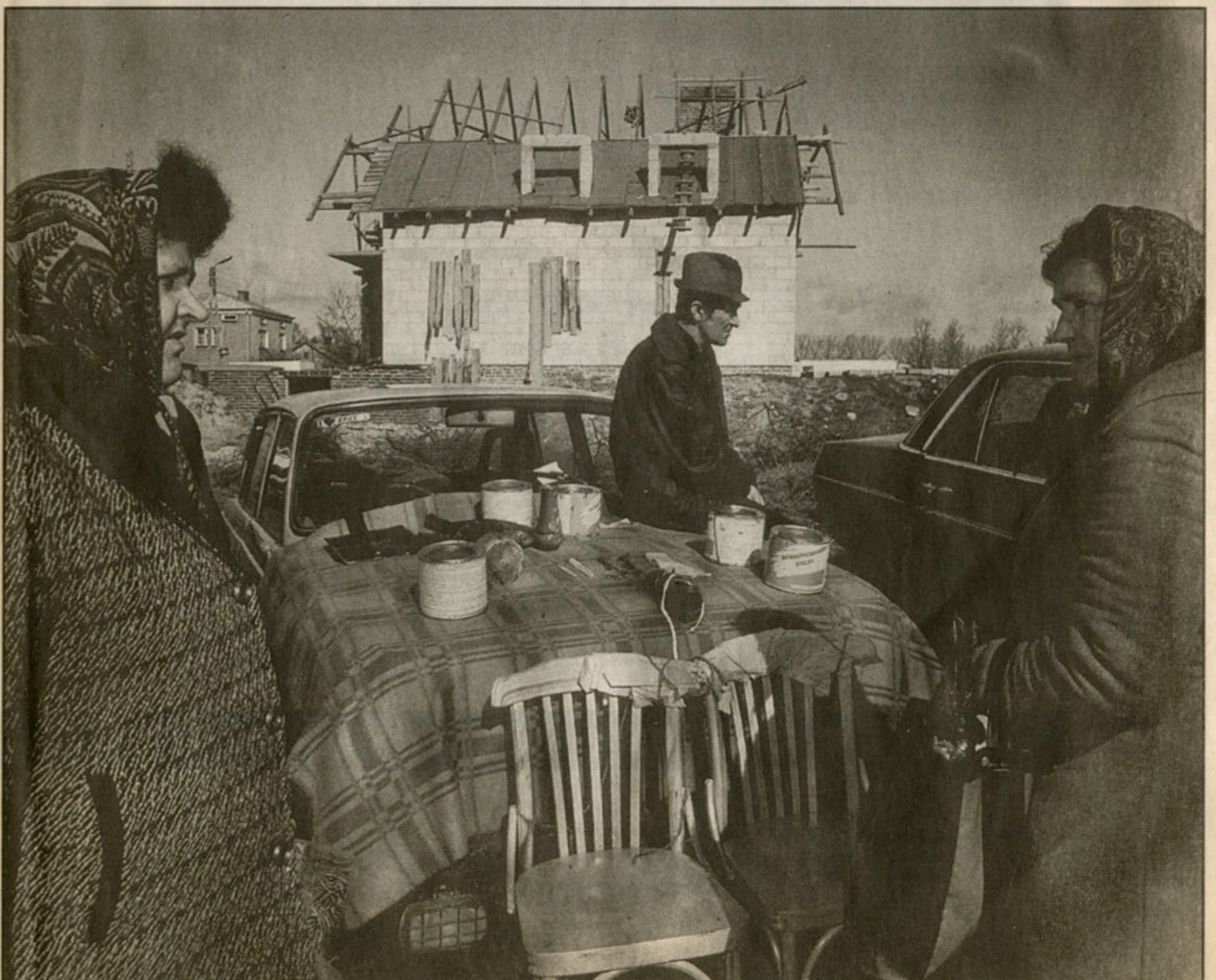
Dit is een lokaal marktje in Klodz, Polen. Vele mensen scharrelen vanalles bij elkaar en proberen eens per week iets te verkopen. Deze man heeft redelijk veel om te verkopen. Vaak hebben ze maar een paar schoenen of een lijst of zoiets. Die twee vrouwen waren op kooptocht.