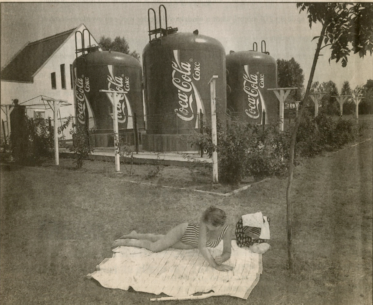
Coca Cola in Kecskemet, Hongarije.