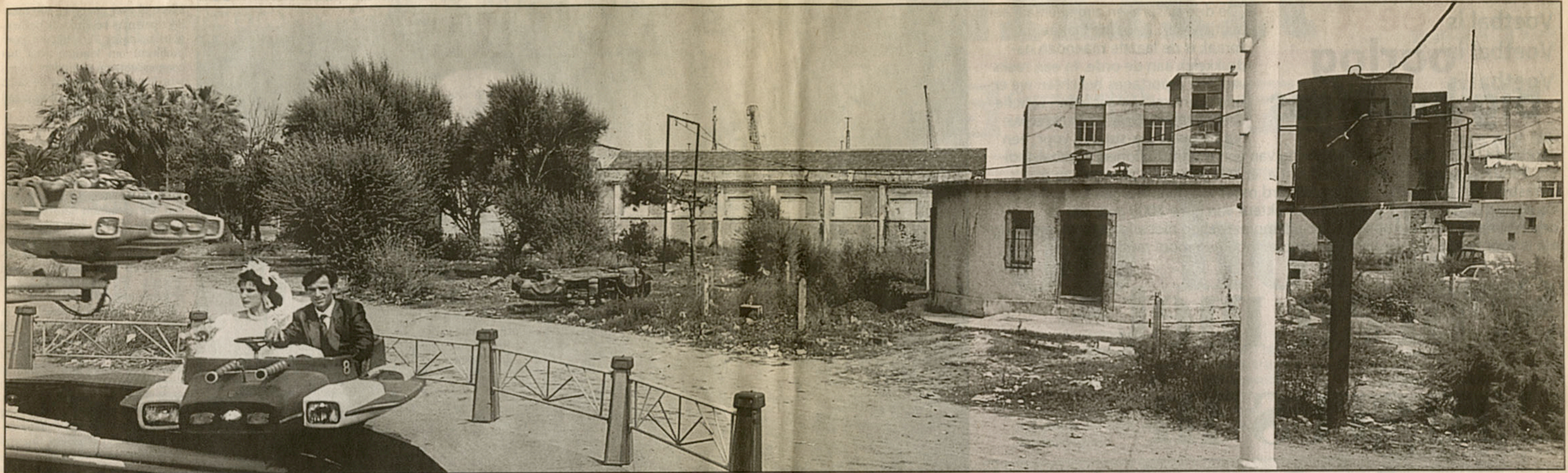
Een panoramische foto van een kermisattractie in Dürres, een stadje aan de Adriatische zee in Albanië. Heel raar zulke attractie te zien in een stad vol bunkers. Want Enver Hoxha liet in Albanië tien miljoen bunkers bouwen en in de steden honderden ijzere foto. Albanië was volkomen geïsoleerd. Die carousel vormt een klein eilandje van geluk.