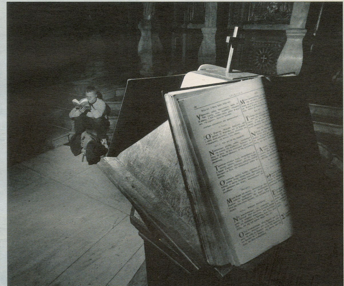
Jonge toerist raadpleegt zijn Lonely Planet -gids over Israël in het Grieks-orthodoxe deel van de kerk van het Heilig Graf.