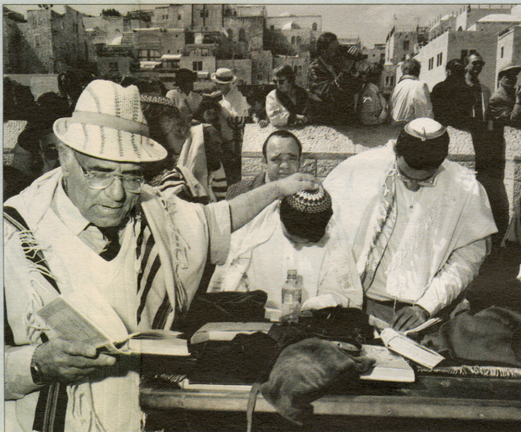
De buurt van de Klaagmuur is altijd opvallend rustig op vrijdag. Die muur is namelijk een zijwand van de moskee, en op vrijdag worden altijd relletjes verwacht. Tientallen jeeps en soms honderden jonge rekruten worden ingezet om een eventuele spontane demonstratie van Palestijnen vroegtijdig de kop in te drukken. Wie men er wel blijft zien, is de harde kern van Jeruzalem: de orthodoxen willen gerust de woede of een occasionele steen van ongelovigen trotseren. Hun doel is het opnieuw in gebruik nemen van de tempel in al zijn glorie, en daarvoor mogen wel een paar martelaars vallen.