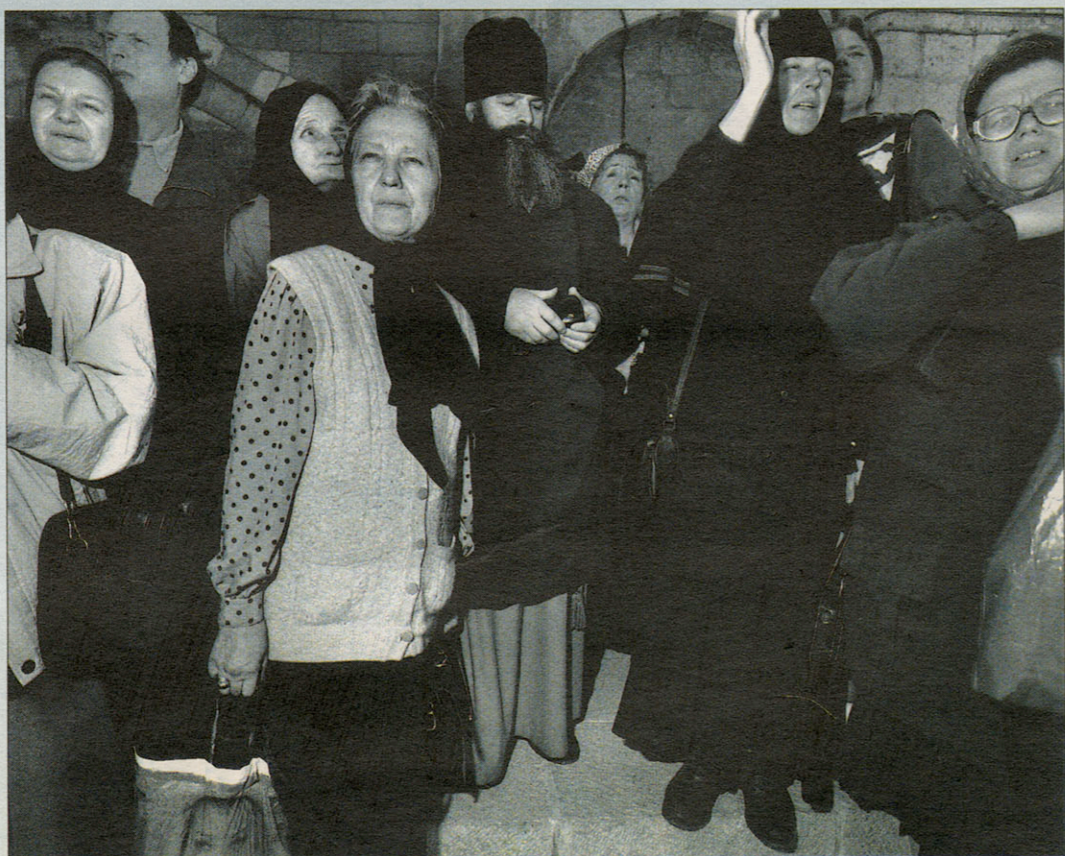
Een groep Polen met de obligate plastic zakken komt aan bij het Heilig Graf. De verwondering op hun gezichten is te vergelijken met de ontroering van bedevaartgangers die, na dagen stappen, uiteindelijk bij de kathedraal van Santiago de Compostela aankomen. Dat de groep met een goedkope vlucht uit Warschau is gekomen, maakt de ontroering er niet minder om.