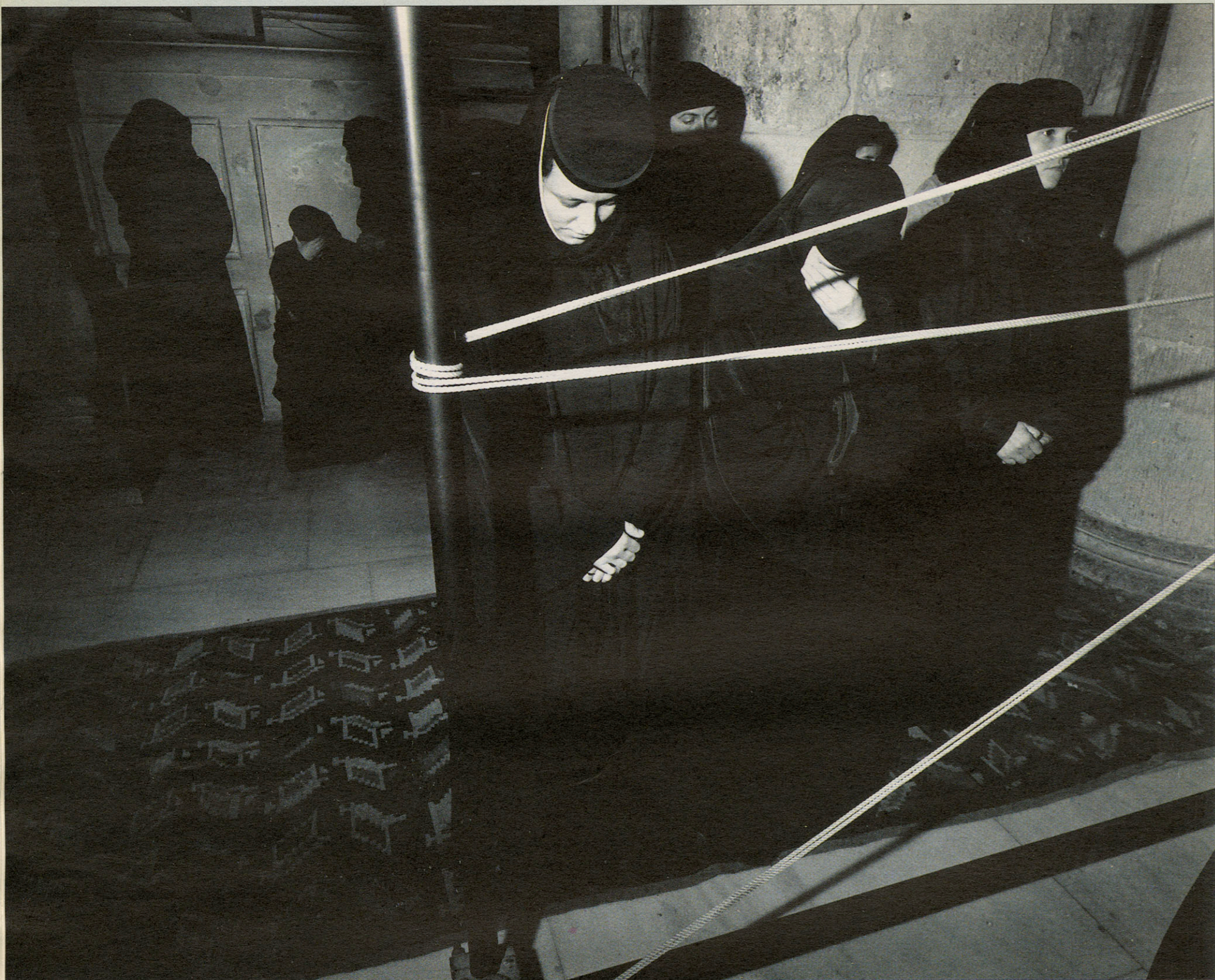
Nonnen in het Grieks-orthodoxe deel van de kerk van het Heilig Graf. De Grieken zijn baas in de heiligste kerk ter wereld. Dat is historisch zo gegroeid. De macht wordt gedeeld met de rooms-katholieken en de Armeniërs. De Ethiopische kopten zijn de armsten en hebben alleen een piepklein altaartje naast de kerk. De Grieken bezitten ook de sleutel: 's morgens moeten de andere gemeenschappen wachten tot zij de poort openmaken. Op religieuze hoogdagen worden er ook afspraken gemaakt over wie waar welke handel — kaarsen, missen, prenten — mag drijven.