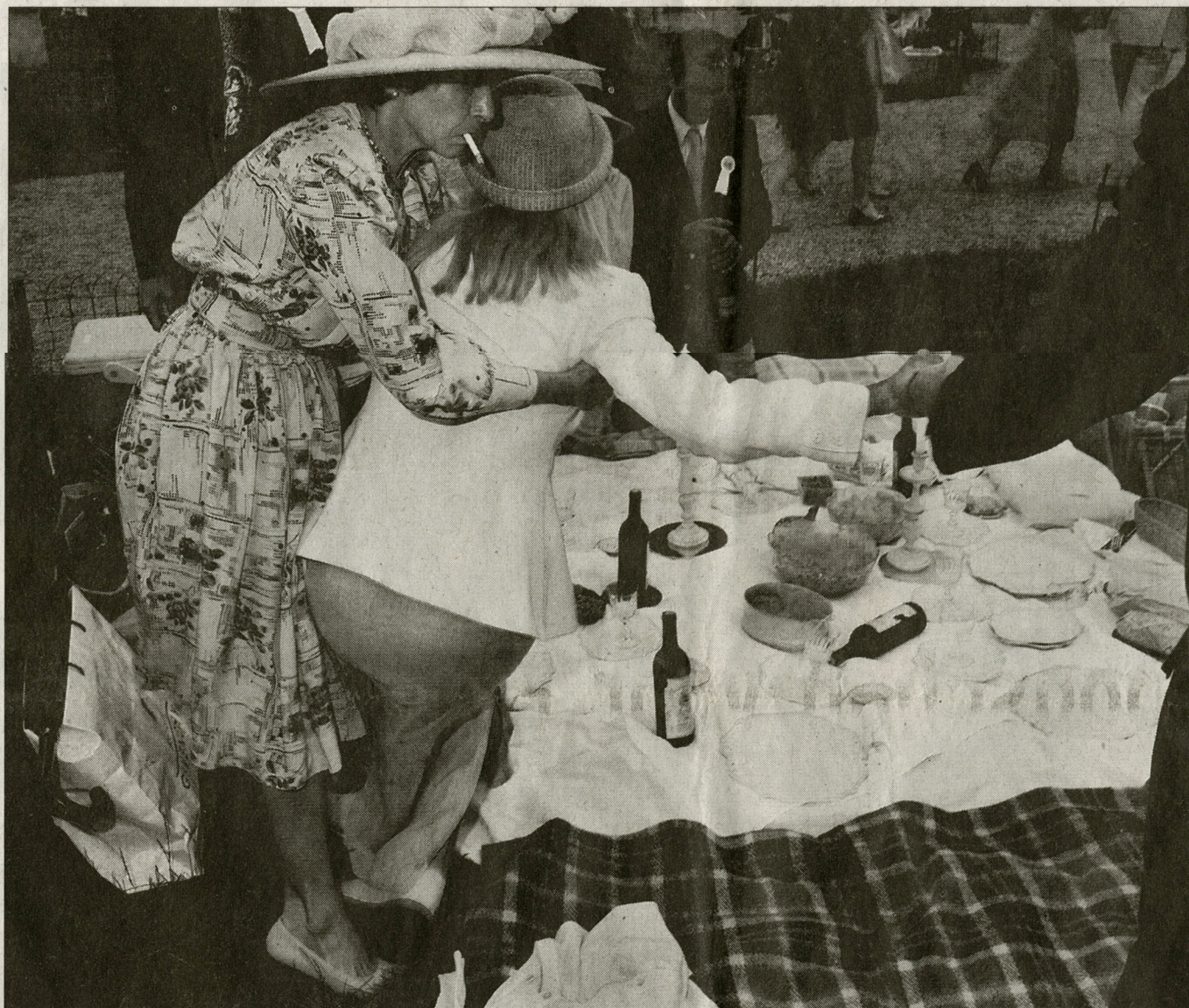
Een verwarrende verzameling van beelden die iets vertellen over de geschiedenis en hoe we ermee omgaan, over de betekenis van rituelen en vooral over de achterkant van het decor.

Het boek werd uitgegeven door Ludion en kost 1.300 frank.