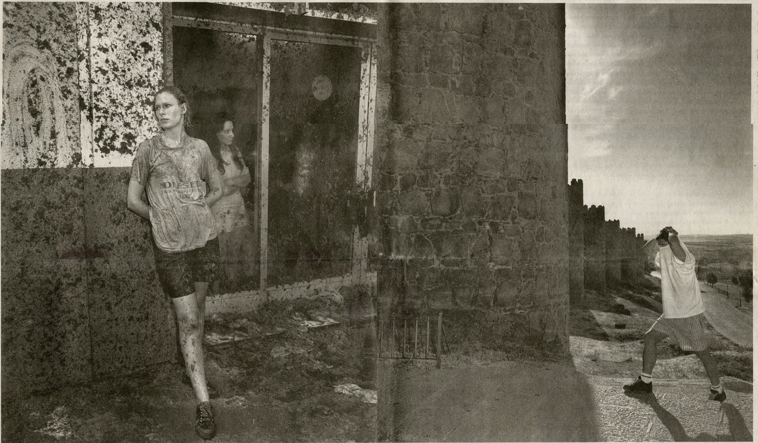
BUNOL (SPANJE) - AVILA (SPANJE)

Magnum-fotograaf Carl De Keyzer trad gedurende acht maanden in de voetsporen van zijn stads- en naamgenoot keizer Karel en zocht dwars door Europa de plekken op waar zijn illustere voorganger vijfhonderd jaar geleden ook halt hield. Niet op zoek