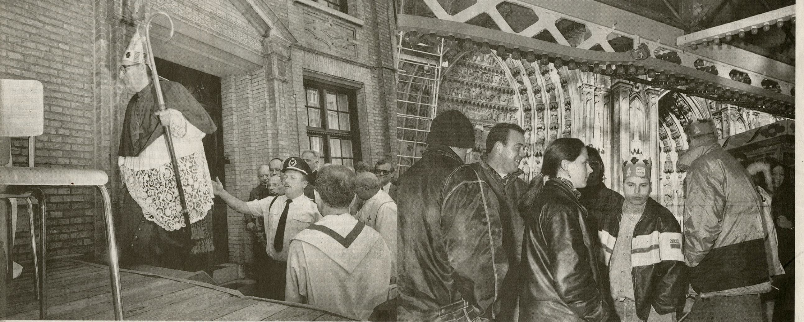
MARNE LA VALLÉE (FRANKRIJK) - TORDESILLAS (SPANJE) - VEURNE (BELGIË) - KEULEN (DUITSLAND)