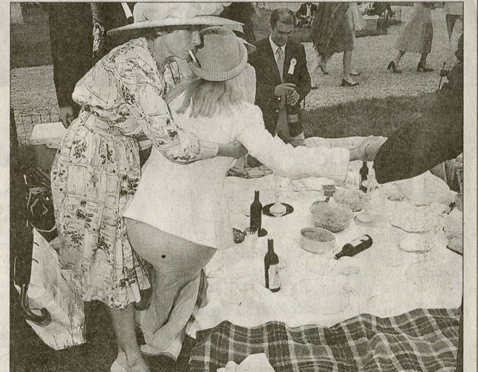
EVROPA 4: Chantilly, 1999.

«Le prix de Diane, de grote jaarlijkse picknick voor de Parijse adel. Wellicht liepen er Habsburgers rond. Chantilly is voor de Franse adel wat Ascot is voor de Britse adel. Maar hier is het feest gedaan en die dame viel om van zattigheid.»