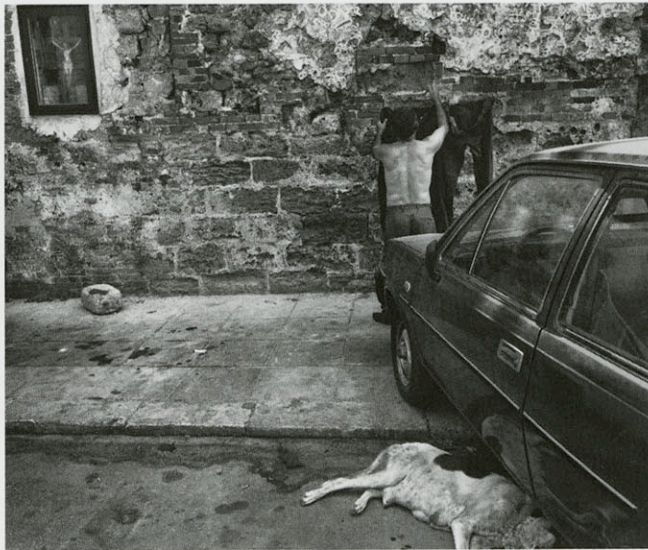
Palermo, Italië, 1999