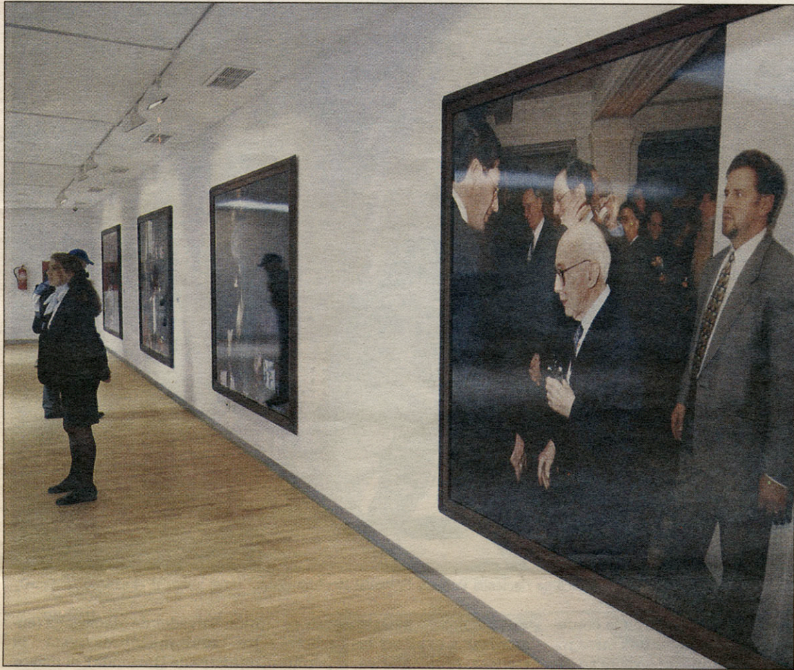
La exposición muestra fotografías de gran formato, captadas entre 1991 y 2001.

Con el gran formato, De Keyzer pretende que sus fotografías sean reconocidas como cuadros, que el público se detenga a contemplarlas como una pintura en un gran museo, que sus obras existan de manera independiente. De las once obras expuestas en el Centro de Arte, el fotógrafo belga siente predilección por "Procesión del Viernes Santo patrocinada por Coca-Cola en San Antonio, Texas",