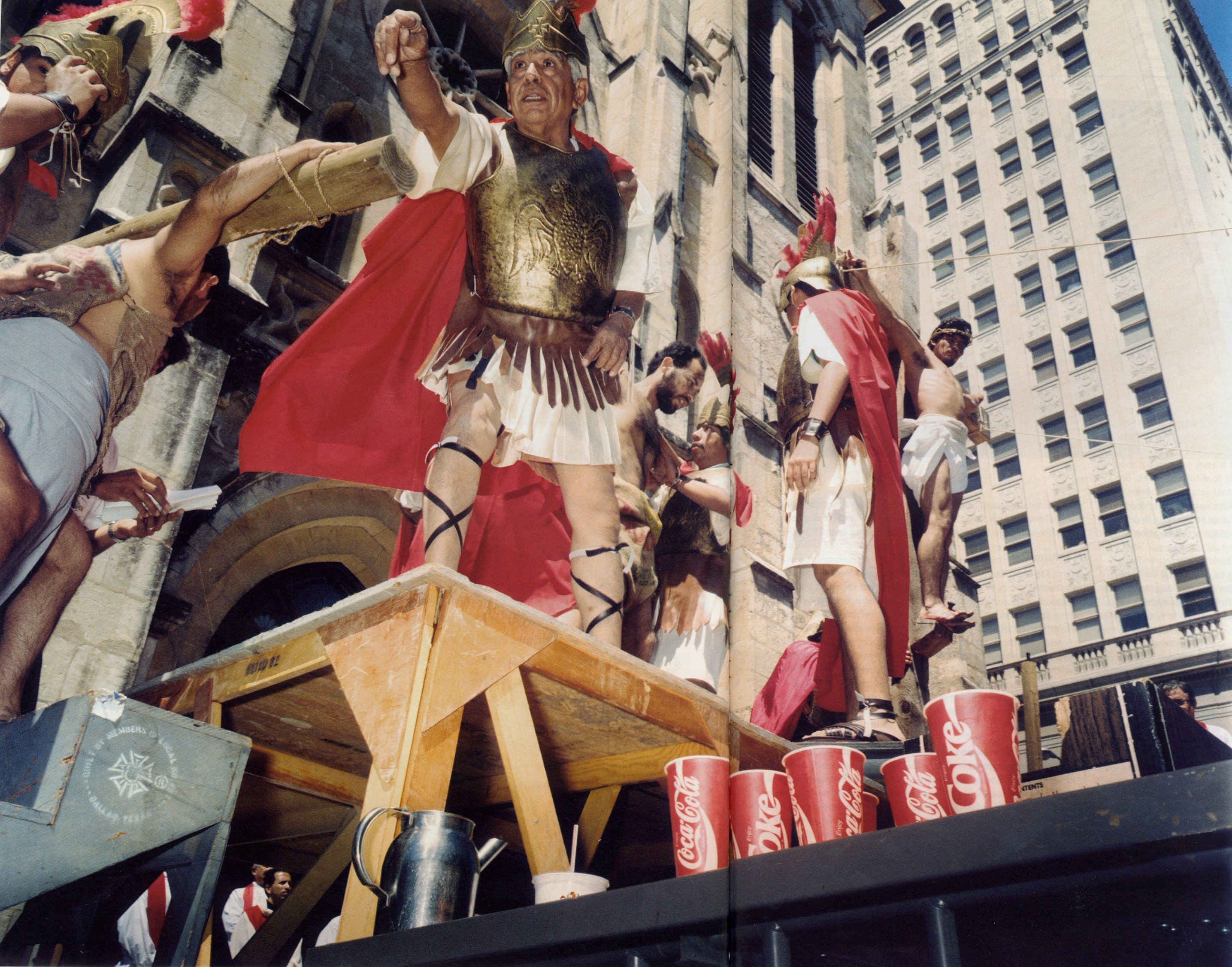
Goede Vrijdag processie bij de Onze Lieve Vrouw van Guadeloupe kerk. San Antonio, VS, 1990-1991. Uit de serie 'Tableaux Vivants'.