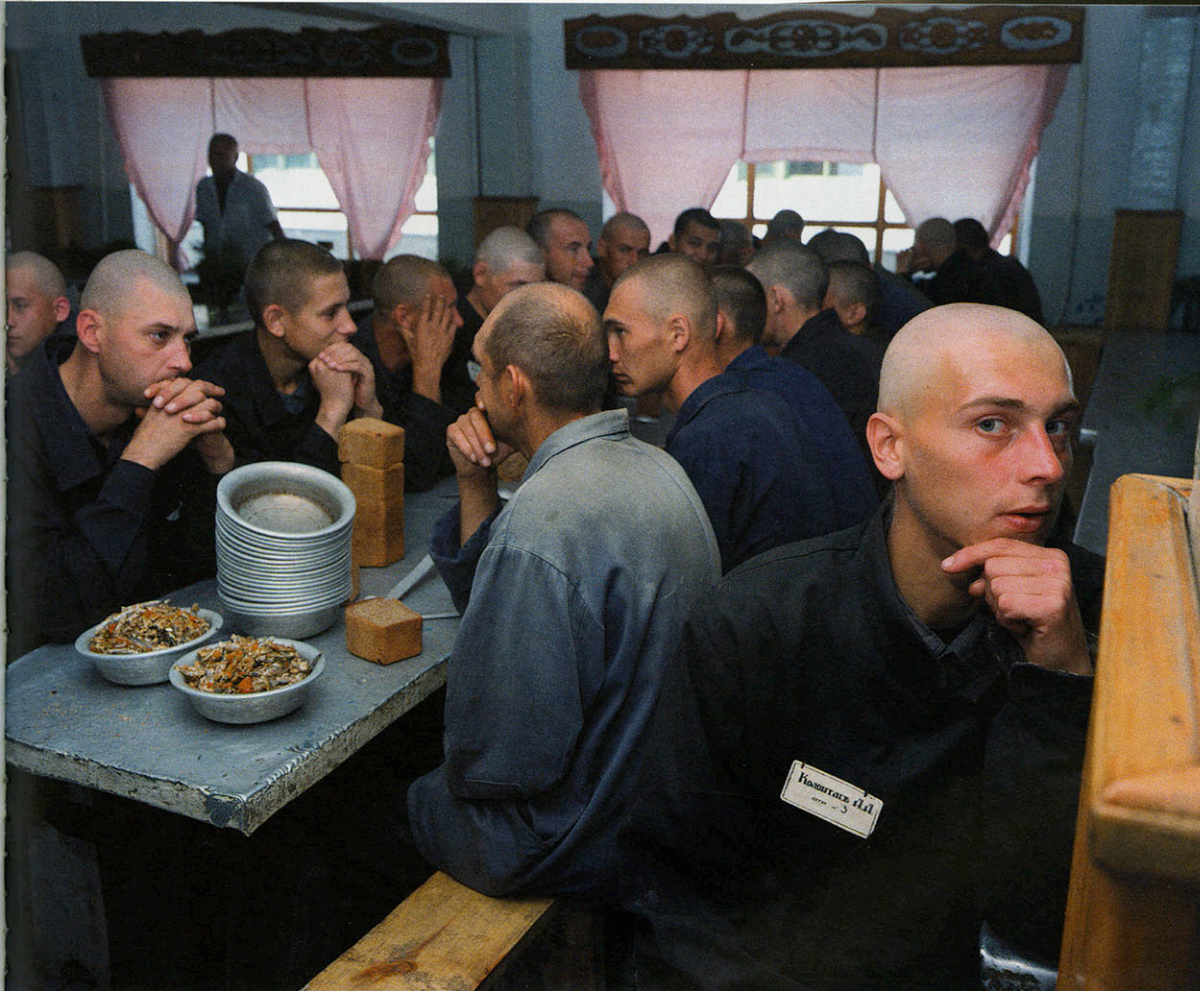
Lunch in Kamp 27. Omgeving van Krasnojarsk, Siberië. Uit het project 'Zona'.