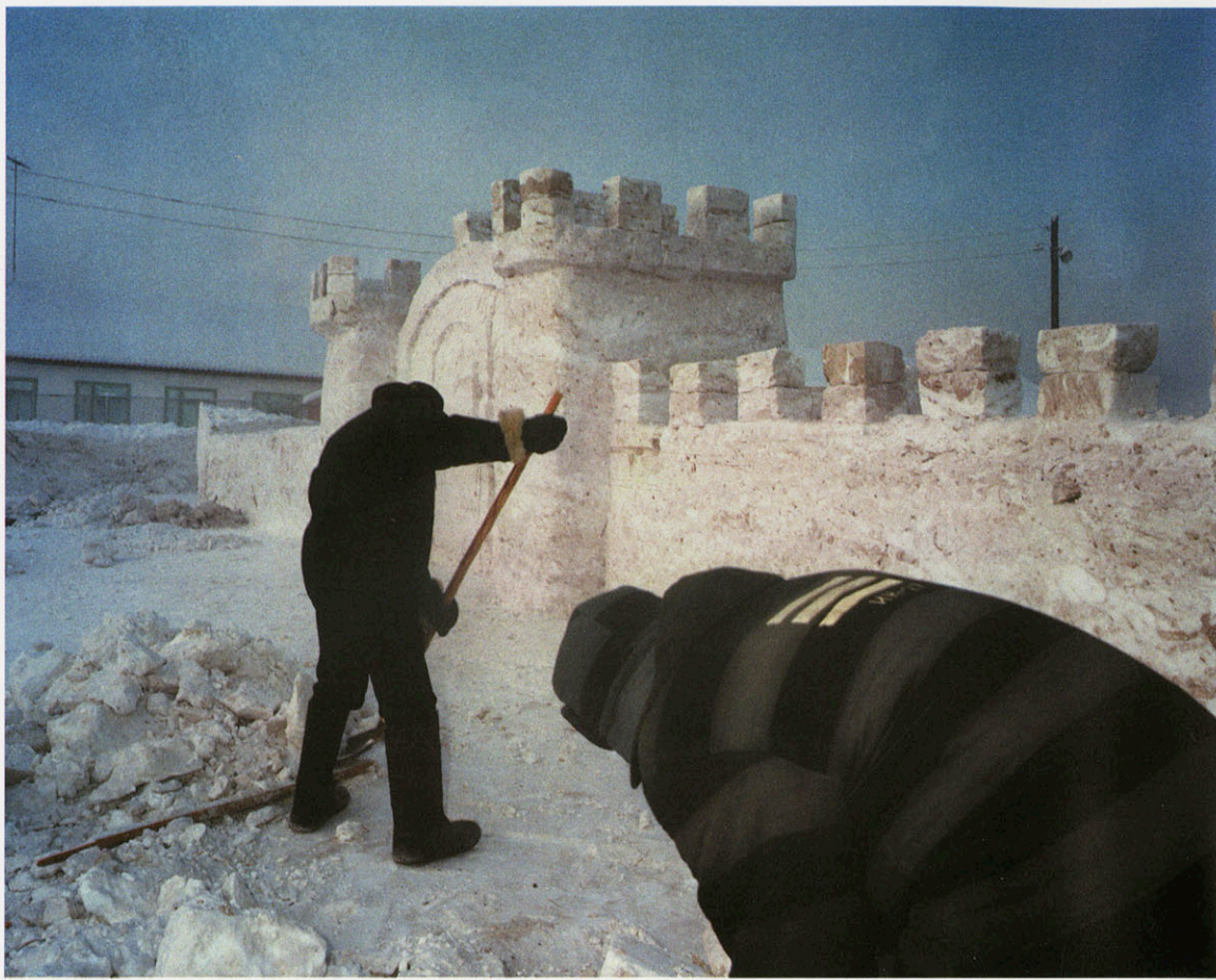
I.K. 22. Tchournojar. Ice competition.

CARL DE KEYZER, fotógrafo belga (1958) miembro de la Agencia Magnum, trabaja fundamentalmente en proyectos a gran escala compuestos por varias imágenes y textos, extraídos a menudo de sus propios diarios de viaje.