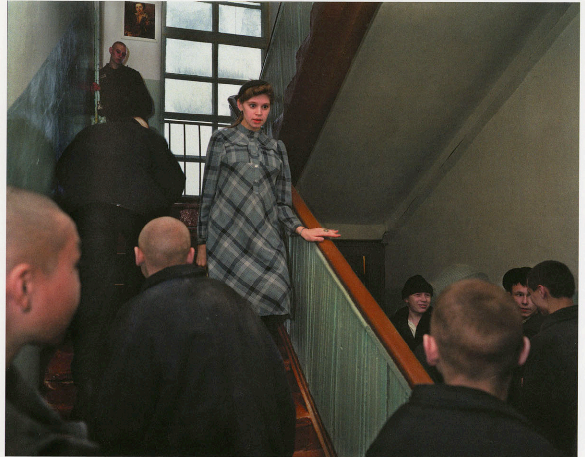
Kansk. Youth camp. Young school teacher going to class.

Nowadays it seems that few Russian prisoners are victims of political persecution and that all of them have been justly convicted. It also seems that the correctional regime is less severe and growing milder as the post-communist system liberalizes. However, such agencies as the Moscow Humanitarian-Social Academy claim that current conditions are as horrendous