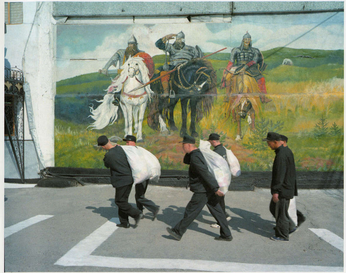
I.K. 27. Krasnoyarsk. Prisoners carrying the mail.

Hoy en día podría parecer que hay pocos presos políticos y que todos los penados han sido condenados justamente. También parecería que el sistema penal es menos severo a medida que el régimen post-comunista se liberaliza. Sin embargo, algunas agencias como la Academia Moscovita Social Humanitaria denuncia que las condiciones actuales son tan horribles