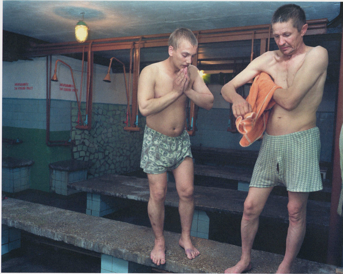
I.K. 17. Krasnoyarsk. Prisoner's boss after sauna.

CARL DE KEYZER, Belgian photographer born in 1958, is a member of Magnum. He mainly works on large-scale projects and general subjects, made of various images and texts, often taken from his own travel diaries.