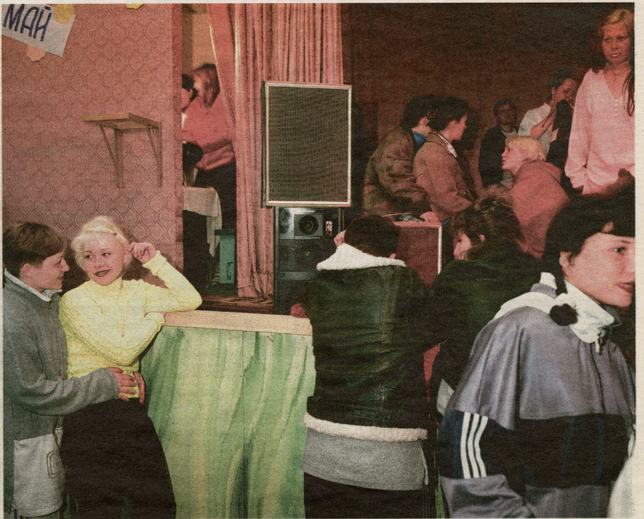
„Camp 22, Krasnoyarsk, Siberië, Rusland”: wat onderscheidt dit beeld van een amateurfoto?