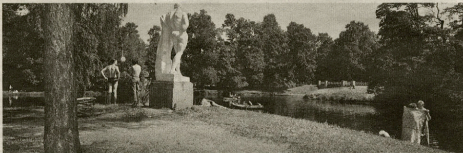
„Grieks beeld, Leningrad, 1989.”

Of neem nu die foto van de Goede-Vrijdagprocessie in Texas, die hangt in de voorste kamer van Het Zwart Huis. Hij toont een schijnbaar machtige man in groot ornaat met een muts in felle diagonale strepen. Het is geen toeval dat die man