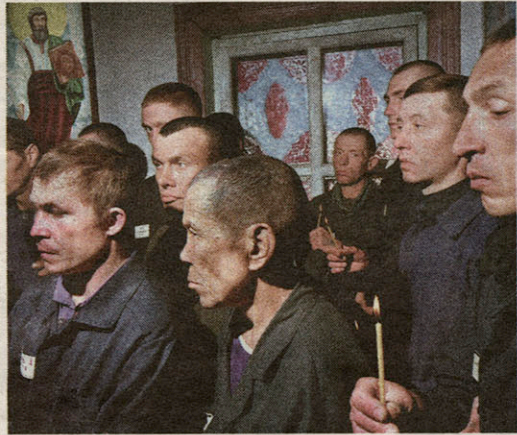
„Eerste dienst in orthodoxe kerk, Kamp 15, Siberië, Rusland.”