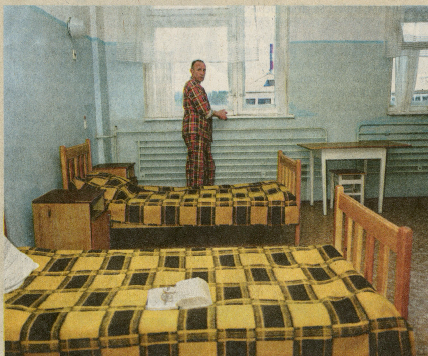
■ Kamp 37, Sosnovobosk, Rusland. Siberisch gevangenenkamp, voormalige goelag. Zona.