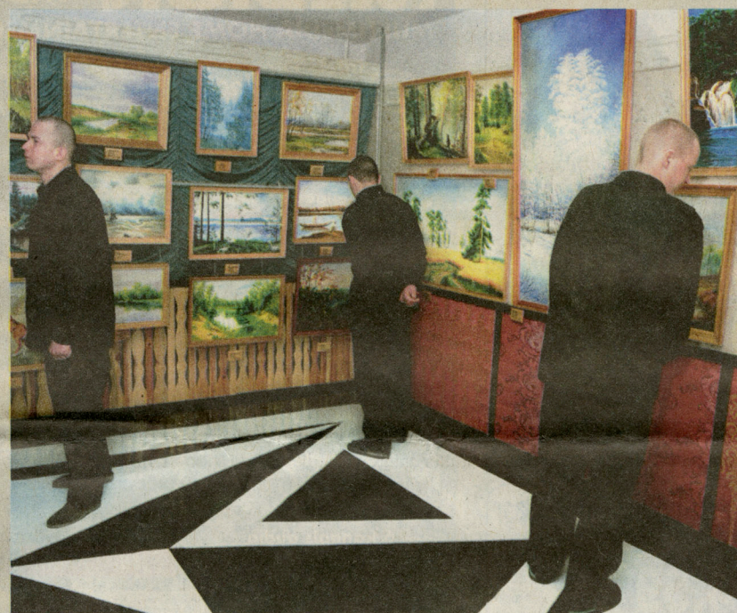
■ Siberisch gevangenenkamp, Krasnojarsk, Rusland. Tentoonstelling in voormalige goelag. Zona.