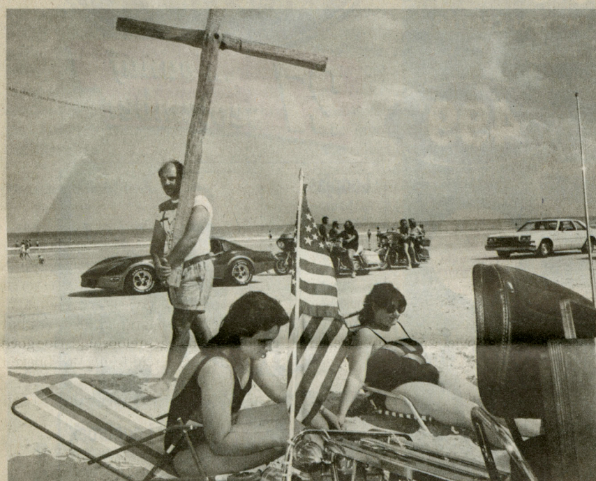
■ Daytona Beach, VS. Bike Week. God, Inc. Religion and nationalism in the USA, 1990-1991.