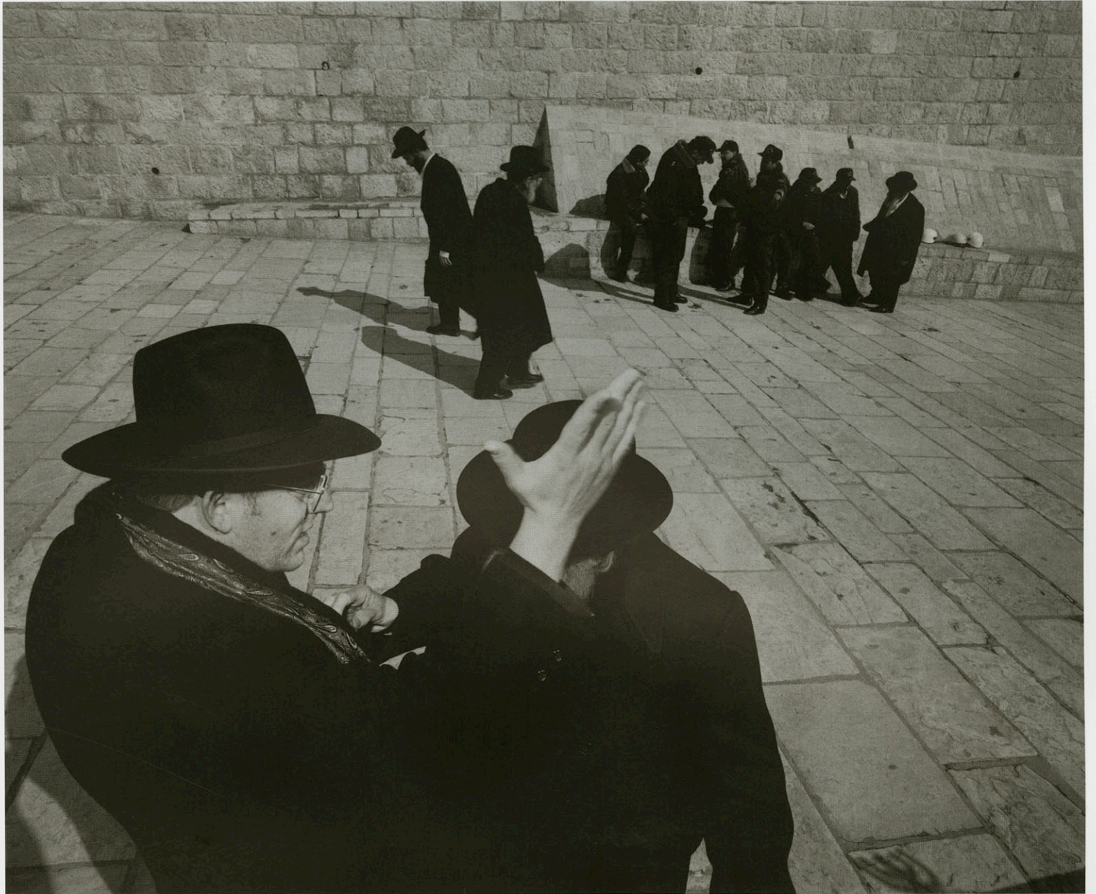
Israël 1992