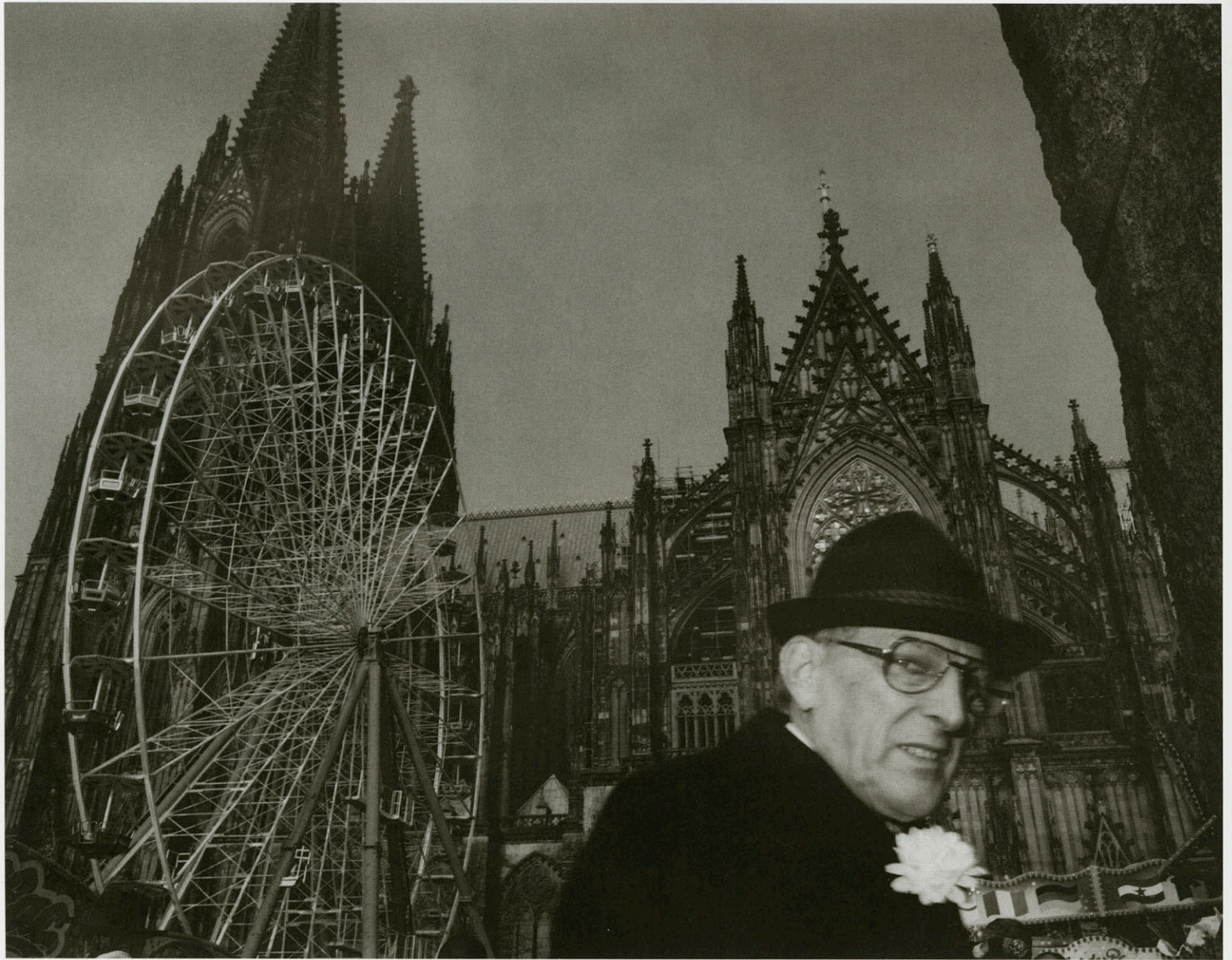
Germany, Cologne. Carnival. Book: "Evropa" 1998 - 1999