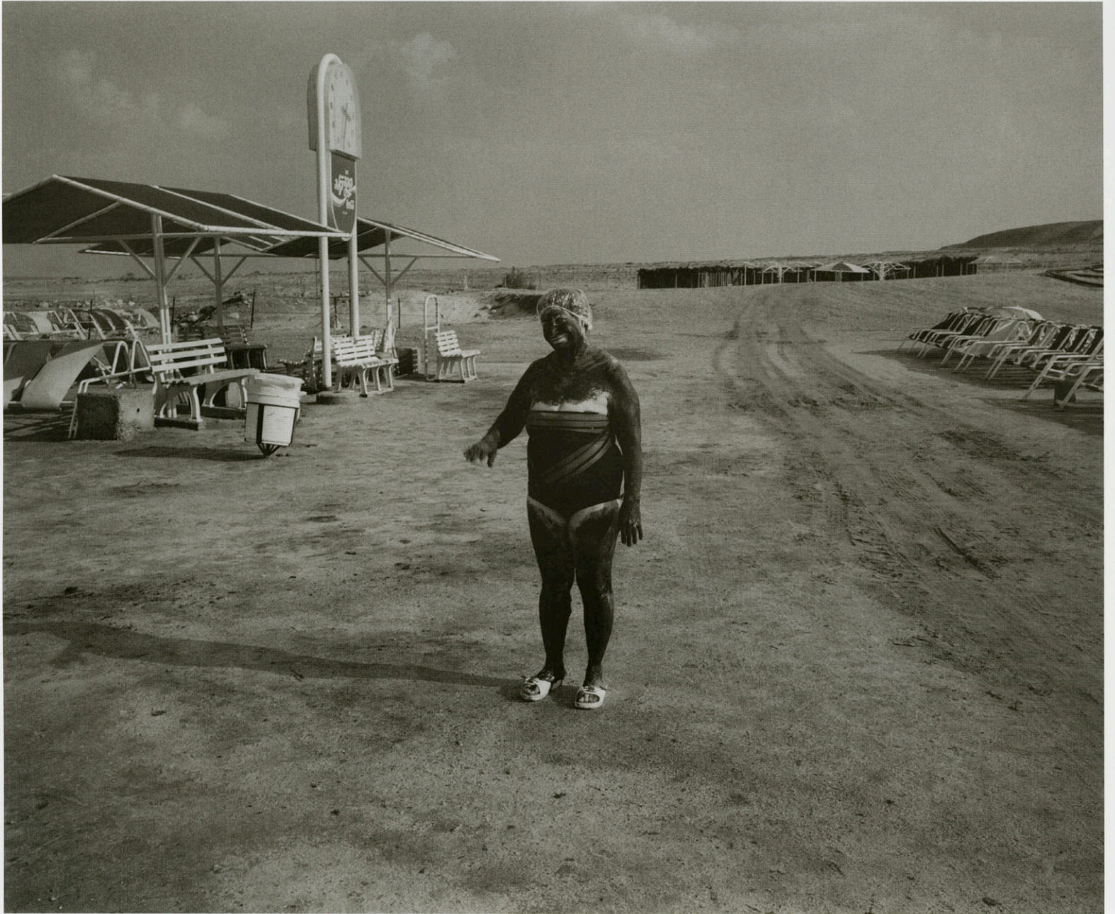
Israël 1992