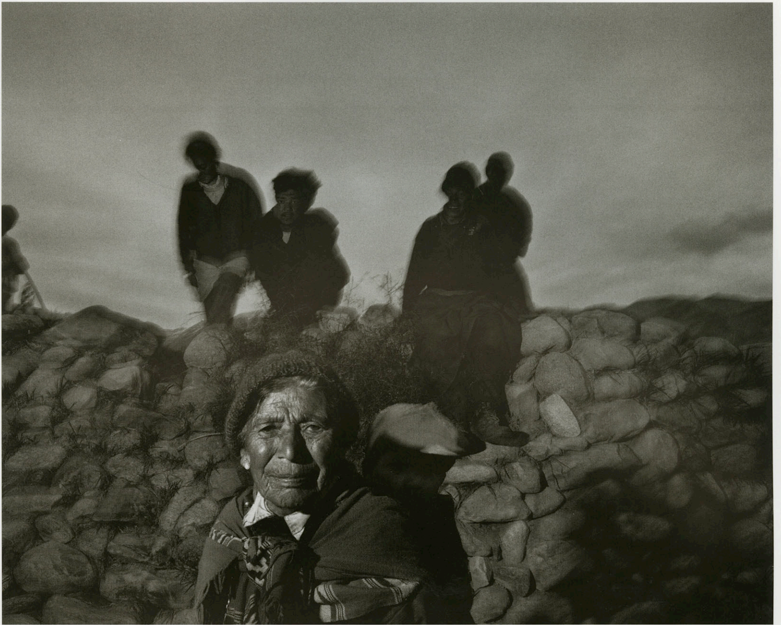
Leh, Ladakh - India 7 Oracles.