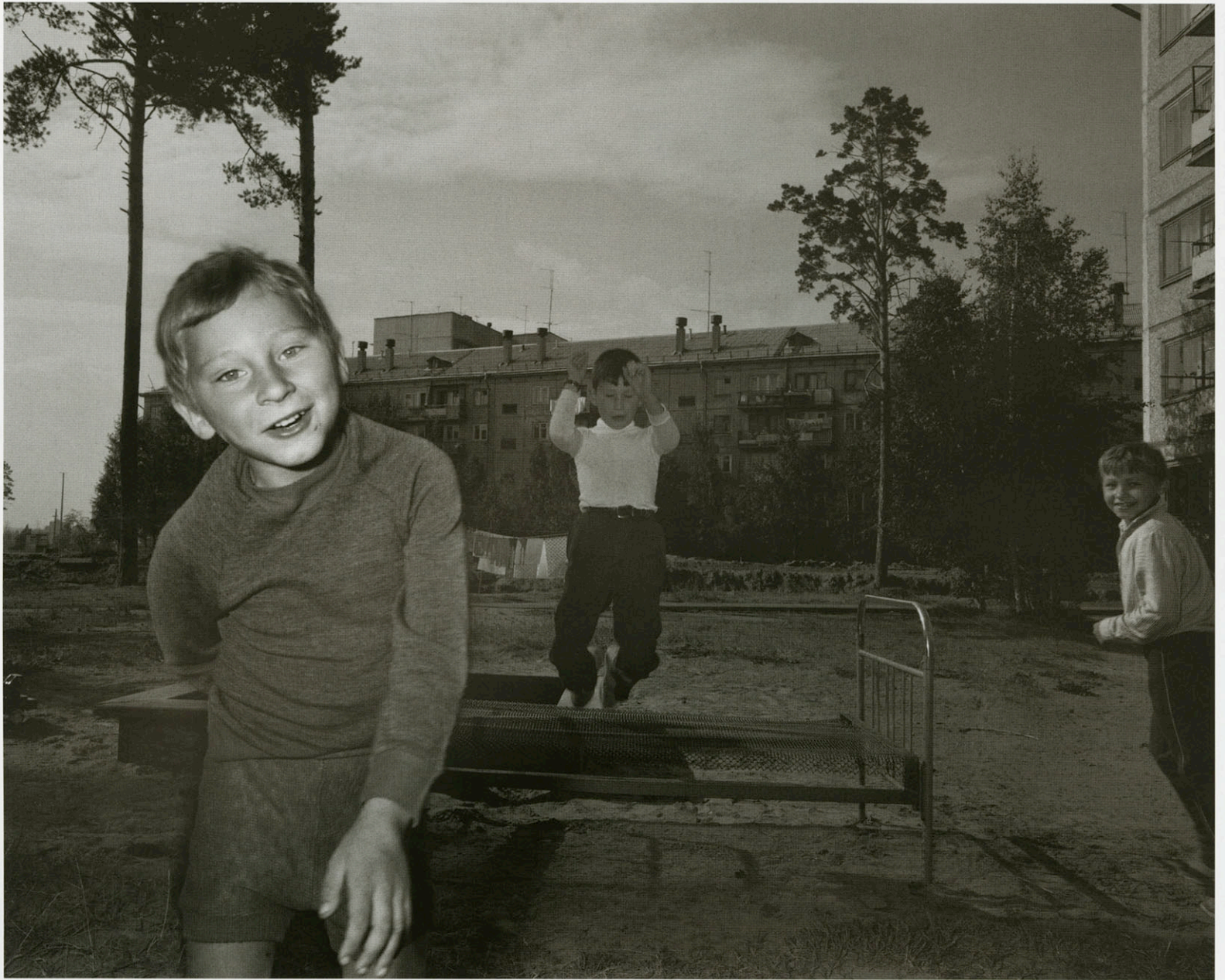
Russia. Bratsk. Days of Glasnost and Perestroika. Book "Homo Sovieticus, USSR-1989-CCCP" 1989