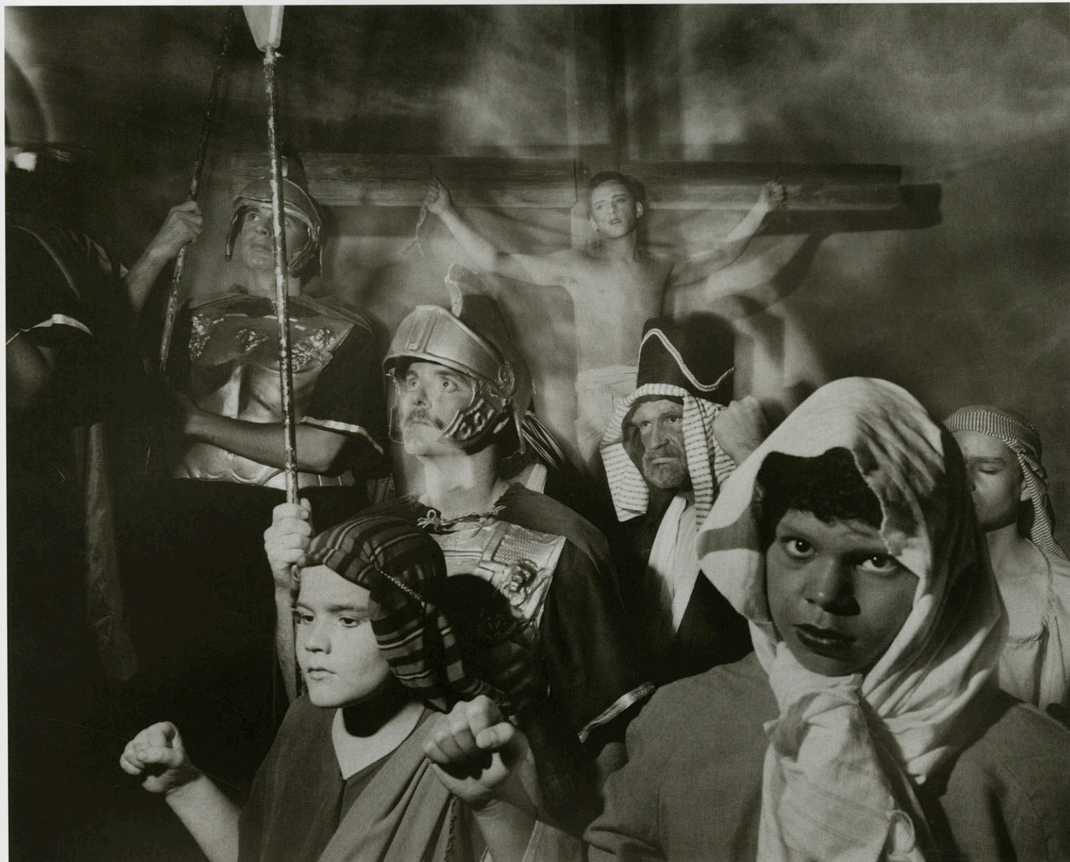
USA. San Antonio. Our Lady of Guadalupe church. Good Friday Procession. Book "God, Inc." 1992