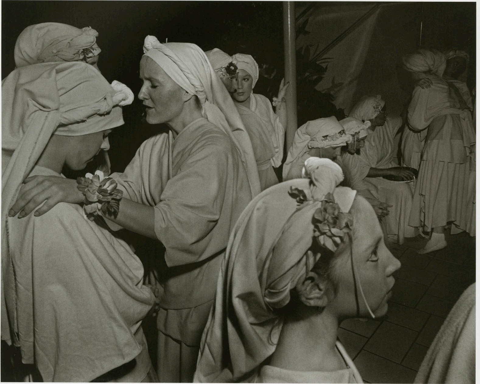
USA, Dallas. Trinity Church - Assembly of God. Easter passion Play. Book "God, Inc." 1992