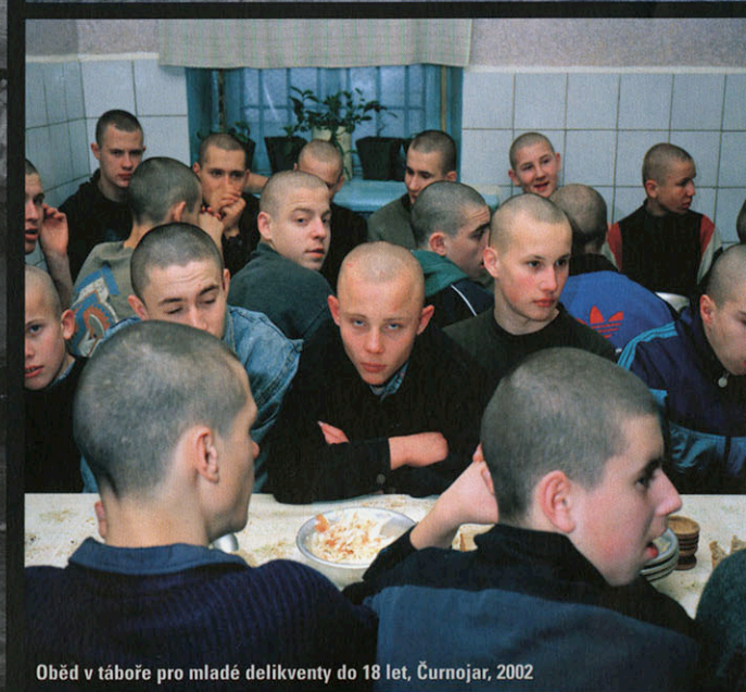
Oběd v táboře pro mladé delikventy do 18 let, Čurnojar, 2002

gurace různých motivů, které vytvářejí mnohoznačné vizuální symboly. Kniha o Indii, která vznikla během ročního pobytu v této zemi plné kontrastů, měla velký úspěch a Carl De Keyzer za ni získal Velkou cenu na Trienále města Fribourgu. Ještě větší ohlas však zaznamenala jeho další publikace Homo Sovieticus, vydaná roku 1989. Ta o rok později získala hlavní cenu v soutěži fotografických publikací na festivalu v Arles a přispěla rozhodujícím způsobem k tomu, že její autor obdržel prestižní Cenu W. Eugena Smithe a byl nominován za člena agentury Magnum. Carl De Keyzer během dvanácti návštěv