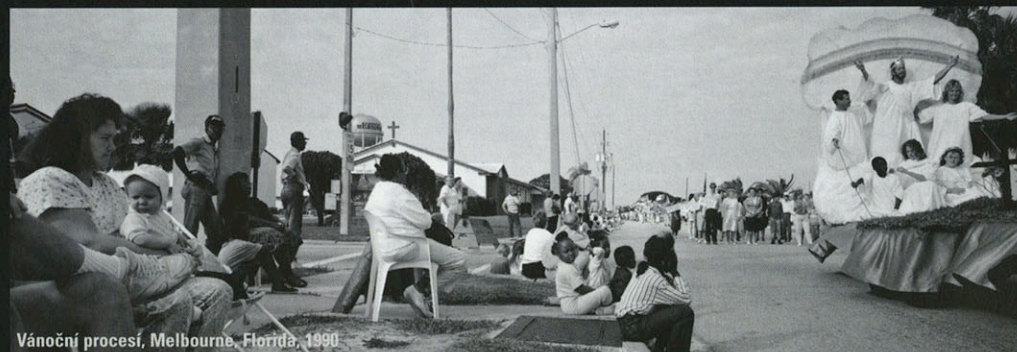
Vánoční procesí, Melbourne, Florida, 1990