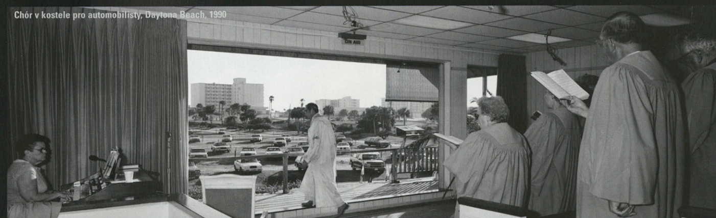
Chór v kostele pro automobilisty, Daytona Beach, 1990

De Keyzer výrazně uplatnil barvy v neobvykle snímaných záběrech z inaugurace prezidenta Clintona, volební kampaně v Moskvě či papežova kázání v římském Koloseu. Opět mu však nešlo o běžné reportáže z důležitých událostí, protože často místo hlavních protagonistů a scén fotografoval jejich diváky. V knize Evropa (2003), složené z mnohdy až surreálných záběrů z různých evropských zemí (a bohužel velmi necitlivě graficky upravené), se vrátil k černobílé fotografii, ale hned