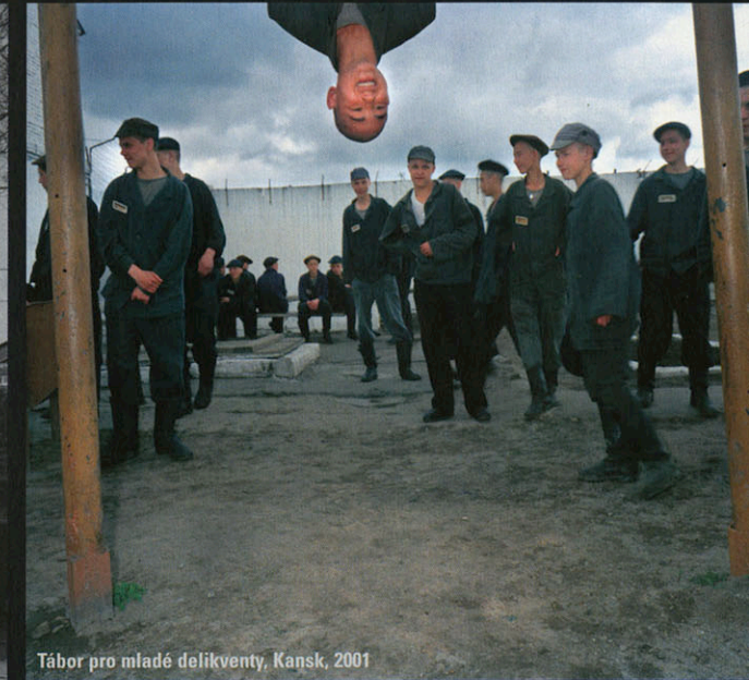
Tábor pro mladé delikventy, Kansk, 2001