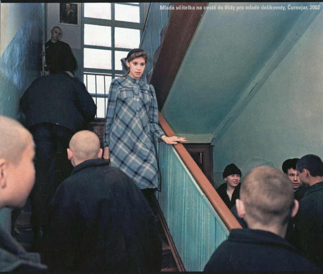
Mladá učitelka na cestě do třídy pro mladé delikventy, Čurnojar, 2002