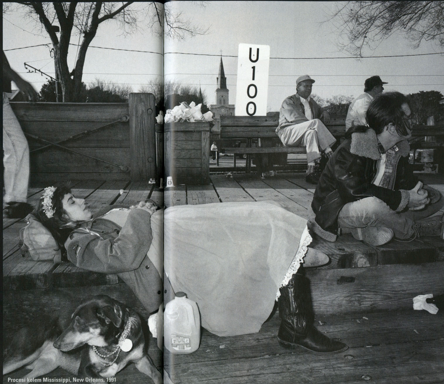
Procesí kolem Mississippi, New Orleans, 1991