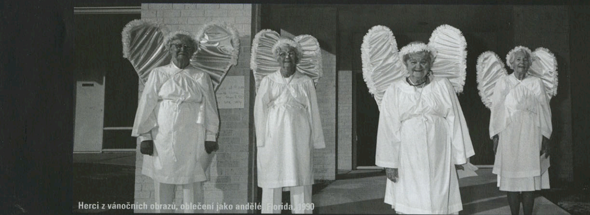
Herci z vánočních obrazů, oblečení jako andělé, Florida, 1990