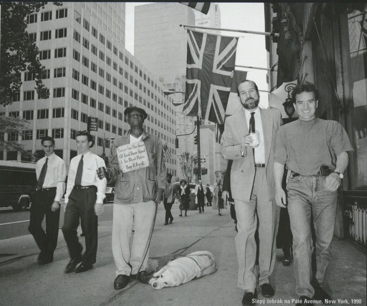
Slepy žebřák na Páté Avenue, New York, 1990