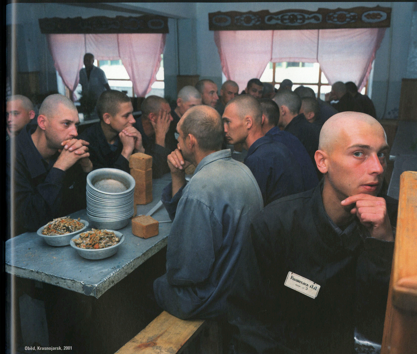
Oběd, Krasnojarsk, 2001

Vždyť na ní představil své dva vynikající cykly jeden z nejlepších světových dokumentaristů současnosti a jeden z nejznámějších současných členů agentury Magnum.