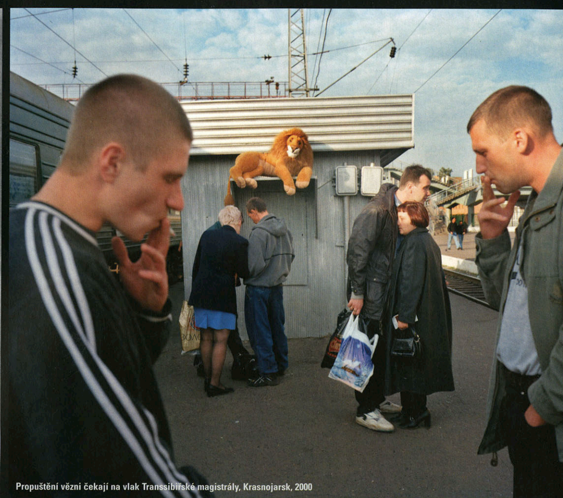
Propuštění vězni čekají na vlak Transsibiřské magistrály, Krasnojarsk, 2000