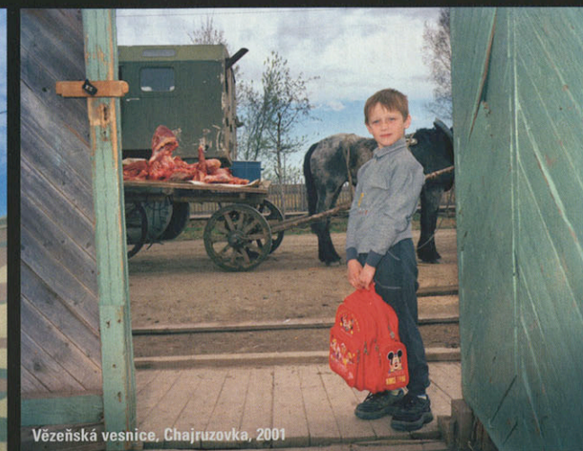
Vězeňská vesnice, Chajruzovka, 2001