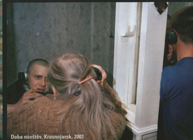
Doba návštěv, Krasnojarsk, 2001