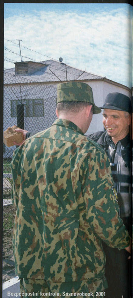
Bezpečnostní kontrola, Sosnovoborsk, 2001