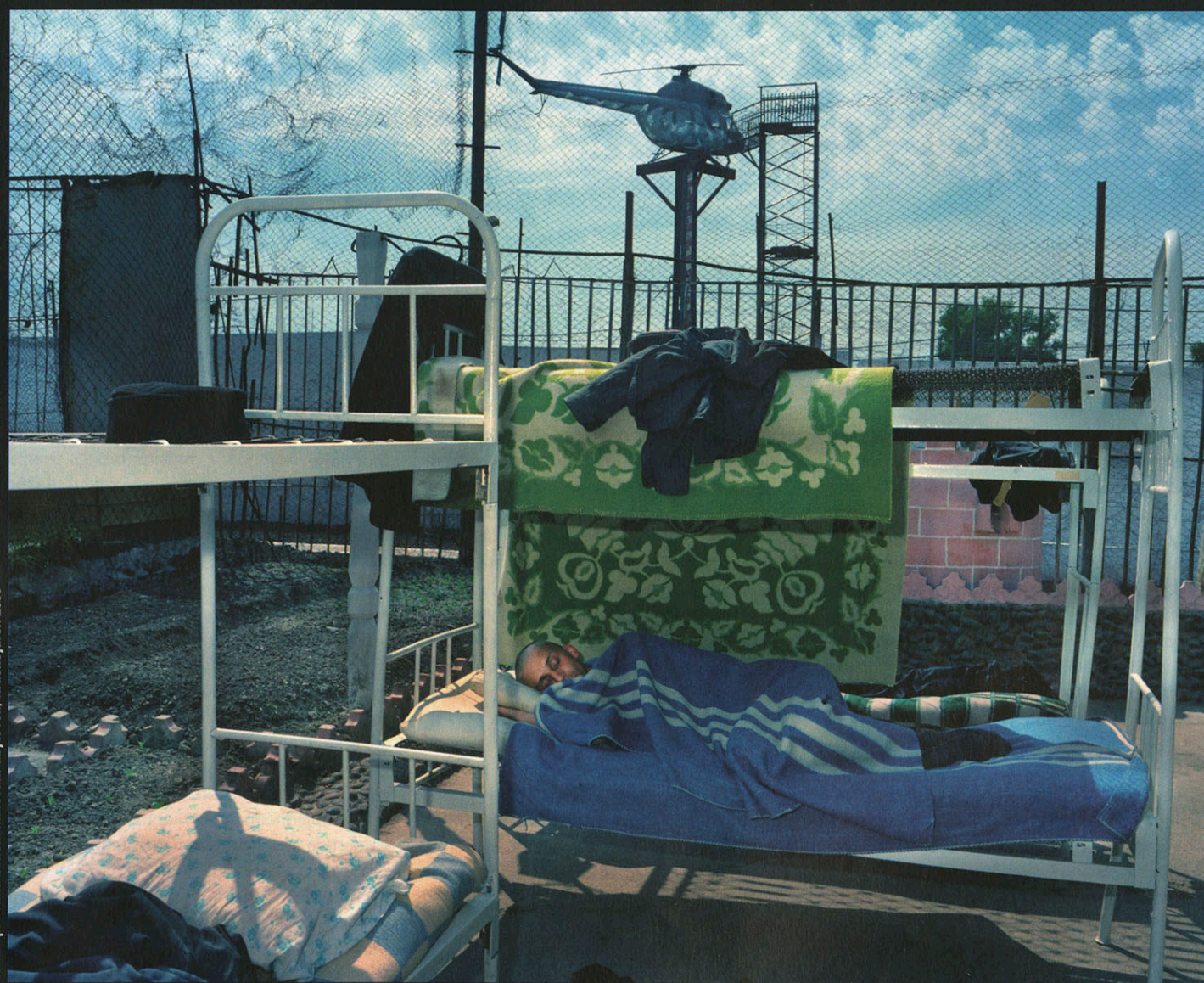
Vězni spí venku během malování ubytoven, Krasnojarsk, 2000

Výstava belgického fotografa Carla De Keyzera v Domě umění města Brna vyvolala na přelomu loňského a letošního roku podstatně menší mediální zájem, než by si zasloužila.