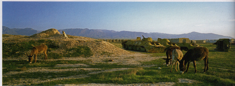
CARL DE KEYZER - MAGNUM MAZAR E SHARIFF, AFGHANISTAN.

Een storend reclamepaneel weghalen met Photoshop, mag dat dan ook? "Ik vind van niet. Wat ik nu wel doe voor werk in opdracht, is het combineren van verschillende stukjes werkelijkheid. Met de camera op een statief werken en zo op verschillende momenten aparte aspecten uit één cadrage combineren. Het is een manier om de beperkingen van de fotografie te overwinnen. Soms moet ik te veel foto's maken voor een resultaat waarover ik niet helemaal tevreden ben. En uiteindelijk kan ik alleen maar de beste tonen, dat verwacht men ook van mij. Er zijn te veel situaties die zo rijk zijn aan inhoud maar waarin de mensen niet op de juiste plaats staan, ook al ben ik nog zo snel.