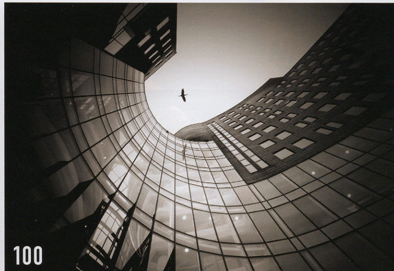
NORBERTA JANSSENS EIGENZINNIGE AMATEURS