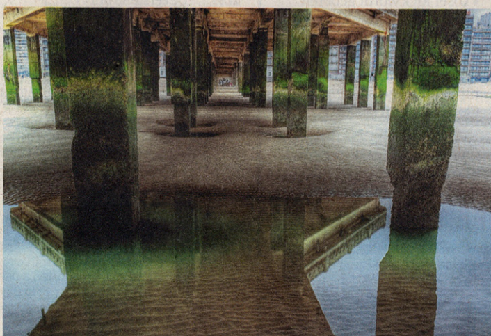
■ Een van de eerste beelden uit 'Moments before the Flood', het nieuwe project van De Keyzer.

Trinity nog tot 30 augustus in het S.M.A.K.