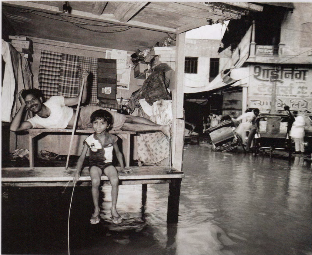
BENARES, INDIA (1986) (uit India, 1987).

vooral de mensen in Congo die het vreselijk moeilijk maakten om te fotograferen. "Hun administratief protocol is waanzinnig, Kafkaïens: je hebt voor alles toestemming nodig. Je kunt daar gewoon niet op straat rondlopen met een toestel en een foto maken, al is het maar van een gebouw. Dan krijg je onmiddellijk tien, vijftien mensen rondom je die je naar het politiekantoor willen brengen. Er was een constant gevecht om te doen wat ik wou doen. Ik zie het echt wel als een van mijn moeilijkste projecten ooit."