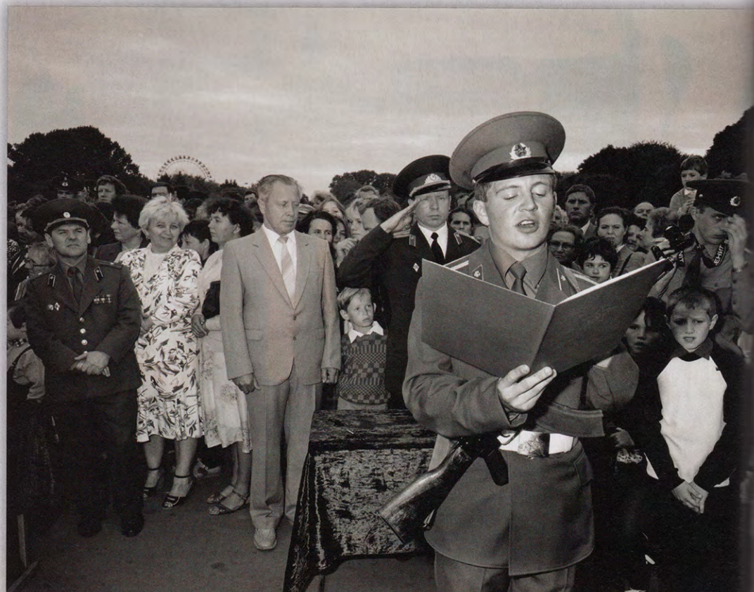
HULDIGING ERE-SOLDATEN, Gorki Park, Moskou, 1989 (uit Homo Sovieticus, 1989).