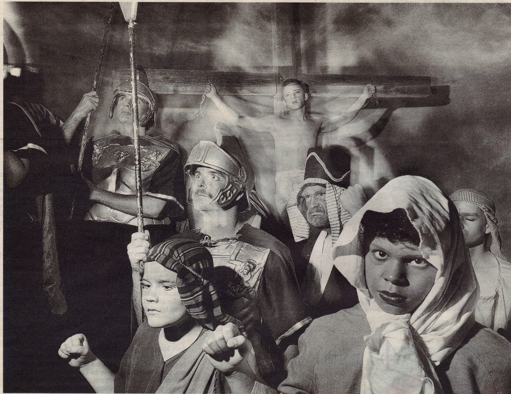
Passieprocessie in Trinity Church, Dallas, VS, 1990. (uit God Inc.)