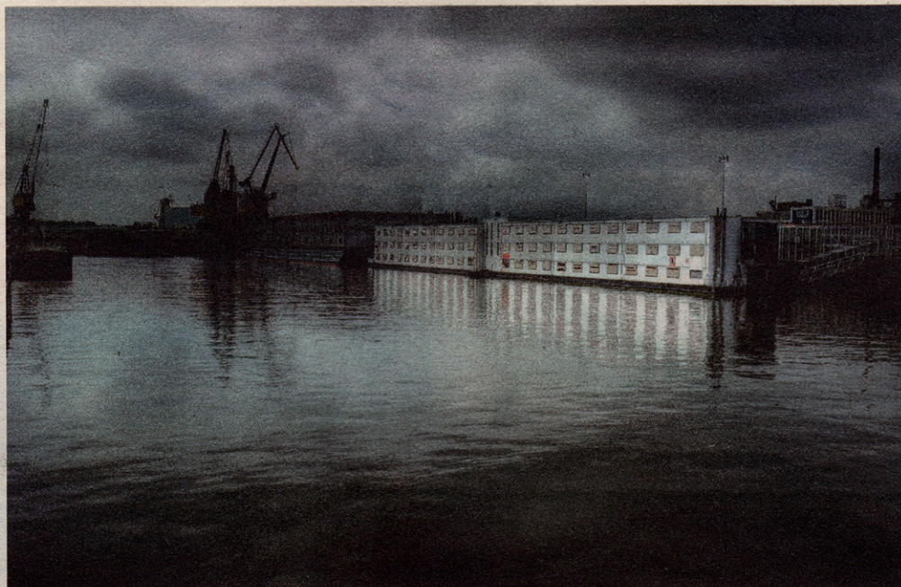
Bajesboten, Rotterdam, 2007. (uit 'Moments before the Flood').

'Alles hangt af van de deontologie van de maker. Maar het is een evolutie die sowieso niet te stoppen is. En ze heeft twee tendensen met zich meegebracht. Vroeger kon je je strepen verdienen met prachtige composities: "kijk, ik heb dit allemaal op een fractie van een seconde gezien". Dat was hard werken, pure gymnastiek. Ik noem dat de Olympische Spelen van de fotografie. Heel weinig mensen konden dat. Vandaar dat ik zoveel bewondering heb voor mensen als Alex Webb. Die hadden precies vijf ogen, waarmee ze alles konden volgen. Ik heb me daar ook op getraind, en dat is iets wat niemand mij kan afnemen.'