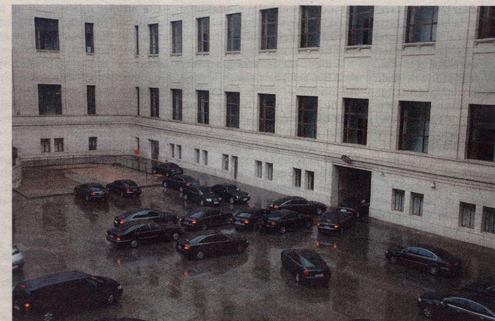
Vijfde zitting van het Tiende Nationale Comité van de Politieke Raadgevende Conferentie van het Chinese Volk. (uit 'Trinity').