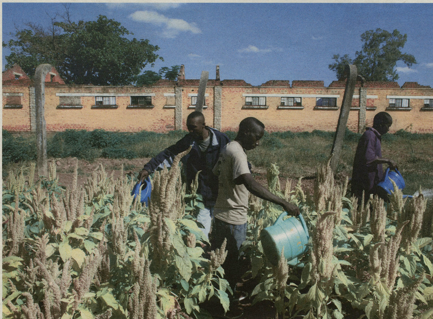
Werk op het veld in de gevangenis van Likasi.