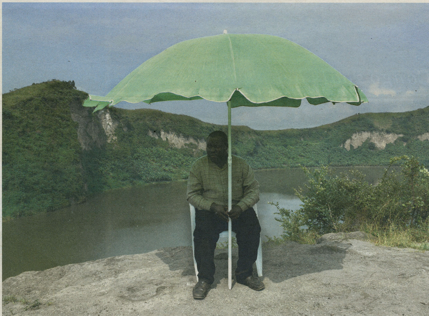
Ontspannen bij het meer van Sake.

Komt daar verandering in? 't Is maar de vraag. Aan de Belgische universiteiten is een nieuwe generatie onderzoekers aangetreden die zich noch op de borst klopt over de koloniale verwezenlijkingen, noch beperkt tot navelstaarderij over de postkoloniale