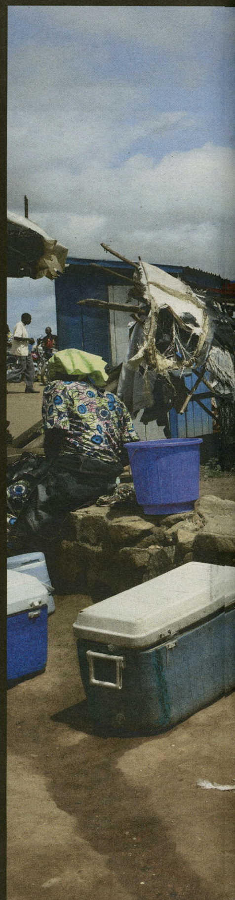
Vismarkt in Bunia.