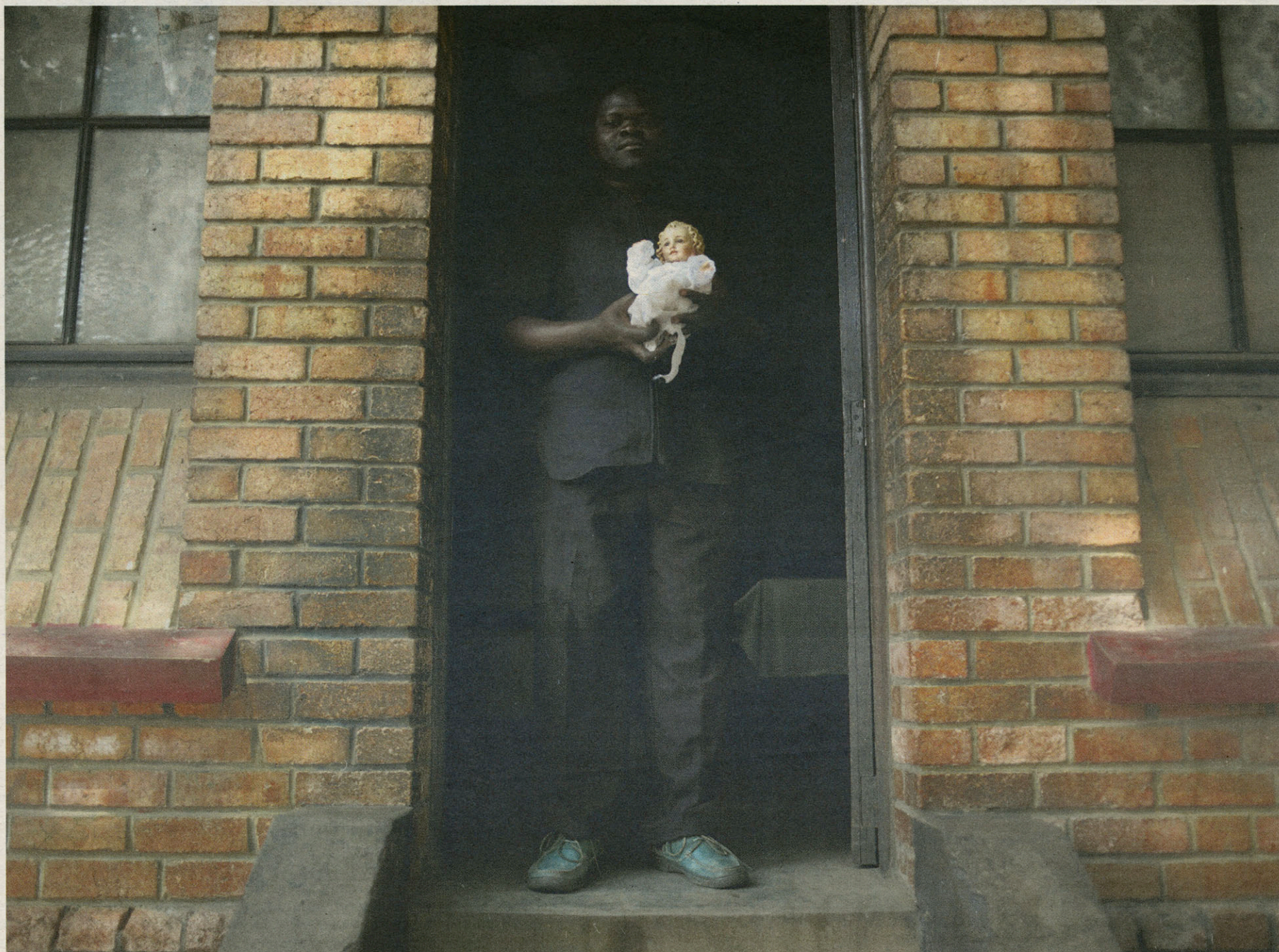
Kinshasa, de kerk van Sint-Franciscus van Sales.

En de democratische verworvenheden van 2006 gaan teloor. Regering en parlement hebben steeds minder te piepen, de macht berust bij de president en zijn kliek, de oppositie wordt gemuilkorfd, de media worden voorzichtig. Weinig verheffend allemaal.