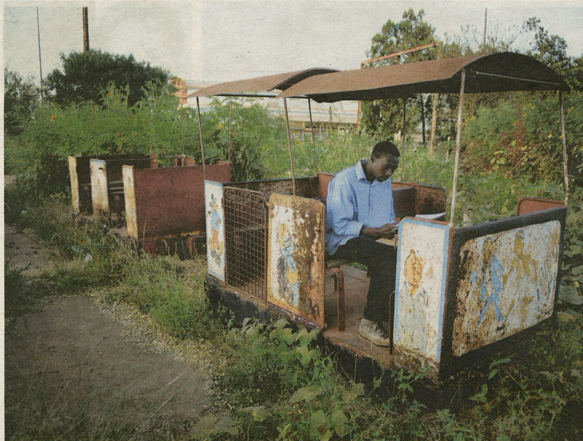
Met een toeristische gids van 50 jaar geleden trok Carl De Keyzer door Congo. Hij kwam er onder meer terecht in dit verlaten pretpark.

VRAAG 3 | Welk boek uit dit eerste decennium van de 21ste eeuw zal u het meest bijblijven?