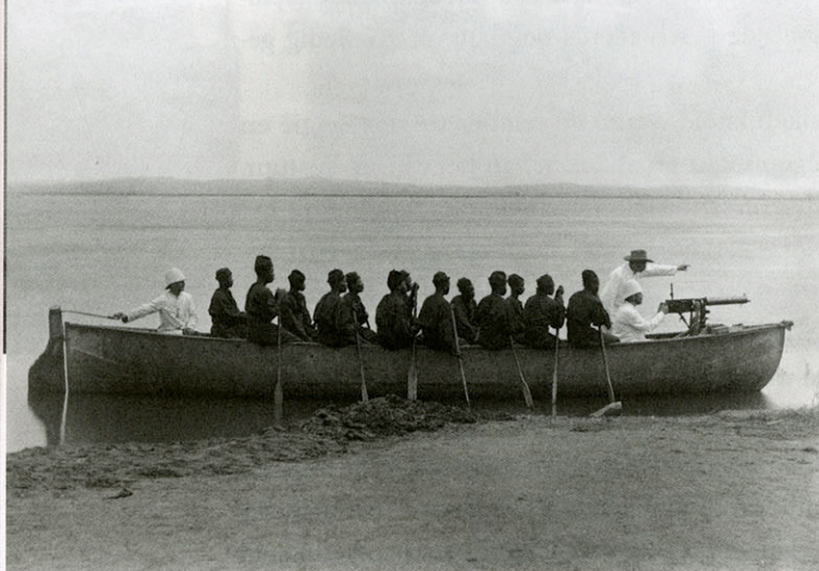
Wapenoefening met de Maxim-mitrailleur, Oostelijke Provincie, Congo, collectie KMMA Tervuren, AP.0.0.544.

Muntfonds (1982) — kreeg Martens bittere spijt van die uitspraak. De enorme persoonlijke verrijking van de president, de corruptie op alle niveaus en de uitholling van de publieke dienstverlening konden niet langer genegeerd worden. Congo verloor de steun van de Belgische media, de ontwikkelingssamenwerking werd langzaam teruggeschroefd en met de dalende handelscijfers tussen beide landen werd ook het economische argument minder van tel. Op Buitenlandse Zaken pleitte men nu voor een