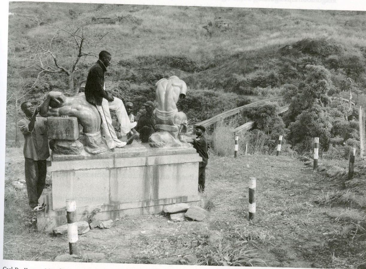
Carl De Keyzer, Matadi 2007 - Monument voor de dragers, uit Congo (belge) , Lannoo, Tielt, 2010, 352 p., Foto © Carl De Keyzer.

Mobutu zou tweeëndertig jaar aan de macht blijven. Onder zijn bewind werd Congo omgedoopt in Zaïre en zo zou het land tot het eind van zijn regime blijven heten. De eerste tien jaar, van 1965 tot 1975, beschouwt Van Reybrouck als "de gouden jaren" van onafhankelijk Congo. De vijftien jaar daarna vormen een tijdvak dat met hoopvolle verwachtingen begon, maar al snel onttaarde in een krankzinnig stelsel van corruptie en grootheidswaan. Mobutu riep zichzelf uit tot maarschalk en liet midden in het oerwoud een hele stad bouwen die geen andere functie had dan te dienen als zijn paleis. Inmiddels raakte het land in een economische crisis en steeg de inflatie tot duizelingwekkende hoogten. In 1990 kondigde Mobutu abrupt het einde van de éénpartijstaat aan, maar democratie kwam er niet.