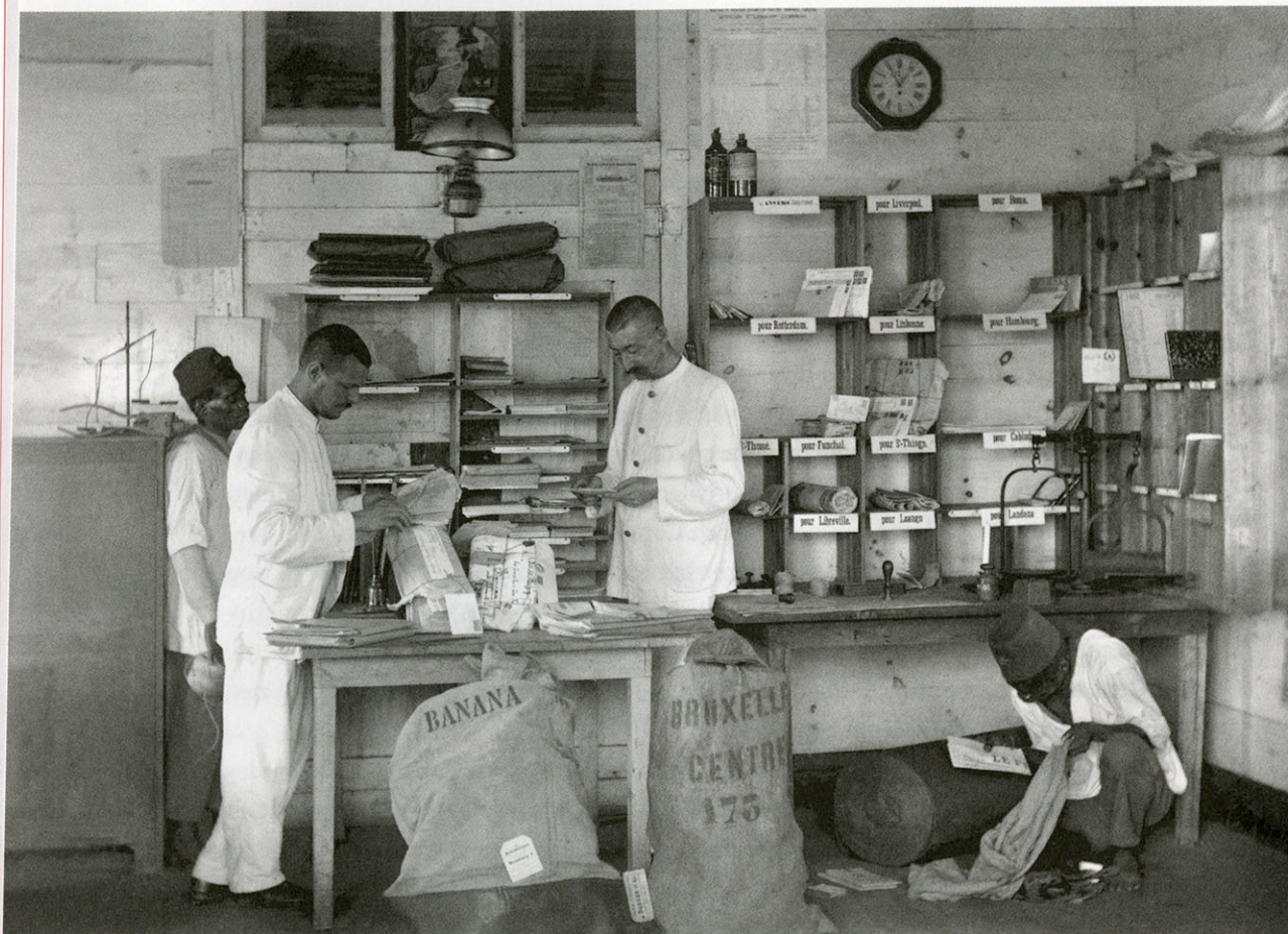
Postkantoor te Banana, Congo, 1892, collectie KMMA Tervuren, AP.o.o.56, Foto H.A. Shanu.

onderschrijven diezelfde historici de fundamentele moeilijkheid om “een ambivalent personage of een ambivalente gebeurtenis” in te passen “in het relaas van de nationale geschiedenis” 2 . Het wordt niet simpel, dat herdenken van het gemeenschappelijke verleden aan het einde van Congo’s eerste cinquantenaire .