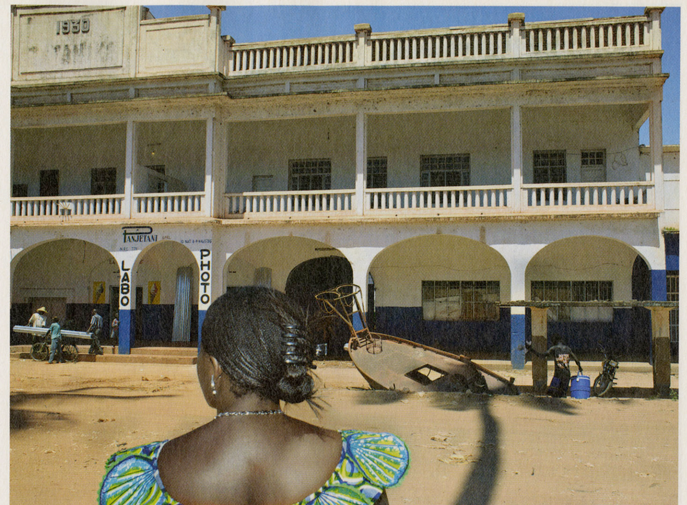
Nog maar twee van de dertig kamers van Hotel Palace, ooit een vijfsterrenhotel, zijn in gebruik. De grote havenstad Albertville is nu een vergeten vissersdorp. In de goot ligt een wrak van een vissersboot.