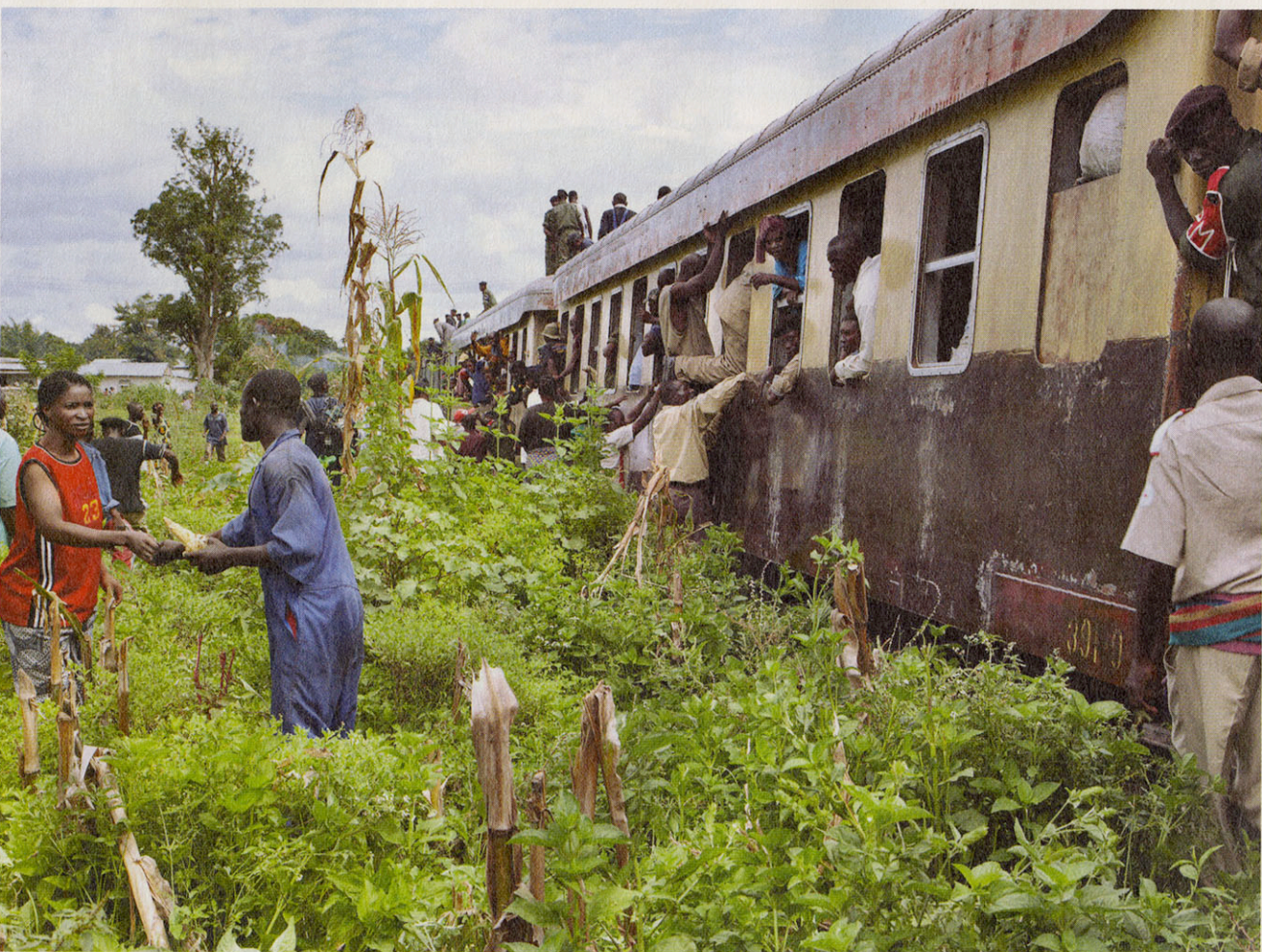
Het duurde twee dagen voor de overvolle trein uit de hoofdstad Albertville kon vertrekken. Er zaten aanvankelijk te veel mensen in, waardoor de locomotief de wagons niet kon voorttrekken.