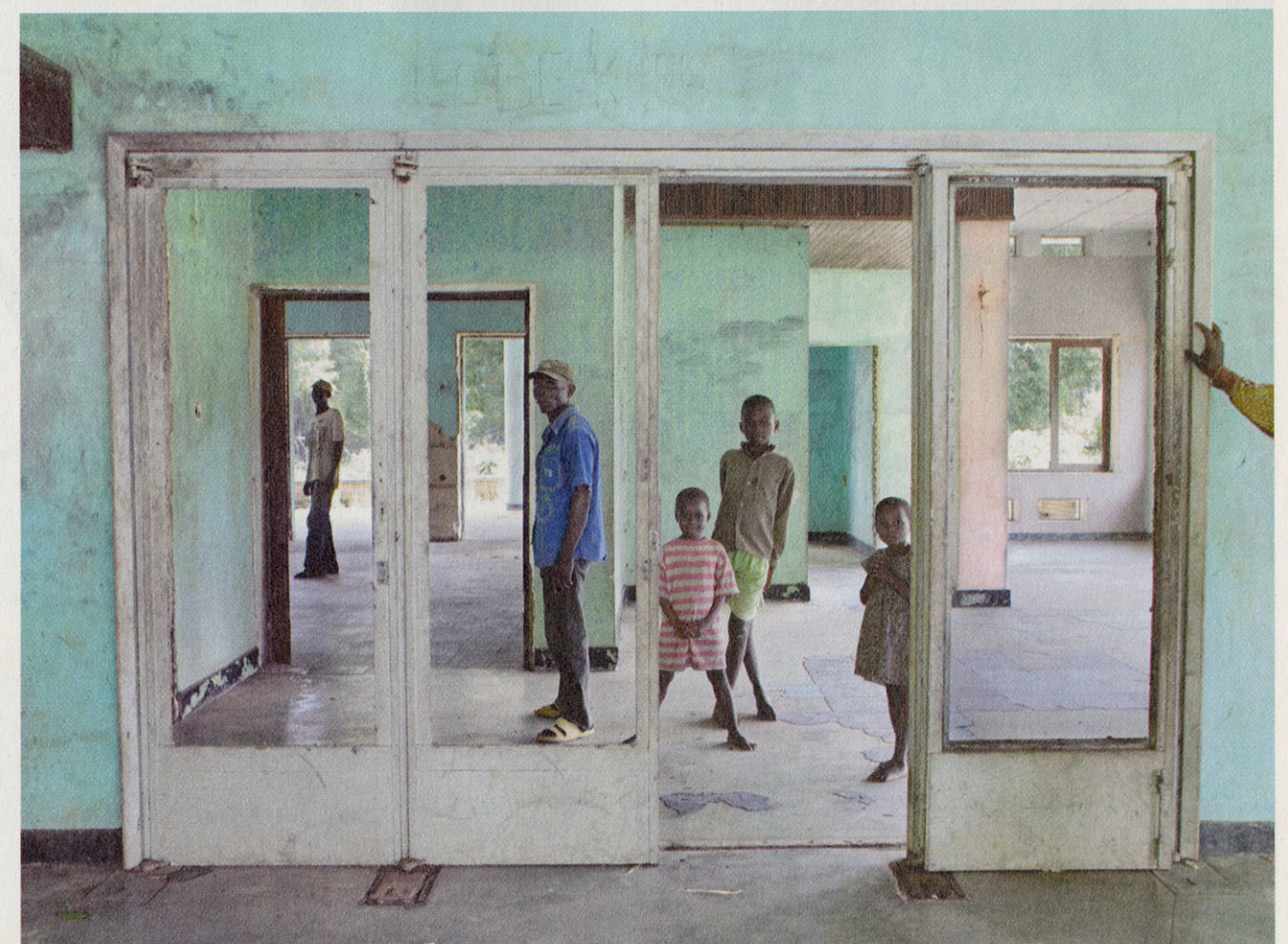
In het landbouwkundig onderzoeksinstituut in Yangambi wordt al jaren geen onderzoek meer gedaan. In de vroegere balzaal wordt vooral veel gespeeld.