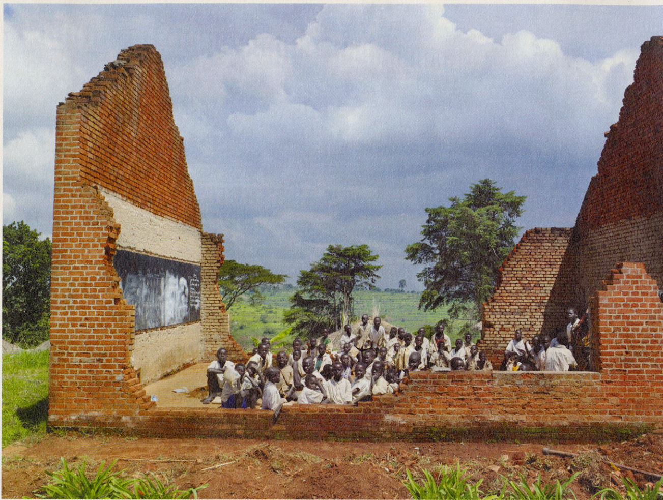
De katholieke missiepost in Jiba is door de burgeroorlog verwoest. Toch wordt er nog dagelijks onderwijs gegeven aan tientallen kinderen van verschillende leeftijden.