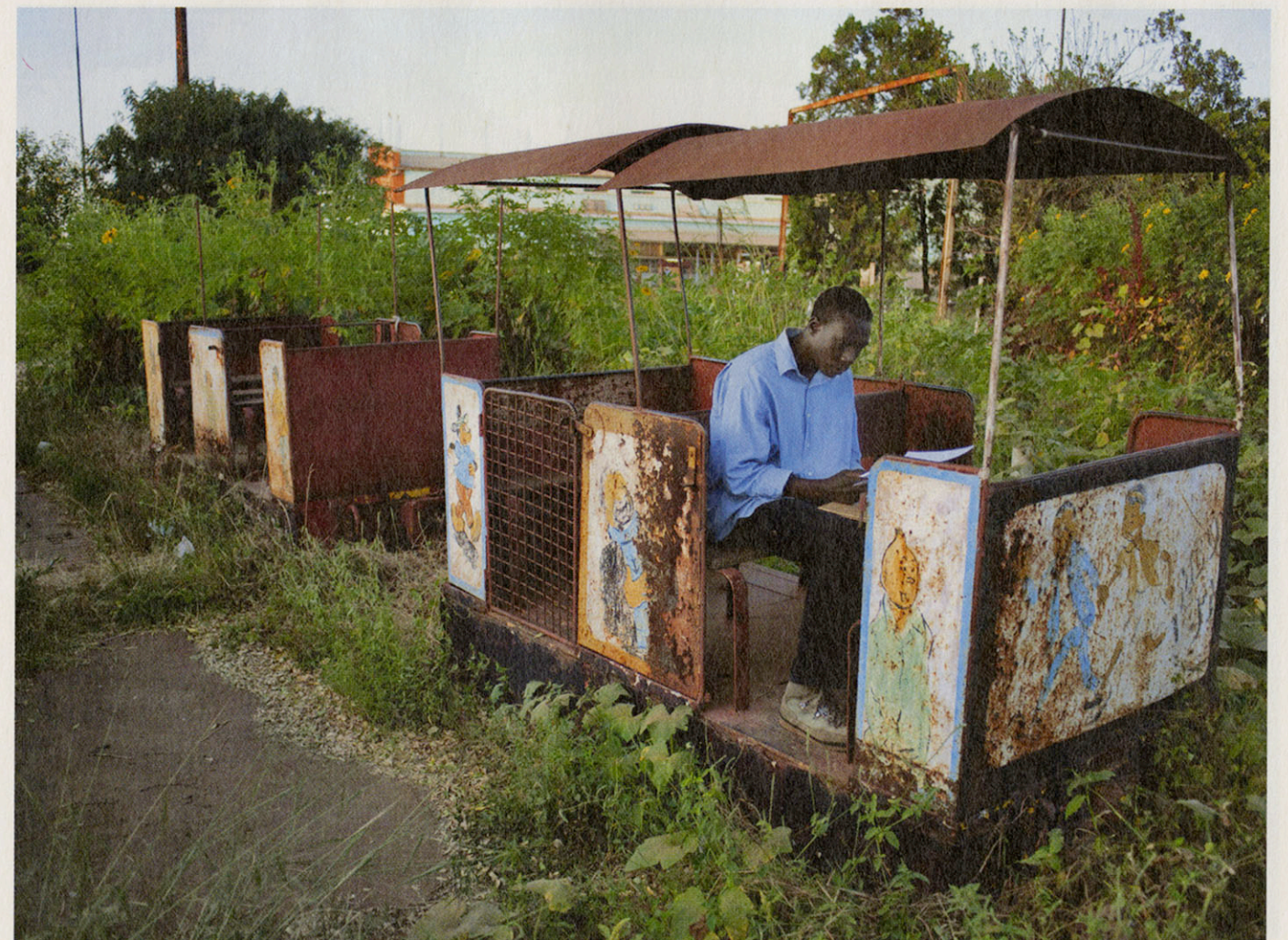
Een student gebruikt een versleten kar in een verlaten recreatiepark in Kolwezi als werkplek. Foto pagina 28/29: In de voormalige Belgische gouverneurswoning in Stanleyville wonen nu zeven Congolese families.