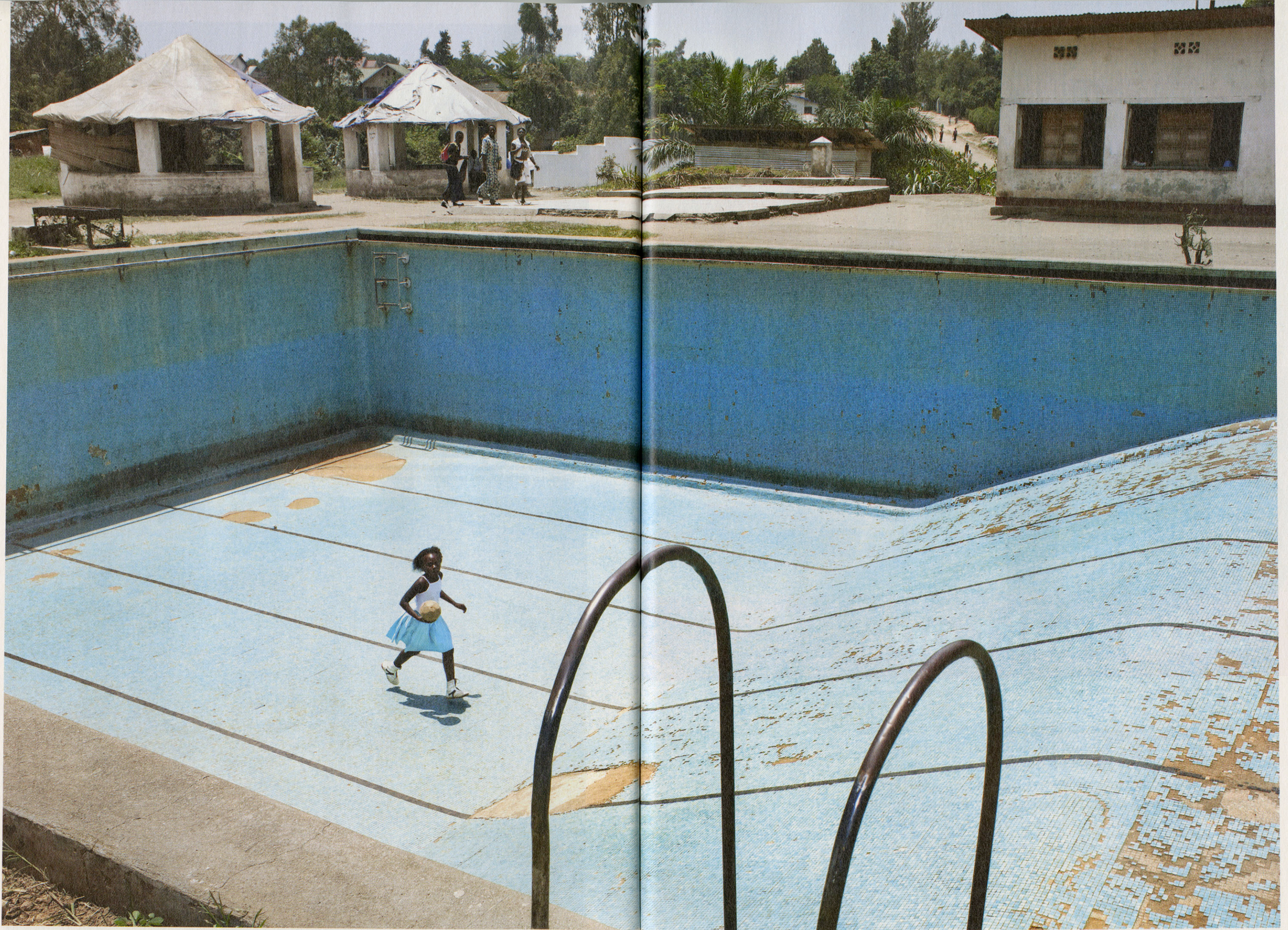
Overal in Congo liggen voormalige sport- en recreatieparken van Belgische kolonisten er verwaarloosd bij. Een meisje gebruikt dit lege zwembad in Bunia als speelveld.