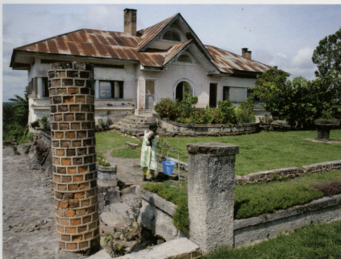
STANLEYVILLE / STANLEYSTAD, VILLA D'UN COLON, 2008