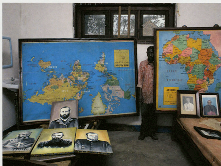
BENI, MISSION CATHOLIQUE SAINT-GUSTAVE, 2008

paysage actuel d'un pays comme celui-ci, ce genre d'images surréalistes. Le Congo est la chambre au trésor des images... le tout est d'y accéder !