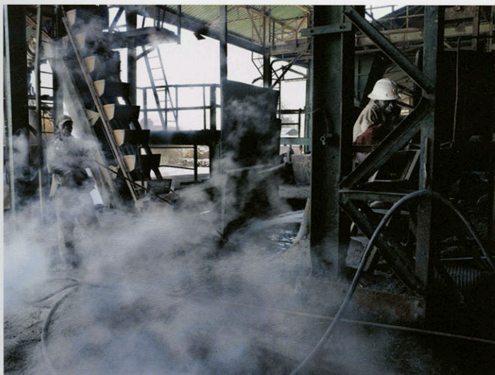
JADOTVILLE / JADOTSTAD, UMHK (UNION MINIÈRE DU HAUT KATANGA). SHITURU, 2009