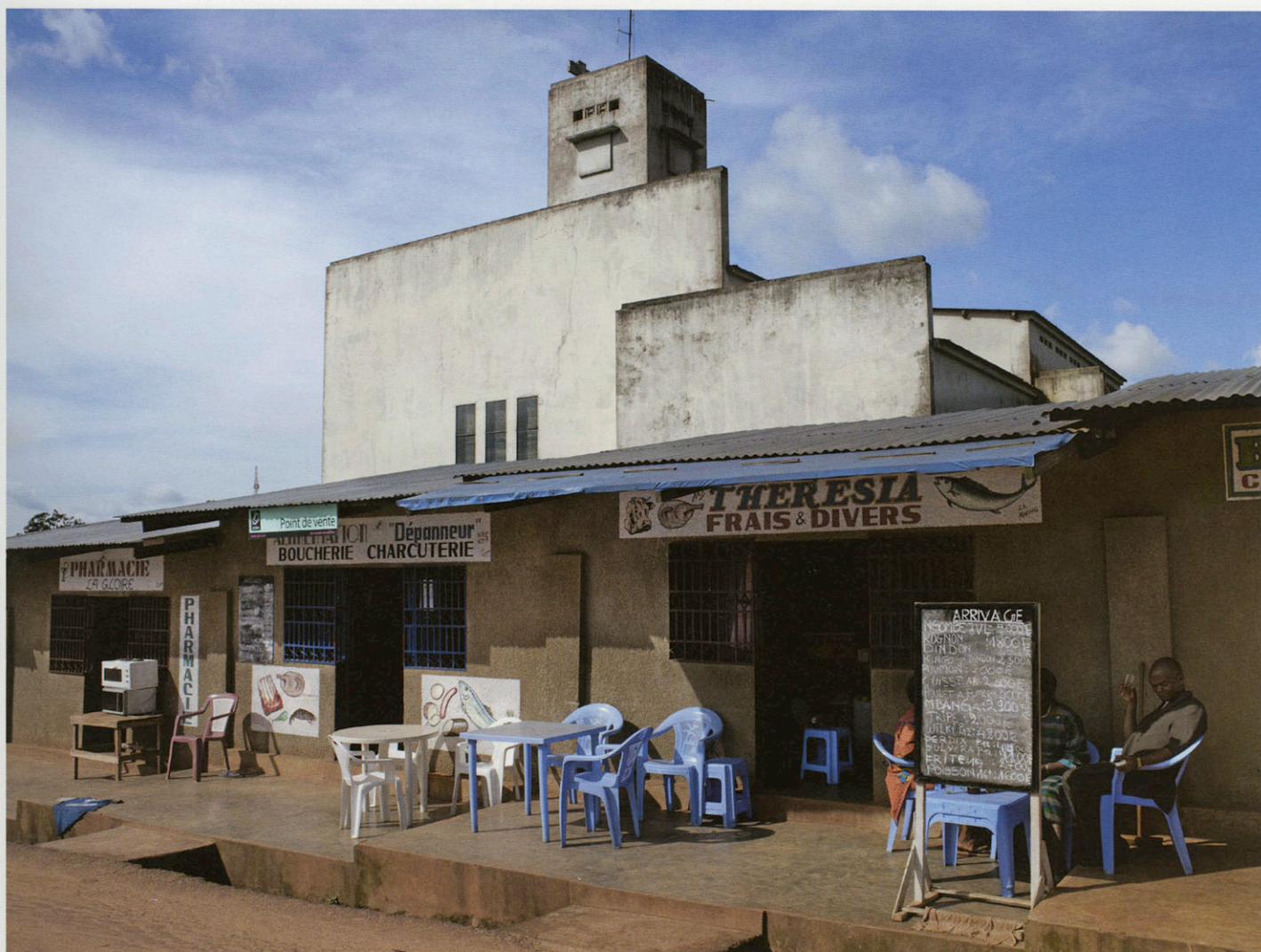
THYSVILLE, EGLISE SACRÉ-CŒUR, 2009

cas un projet « didactique ». Il ne s'agit pas de montrer à quoi ressemble la mission, cent ans après. S'il n'y a pas d'image , je n'en ferai rien pour le livre.