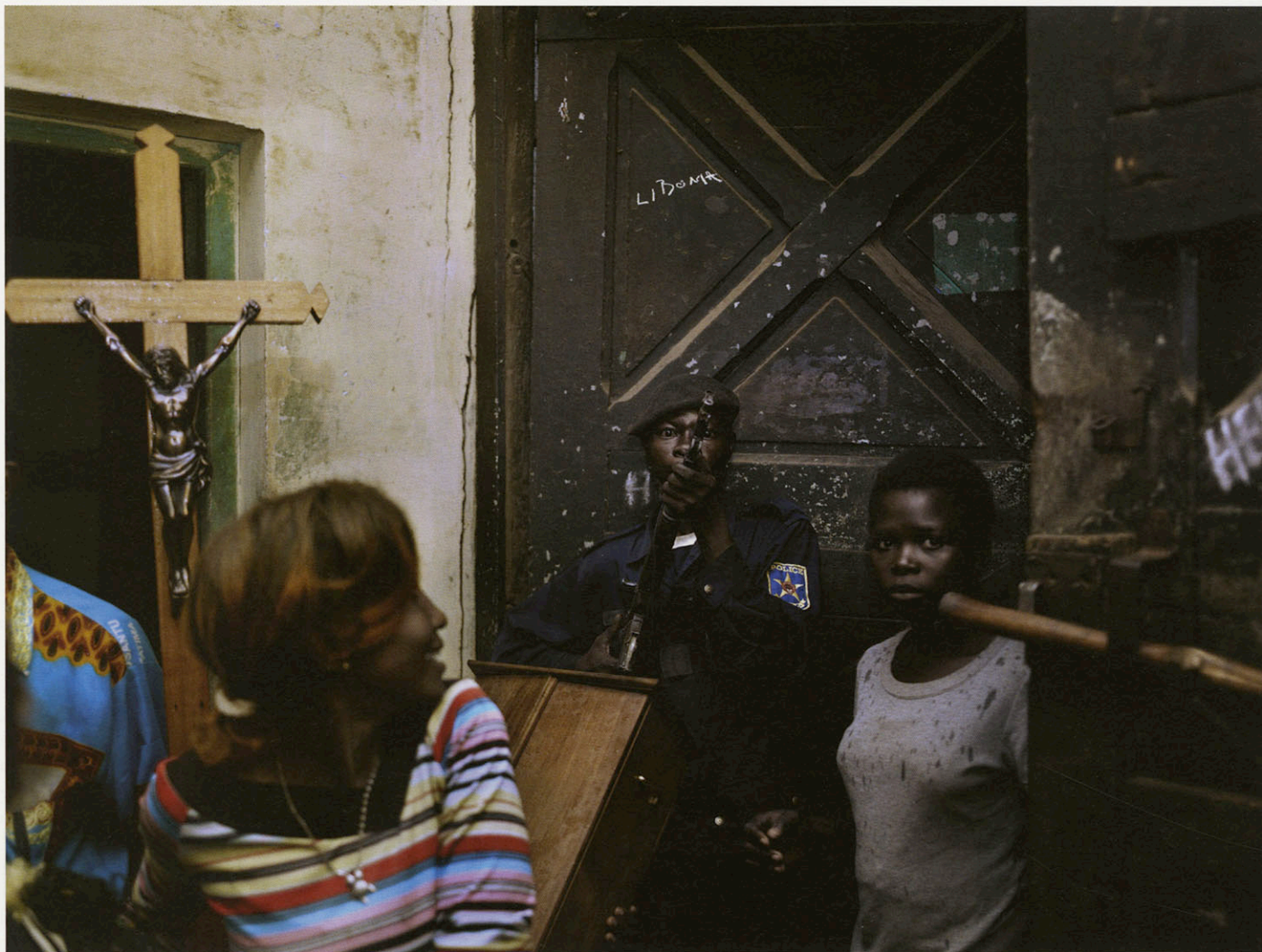
KIKWIT, PRISON, 2007

Sur une des photos, on voit un fusil braqué sur toi, à l'ouverture des portes d'une prison. Ça en dit long sur les conditions dans lesquelles tu as travaillé. Jusqu'où était-il possible ou risqué de s'aventurer, en tant que photographe, dans ce pays qui demeure tout de même en état de guerre ?