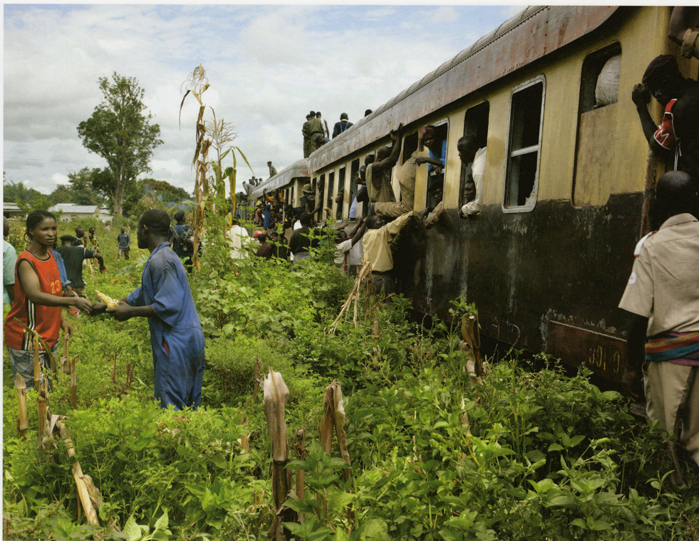
ALBERTVILLE / ALBERTSTAD, CHEMIN DE FER, 2008