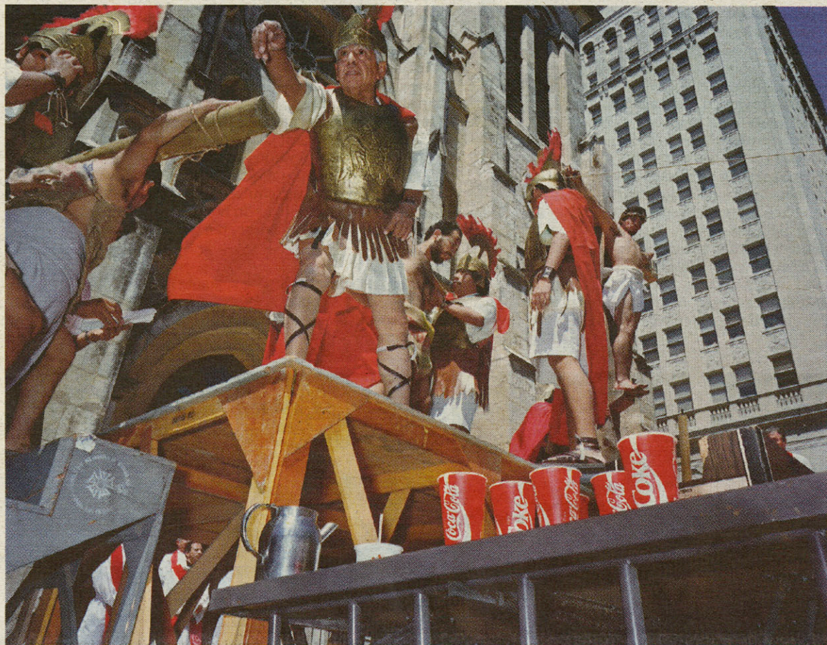
USA. San Antonio. Our Lady of Guadalupe church. Good Friday Procession, 1990-1991.