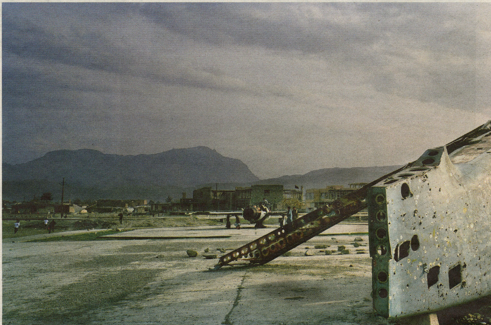
Afghanistan. Kabul, 2003.

Hij wilde, zegt de Vlaamse Magnum-fotograaf Carl de Keyzer (1958) over zijn sleutelwerk Trinity , 'de stilte, afstand en tijd herinvoeren, die door de jachtige nieuwsfotografie en televisieverslaggeving verloren is gegaan. Hij dacht: 'Ik ga het net doen als vroeger de schilders. Van hen werden een of twee schilderijen getoond in een paleis aan het publiek. Ik kom ook met een paar beelden van grote gebeurtenissen en druk ze heel groot af, dan moet iedereen wel langer kijken dan vijf seconden, zoals bij de tv. Mensen zeggen dan: ik heb die gebeurtenis op tv gezien, maar dit zag ik niet.'