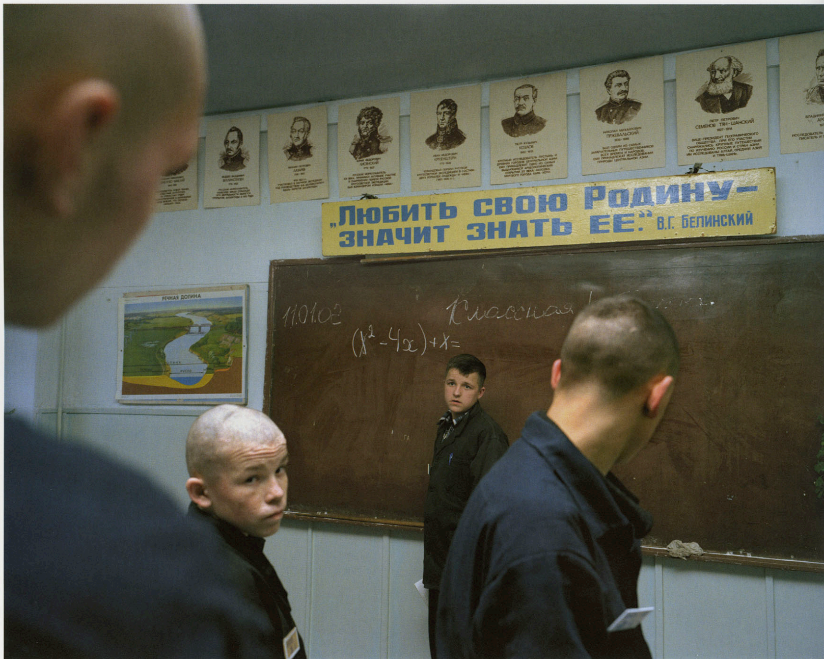
Zona - Kansk, Russia. 2001 Youth, Camp - Carl De Keyzer © Magnum Photos