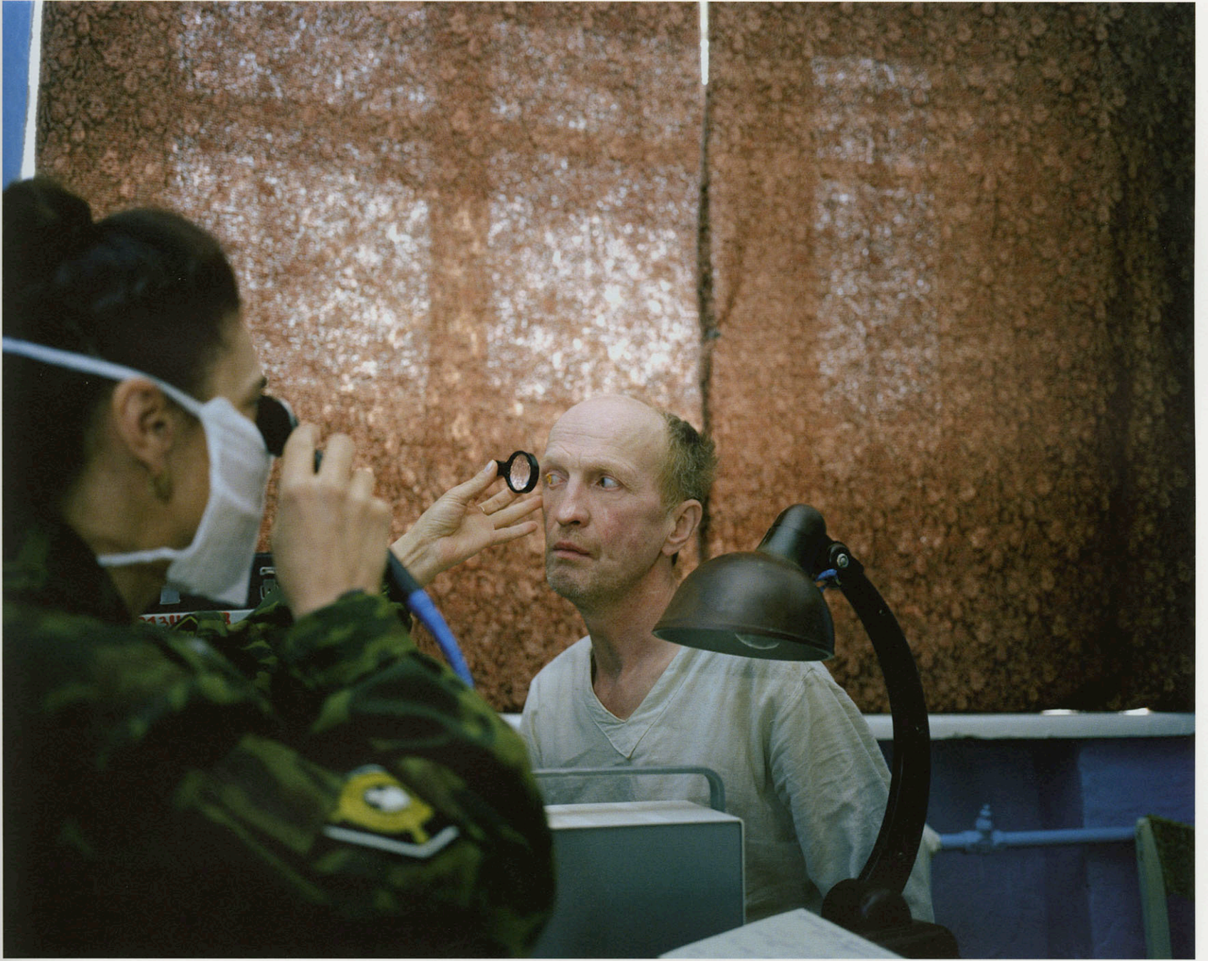
Zona - Krasnoyarsk, Russia 2000, Camp 18