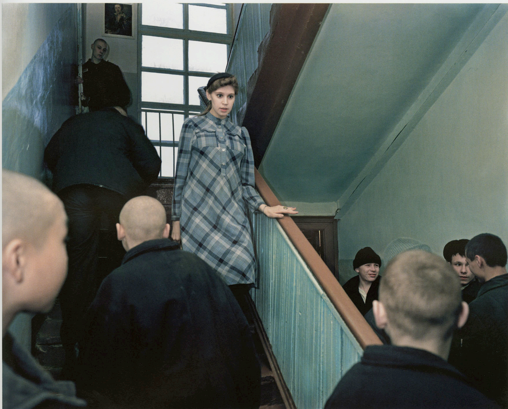
Zona - Kansk, Russia. 2001 Youth, Camp

Het meest recente werk van Carl de Keyzer was zeer onlangs te zien in de tentoonstelling "Euro Visions. Les Nouveaux Européens par dix photographes de Magnum" (Parijs, Centre Pompidou), waar het figureerde naast bijdragen van Martine Franck, Peter Marlow, Martin Parr, Mark Power, Chris Steele-Perkins, Lise Sarfati, Donovan Wylie en Patrick Zachmann.