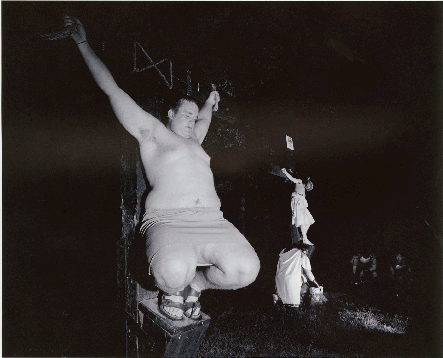
God inc. - Eureka springs., Easter Passion Play, Arkansas USA 1991