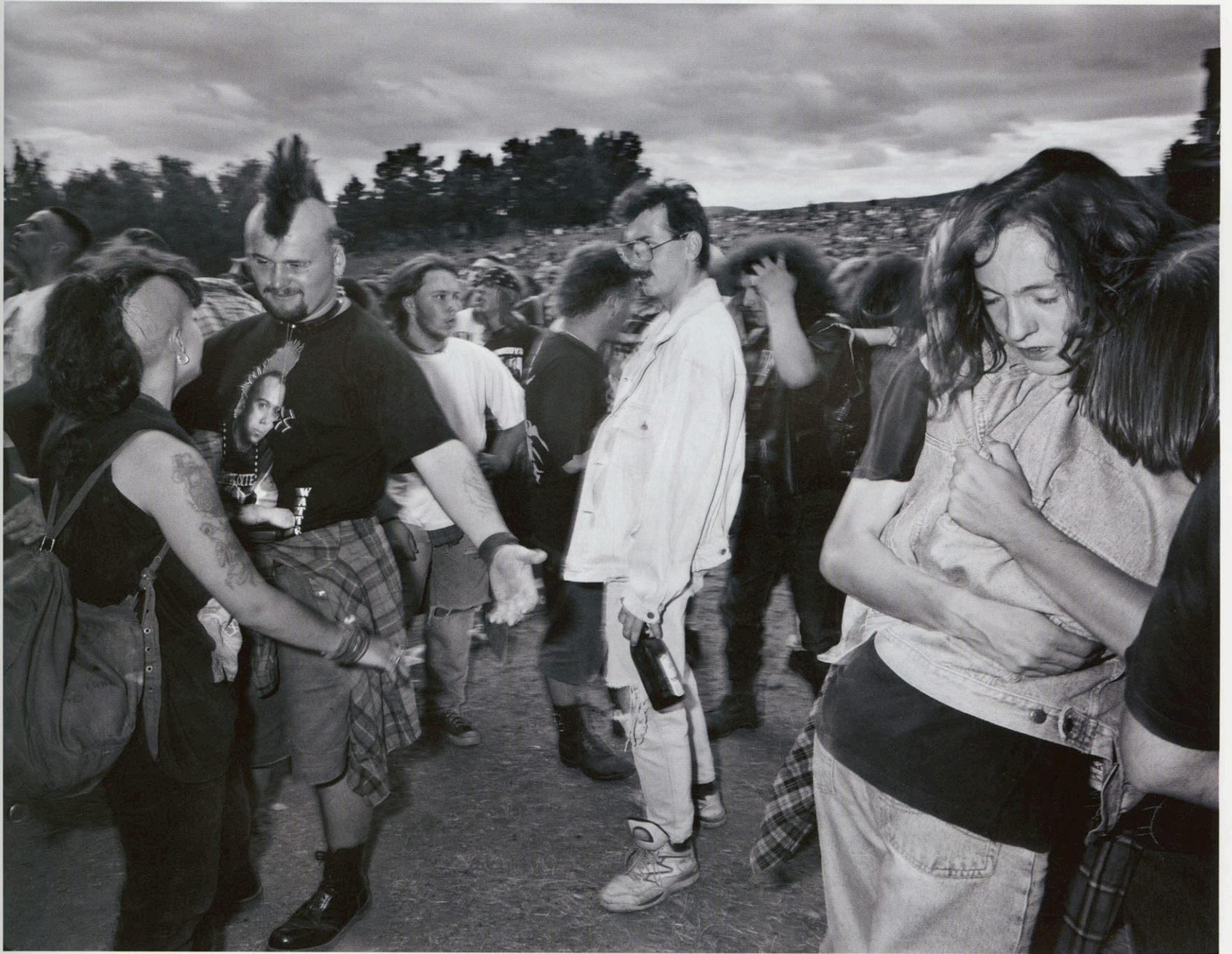
East of Eden - Woodstock Festival, Budapest, Hungary 1994 - Carl De Keyzer © Magnum Photos