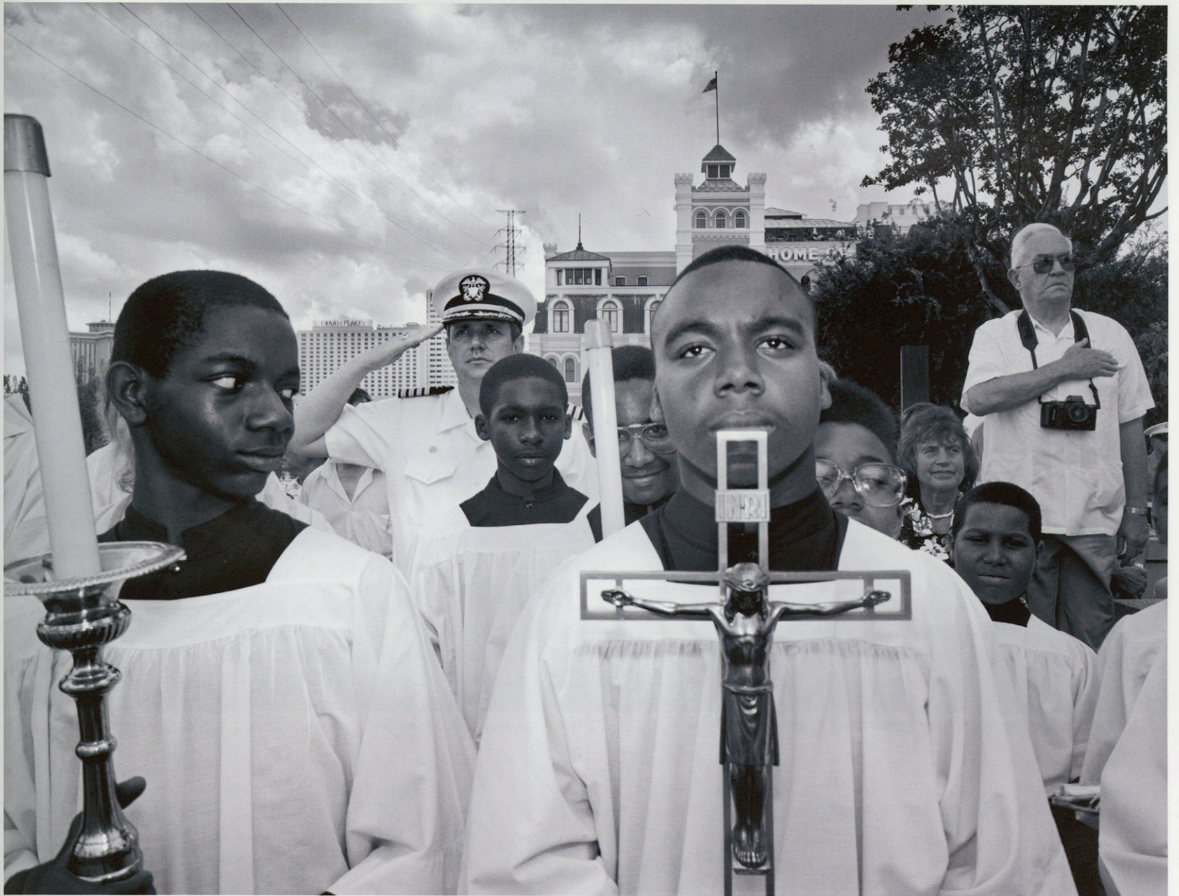
God inc. - New Orleans, USA 1990, Blessing of the Mississippi River - Carl De Keyzer © Magnum Photos