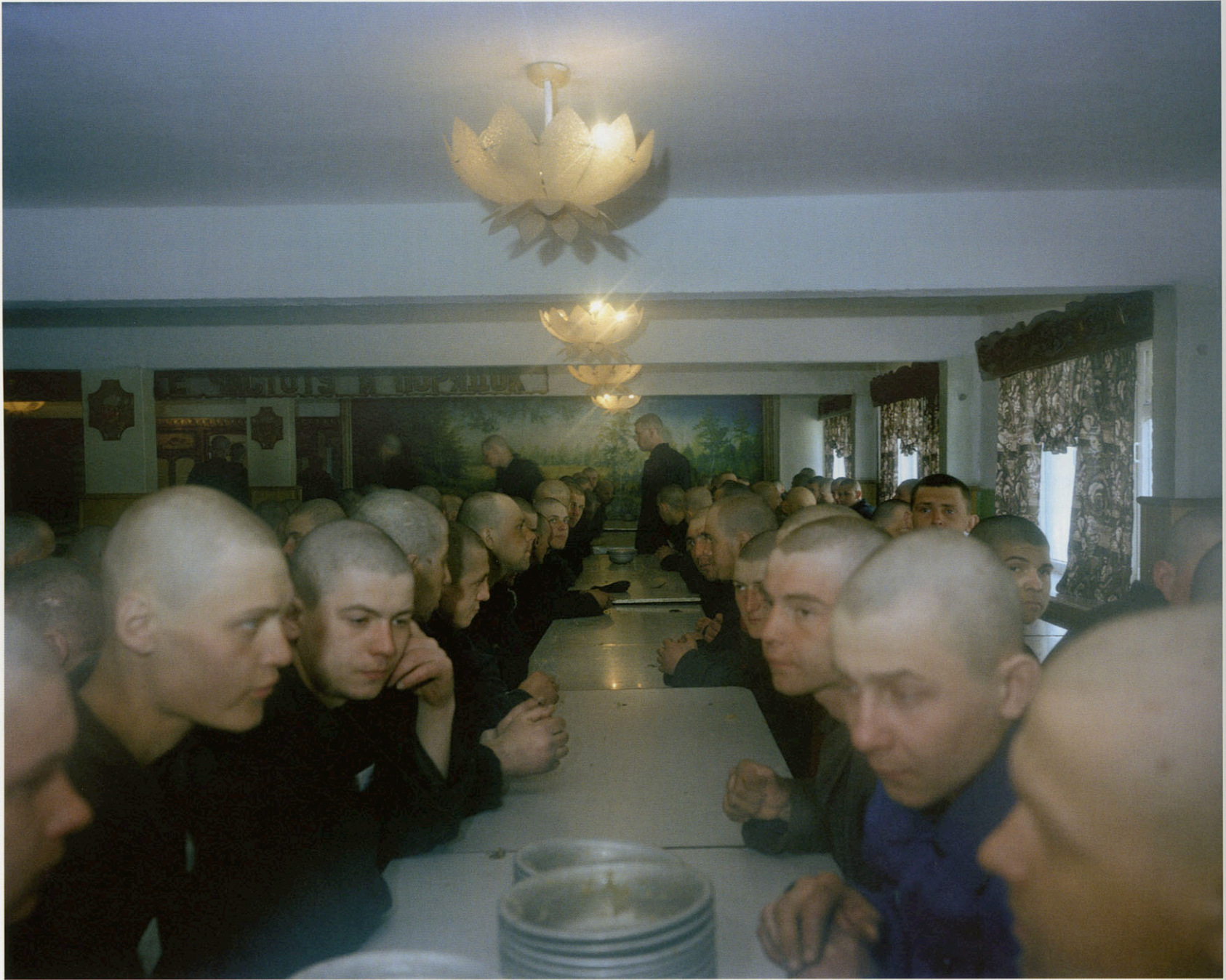
Zona - Krasnoyarsk, Russia 2000, Camp 27 - Carl De Keyzer © Magnum Photos