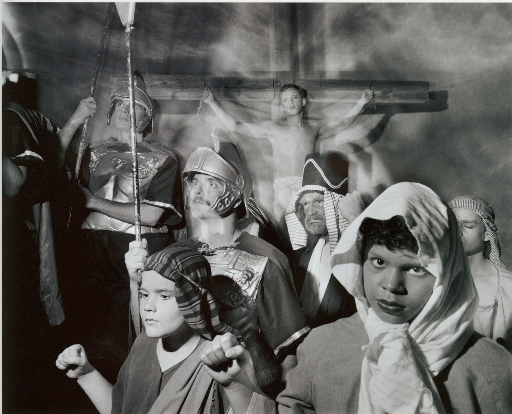
God inc. - Trinity Church, Assembly of God, Easter Passion Play, Dallas USA 1991