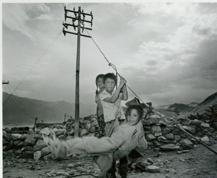
India - Leh, India 1986 - Carl de Keyzer © Magnum foto's

C'est en 1984 que Carl De Keyzer (né à Courtrai en 1958), diplômé depuis quelques années de la section Photo et Cinéma de l'Académie des Beaux Arts de Gand, publie en édition très limitée (200 exemplaires) son premier ouvrage de photographie " Oogspanning " *, qu'il a créé de A à Z en reprenant des photos de la période de 1981 à 1984. Cette publication représente le premier temps fort d'une carrière en crescendo. Si l'entreprise témoigne d'une solide dose d'ambition et d'esprit d'initiative, qualités qui sans aucun doute serviront l'auteur par la suite, l'ouvrage révèle également un " instinct photographique " absolument remarquable.