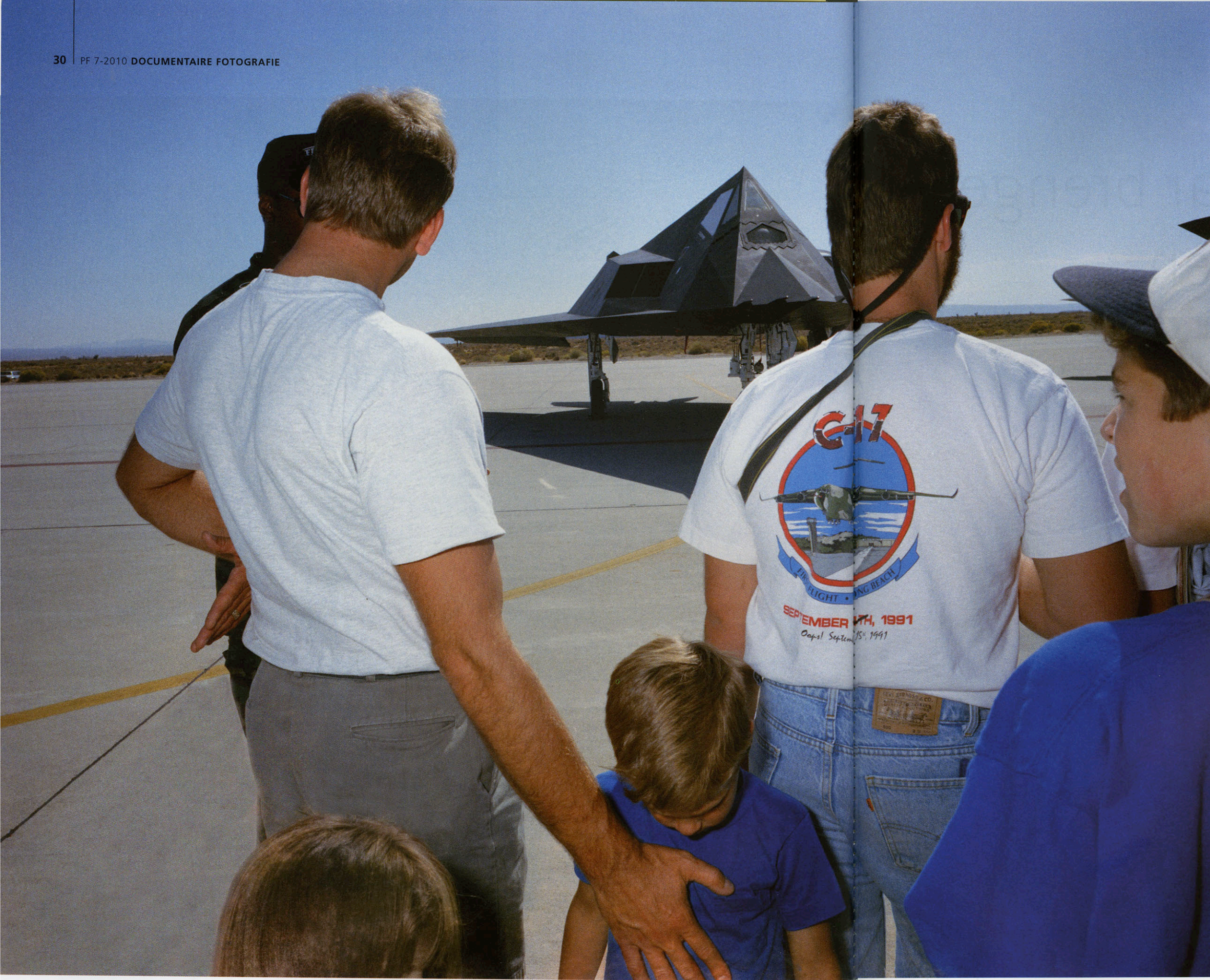
Uit Trinity: Presentatie Stealth bommenwerper, Fort Edwards, VS, 1992

kennis nodig heeft, gooi ik hem eruit. Ik heb geen zin er tekstjes onder te zetten. Het beeld moet zó werken."