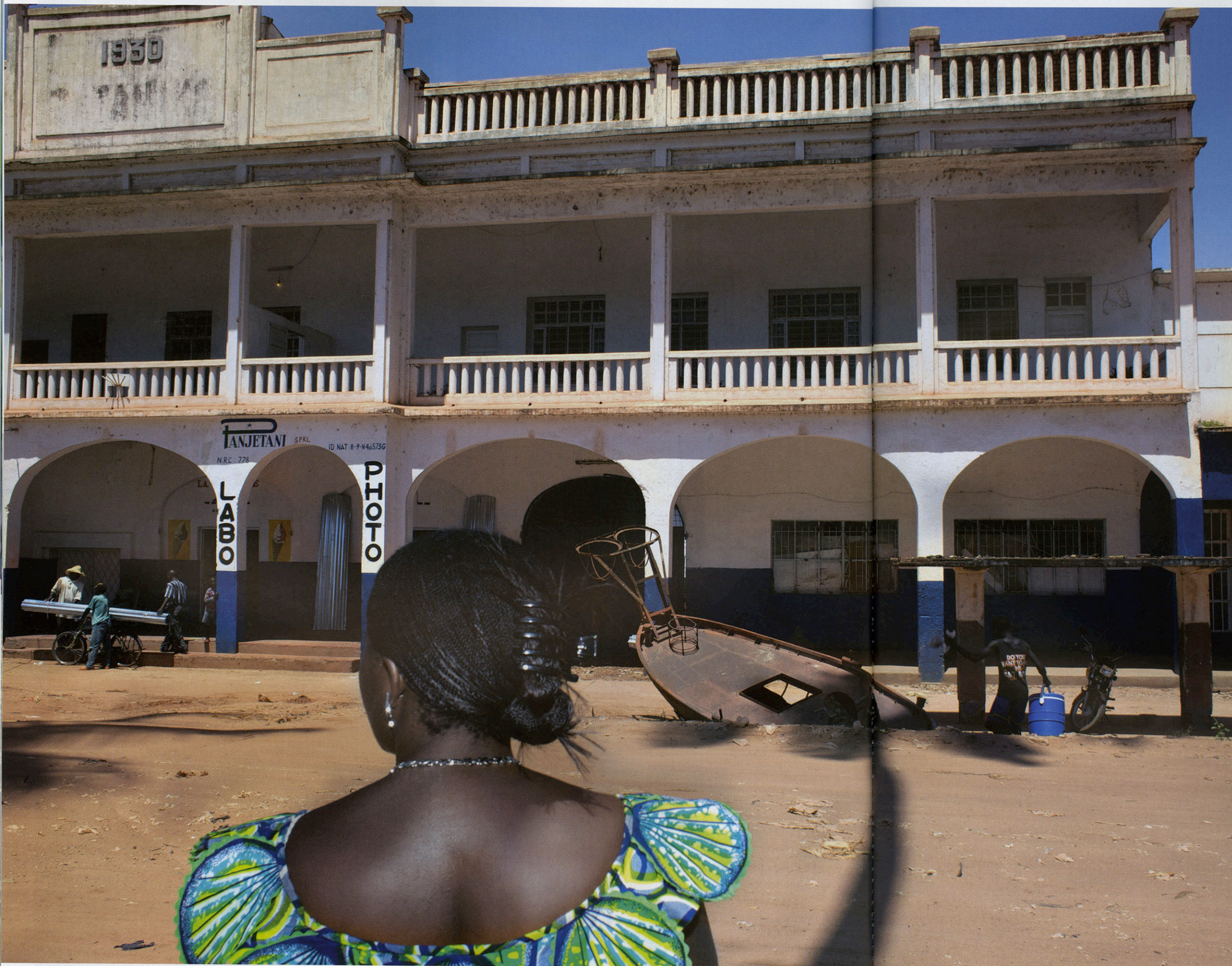
Uit Congo (belge). Hôtel Palace, Albertstad, Congo, 2008