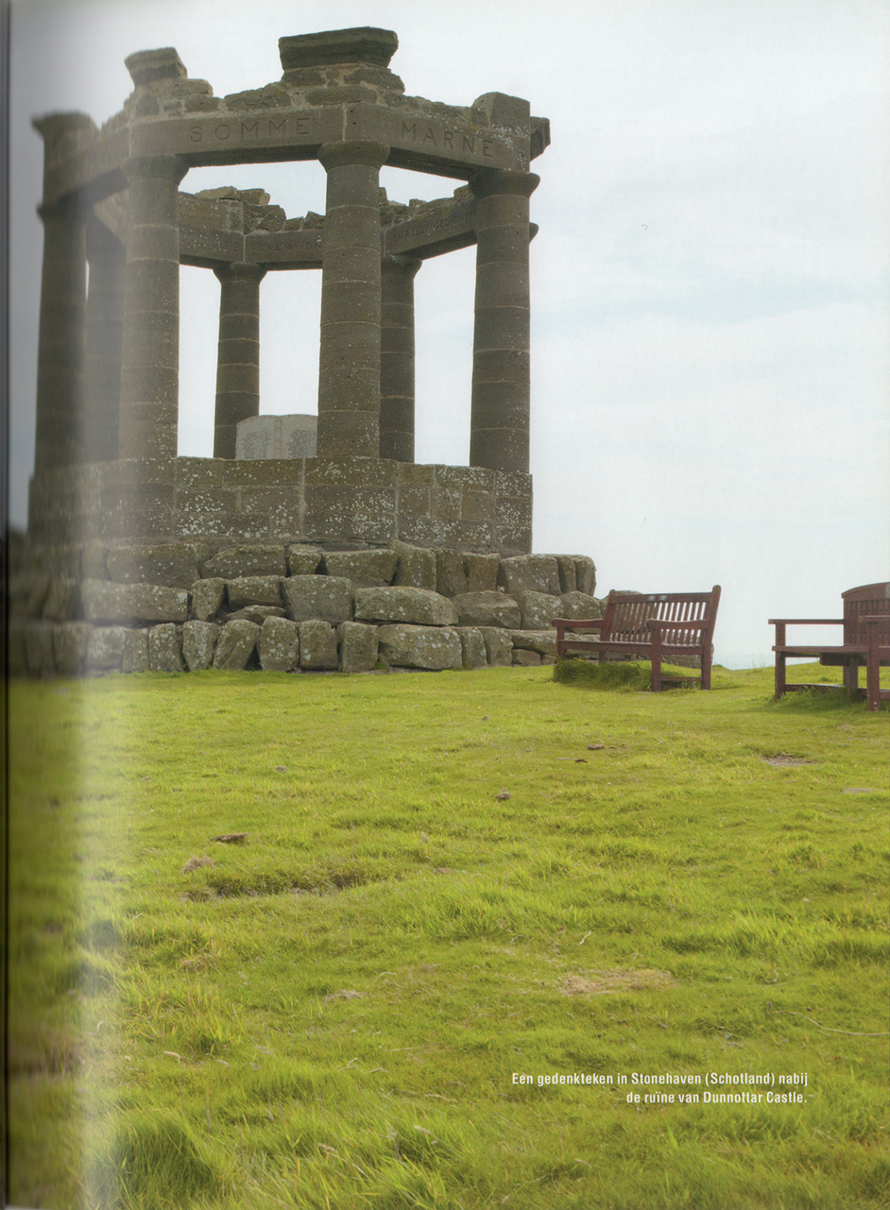
Een gedenkteken in Stonehaven (Schotland) nabij de ruïne van Dunnottar Castle.