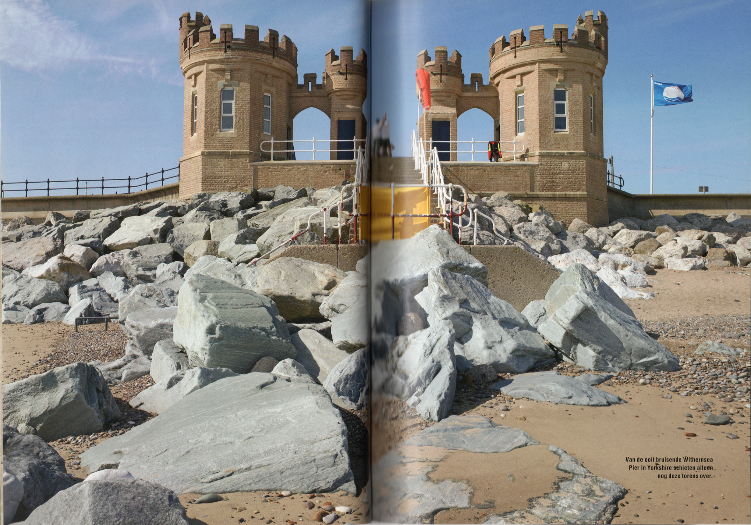
Van de ooit bruisende Withernsea Pier in Yorkshire schieten alleen nog deze torens over.