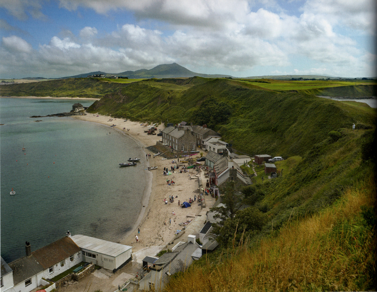
Het pittoreske vissersdorp Morfa Nefyn aan de noordkust van de Lleyl Peninsula in North Wales.

huidige beelden zijn, zowel in omvang als in resolutie (65 miljoen pixels), niets minder dan monumentaal. Dankzij de allernieuwste technieken bereikt hij een nimmer vertoonde fijnmazigheid: voor het eerst is een foto scherper dan een schilderij. Dat laat een foto anders 'lezen'.