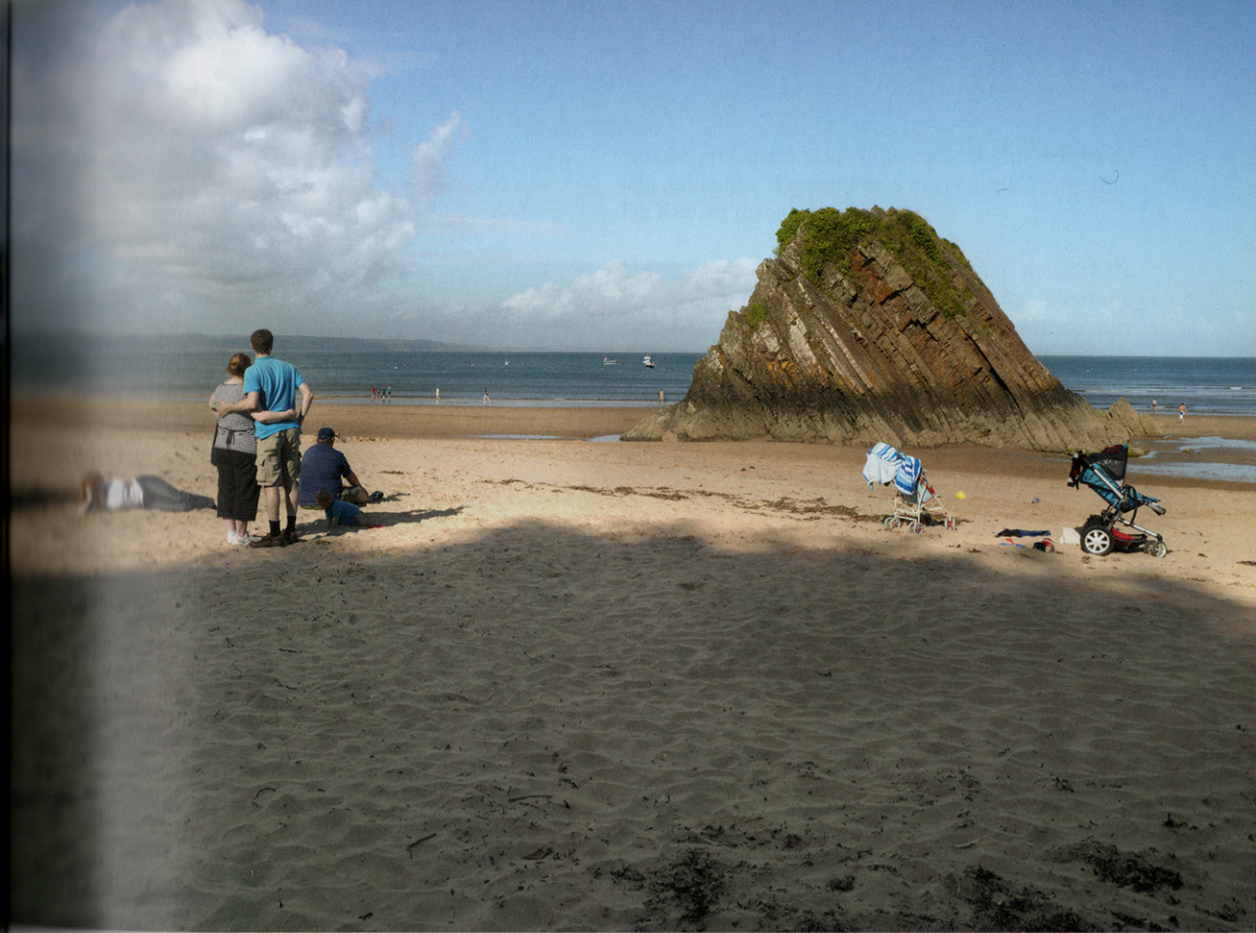
De rots van Goskar aan de noordkant van het strand van Tenby in Pembrokeshire.

in een tempo van vier maanden per jaar de kusten van Europa af. De hier getoonde foto's van de Engelse kustlijn stemmen bepaald niet vrolijk: ijle landschappen, desolate stranden, verlaten hotels, winterse pieren, akelige havenkranen, troosteloze kliffen en dramatische wolkenpartijen. De in de beelden tastbare spanning is niet die van onheil, maar juist van de dreiging ervan. Door die onderhuidse spanning kan het triviale buitengewoon geladen worden. Carl De Keyzer vertelde me hierover: "Ik wil niet de ramp fotograferen, maar het wachten op de ramp. En ik wil na-gaan in hoeverre dat wachten en het daarbij horende afweren iets duidelijk maken over Europa in dit nieuwe millennium. Net zoals Godot pas zin verleent aan het absurde door niet te komen opdagen."