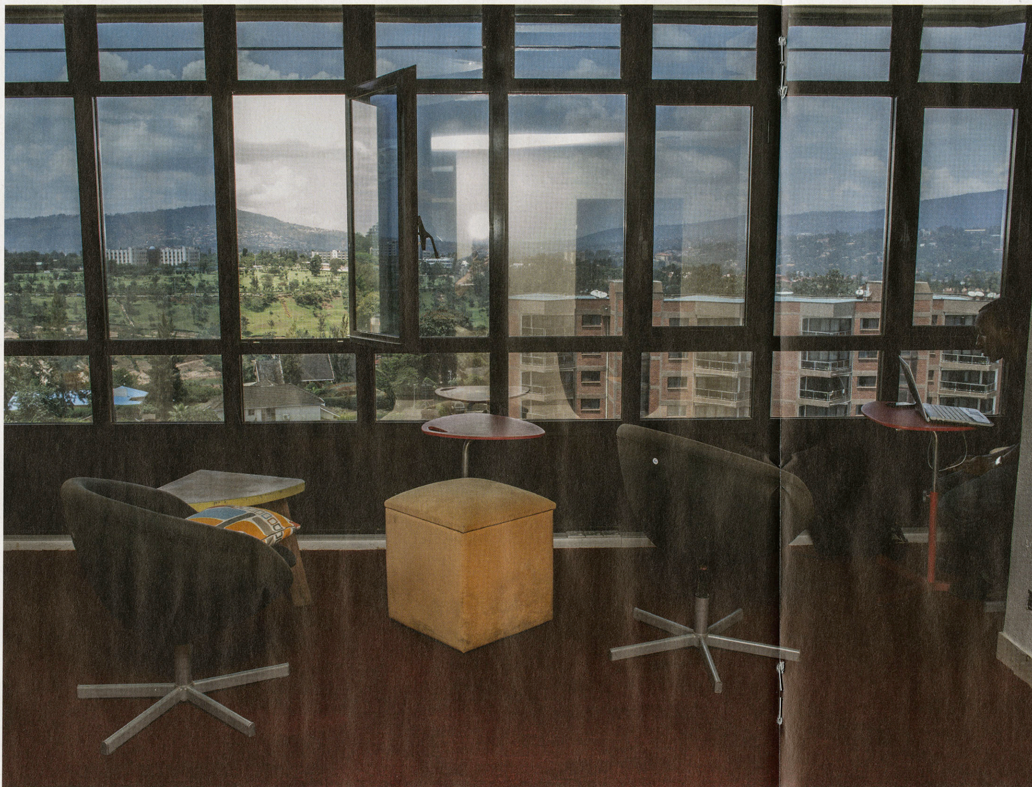
kLab, een IT-centrum voor jongeren in de hoofdstad Kigali.

In de marge van een herdenkingsplechtigheid naar aanleiding van 20 jaar genocide in het Amahoro-stadion in Kigali.