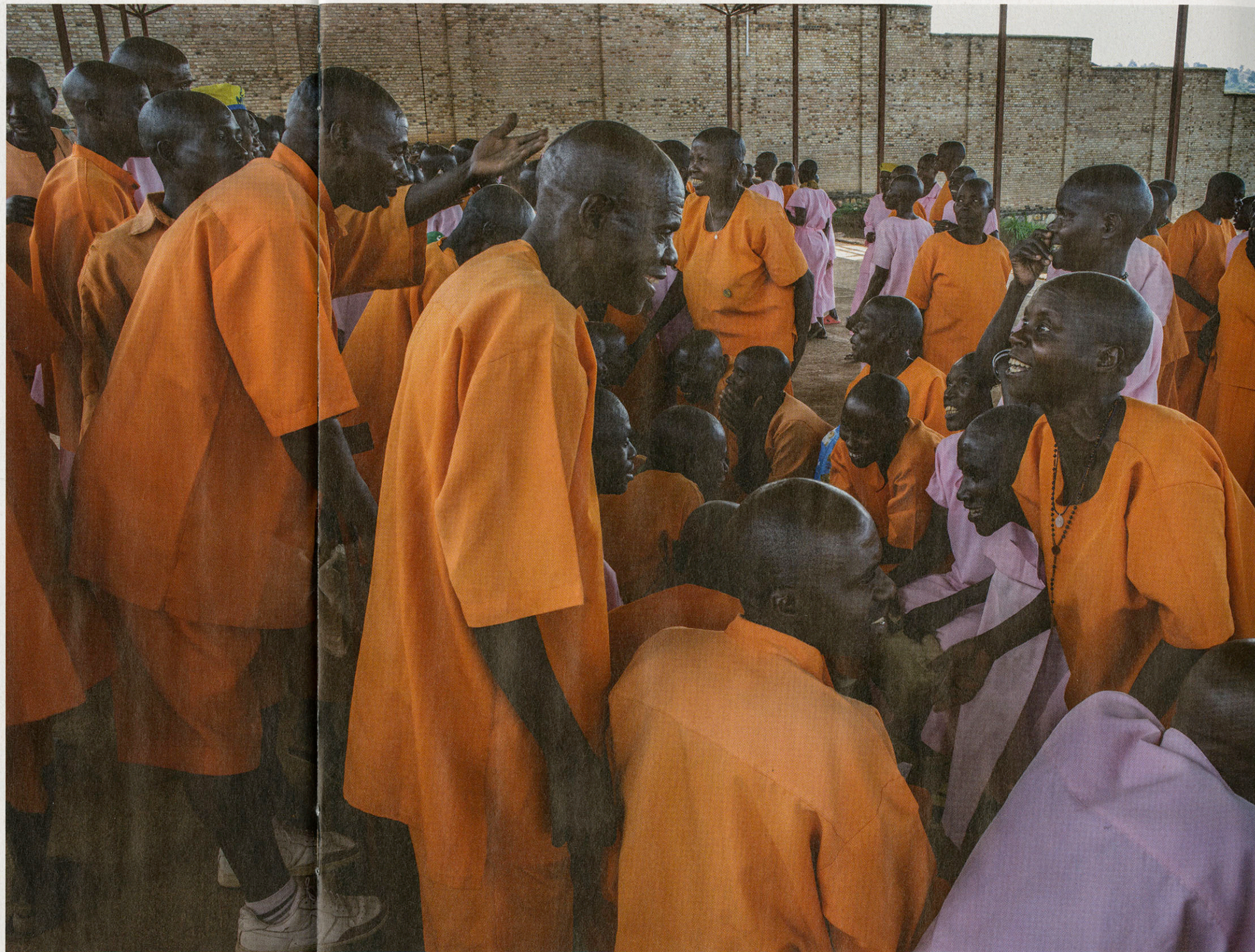
De gevangenis van Butare, in het zuiden van het land. De opgesloten mannen en vrouwen, van wie 80 procent verdacht is van deelname aan de genocide, zijn van elkaar gescheiden en mogen elkaar een halfuur per week zien.