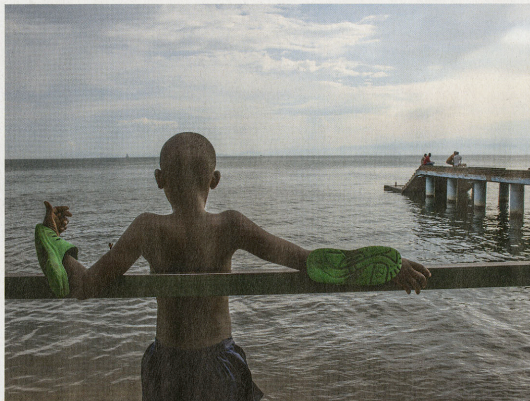
Het strand van Gisenyi, in het noordwesten van het land.