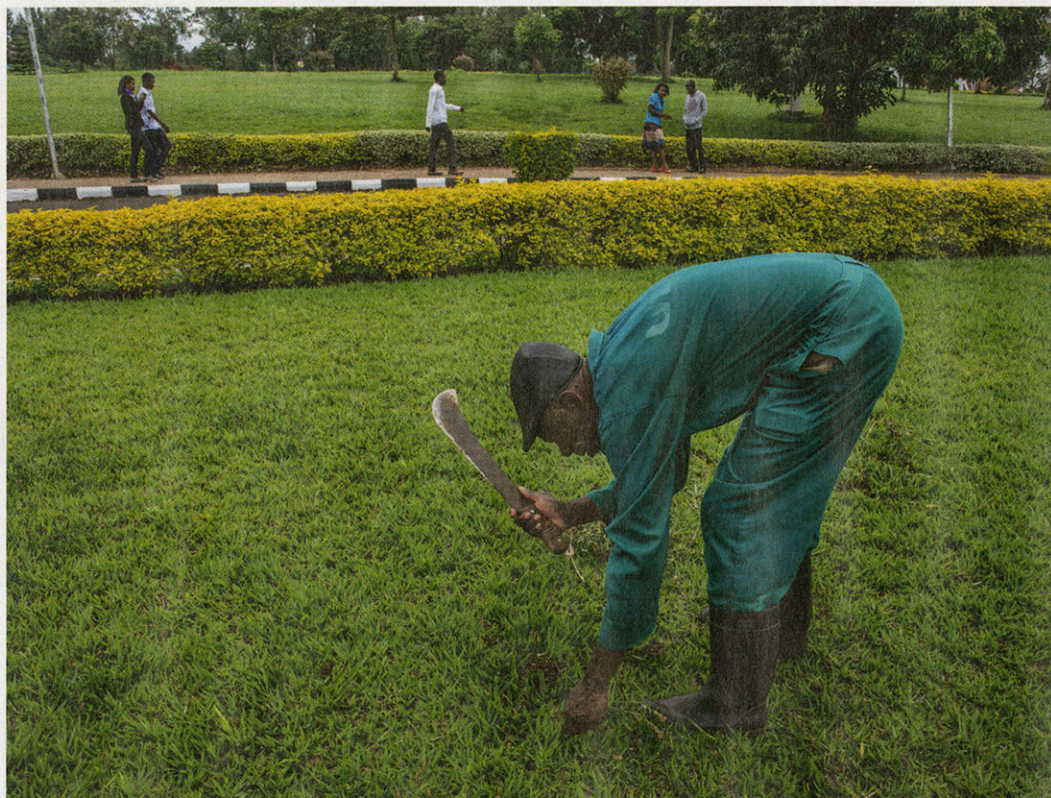
Tuinman aan de universiteit in Kigali.