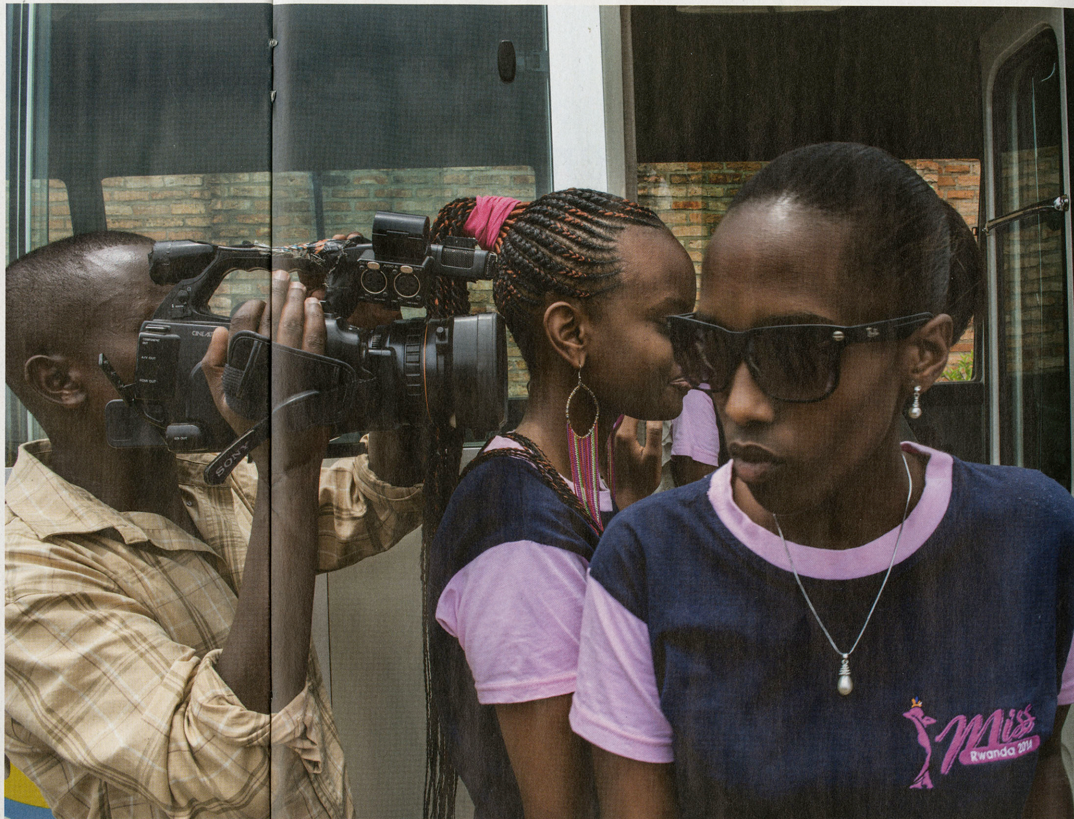
Miss Rwanda-kandidates bezoeken een weeshuis in Rulindo, ten noorden van Kigali.