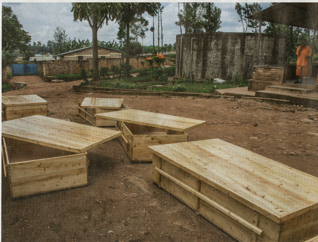
Er worden nog altijd massagraven blootgelegd. De gevangenen van Butare moeten kisten maken voor de lijken.