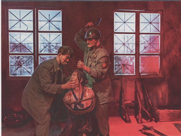
De Morgen

Korea klaar is om kernbommen te lanceren", zegt hij dan. "Ik zou het eerder van Trump verwachten. Maar toch heb ik een beetje schrik. En als Pyongyang gebombardeerd wordt tot een nieuw leper, dan zou mijn reeks wel heel cynisch worden."