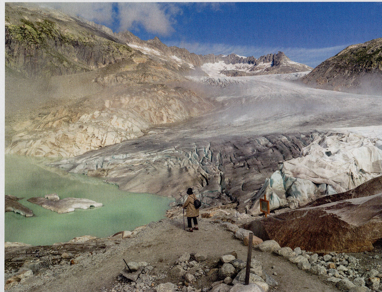
Uit 'Higher Ground' van Carl De Keyzer.

We kunnen daar als hedendaagse heidenen en sceptici wat