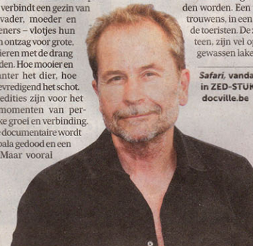
Regisseur Ulrich Seidl filmt de trophy hunters tijdens de jacht en laat hen ook hun verhaal doen.

Safari, vandaag en 30 maart in ZED-STUK docville.be