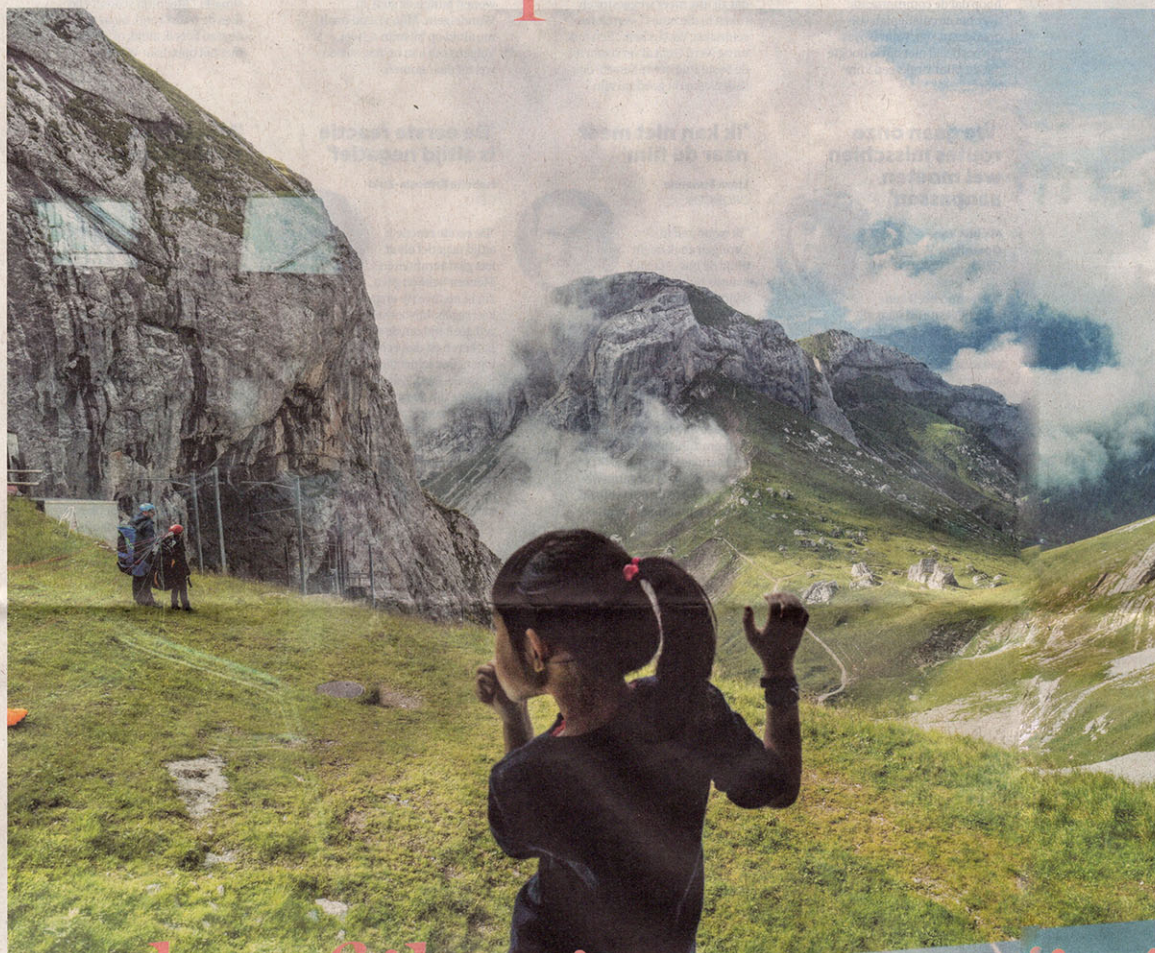
In de reeks Higher Grounds creëert De Keyzer een utopische maatschappij hoog in de bergen.